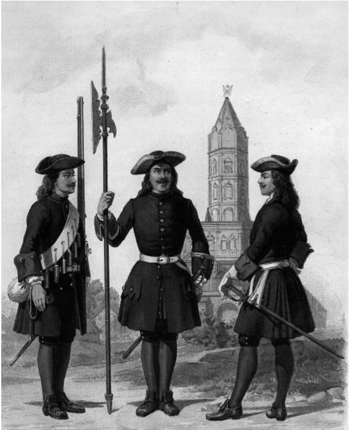
Преображенцы в 1700 году. Литография. 1899 год

Перед тем как начать борьбу со шведами за выход на Балтику, Петр получил заверения в поддержке со стороны Дании, Речи Посполитой и Саксонии, но участие этих держав в итоге осталось незначительным. Чтобы обезопасить себя от возможного удара с тыла, царь заключает договор о мире с Османской империей сроком на тридцать лет и 19 (30) августа 1700 года объявляет войну Швеции.