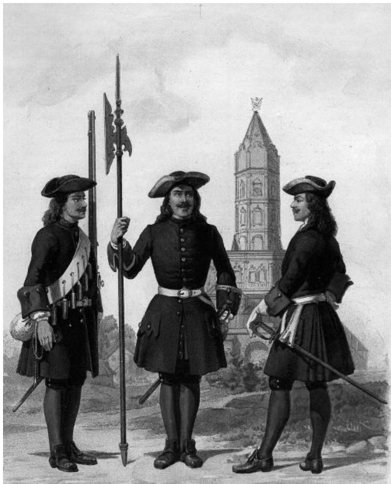
Преображенцы в 1700 году. Литография. 1899 год