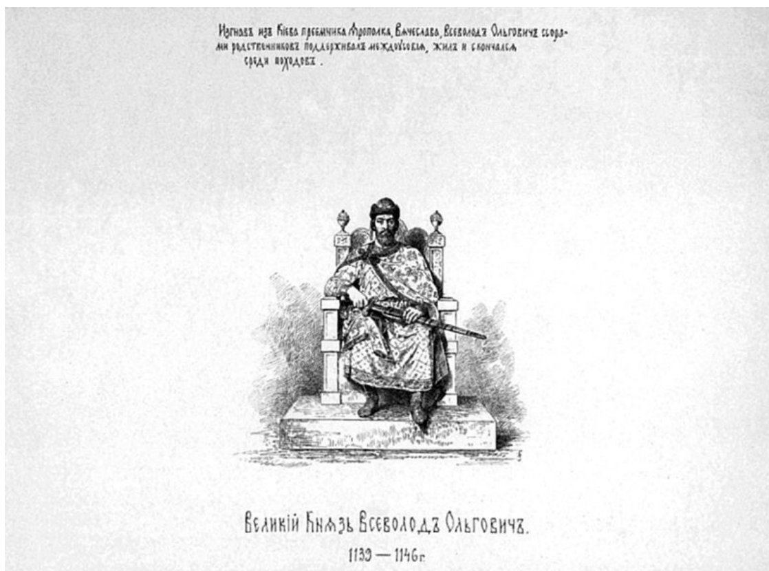
Великий князь Всеволод Ольгович. Художник В.П. Верещагин

Нечего говорить о потомстве младших сынов Ярославовых, Вячеслава, которого единственный сын бездетный умер при жизни дядей, и Игоря, которого два сына умерли также до кончины Мономаховой, а внуки – до кончины его сынов, потому что из их потомков никому не приходилось быть старшим в роде Ярослава.