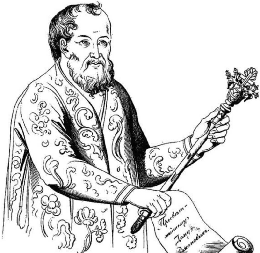
Князь Д. М. Пожарский. Старинная гравюра

Или Пожарские не считывались с Полоцкими лествицею, потому что «разошлись от прародителей далече» 64 .