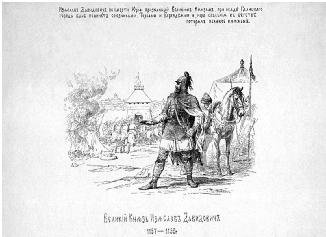
Великий князь Изяслав Давидович. Художник В.П. Верещагин

У Ярослава старший сын был Владимир, который умер еще при его жизни. Сын Владимир, Ростислав, отравленный в Тмутаракани, оставил трех сынов, которые получили от Всеволода червенские города, и никогда, равно как и потомки их, галицкие князья, не объявляли своих притязаний на великое княжество. Неужели никому из них, происходивших от старшего сына Ярославова, не случилось быть старшим во всем потомстве? Род их был старше Изяславичей и Мономаховичей.