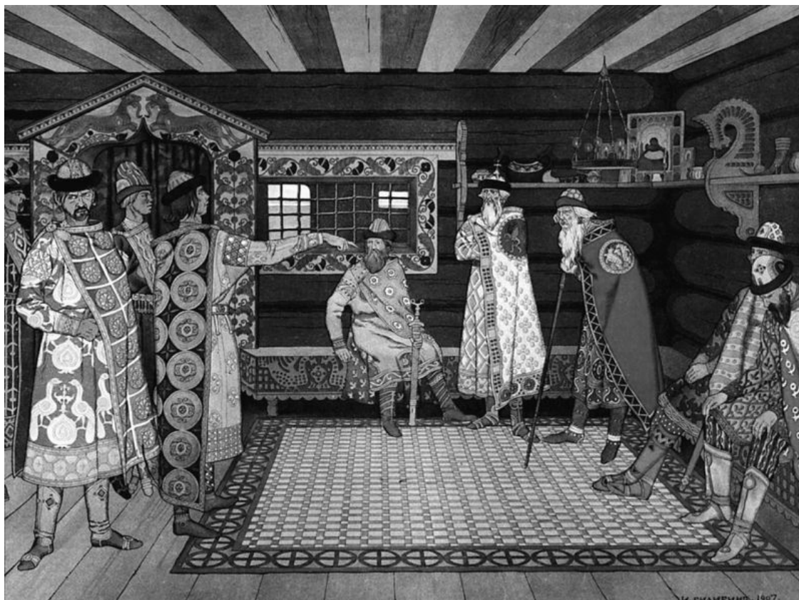
Съезд князей. Художник И. Я. Билибин

Олег Святославич, изгнанный из Чернигова за первоначальный отказ явиться на этот съезд, говорит под г. 1095 Изяславу, сыну Мономаху 45 : «Иди княжить в свою Ростовскую область. Отец твой отнял у меня Чернигов, неужели и в Муроме, наследственном моем достоинии, вы лишите меня хлеба?»