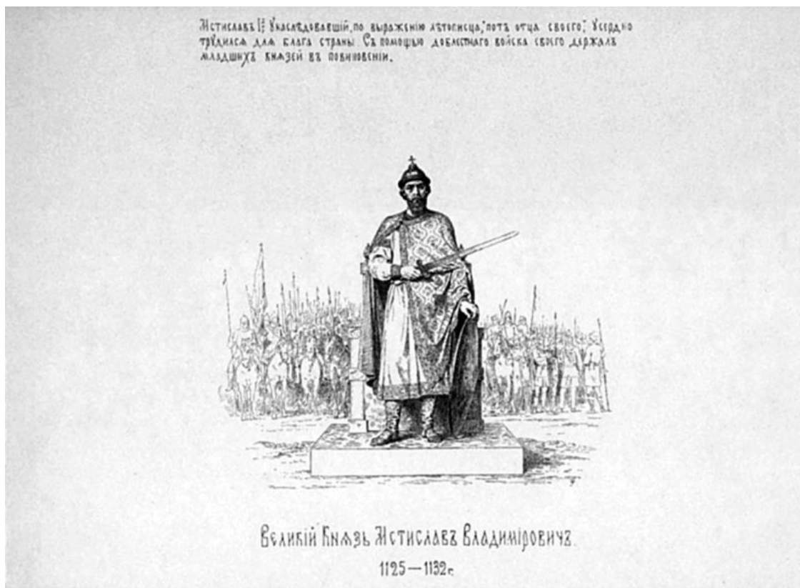
Великий князь Мстислав Владимирович. Художник В.П. Верещагин

Обратимся к периоду, – не скажу, более ясному, но более богатому, по крайней мере указаниями, – предлагающему более средств решать задачи. Я говорю о периоде местничества, которое уже доставило нам многие полезные положения для первого нашего исследования и содействовало нам отыскать отчинное право или, по крайней мере, укрепило, подтвердило нашу догадку.