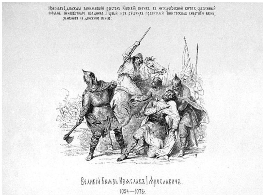
Великий князь Изяслав Ярославич. Художник В. П. Верещагин

Если право старшинства ограничивалось только отчинным правом, то Мстислав не должен был наследовать Киева прежде старших своих троюродных братьев, а их отец так же владел Киевом, как и его.