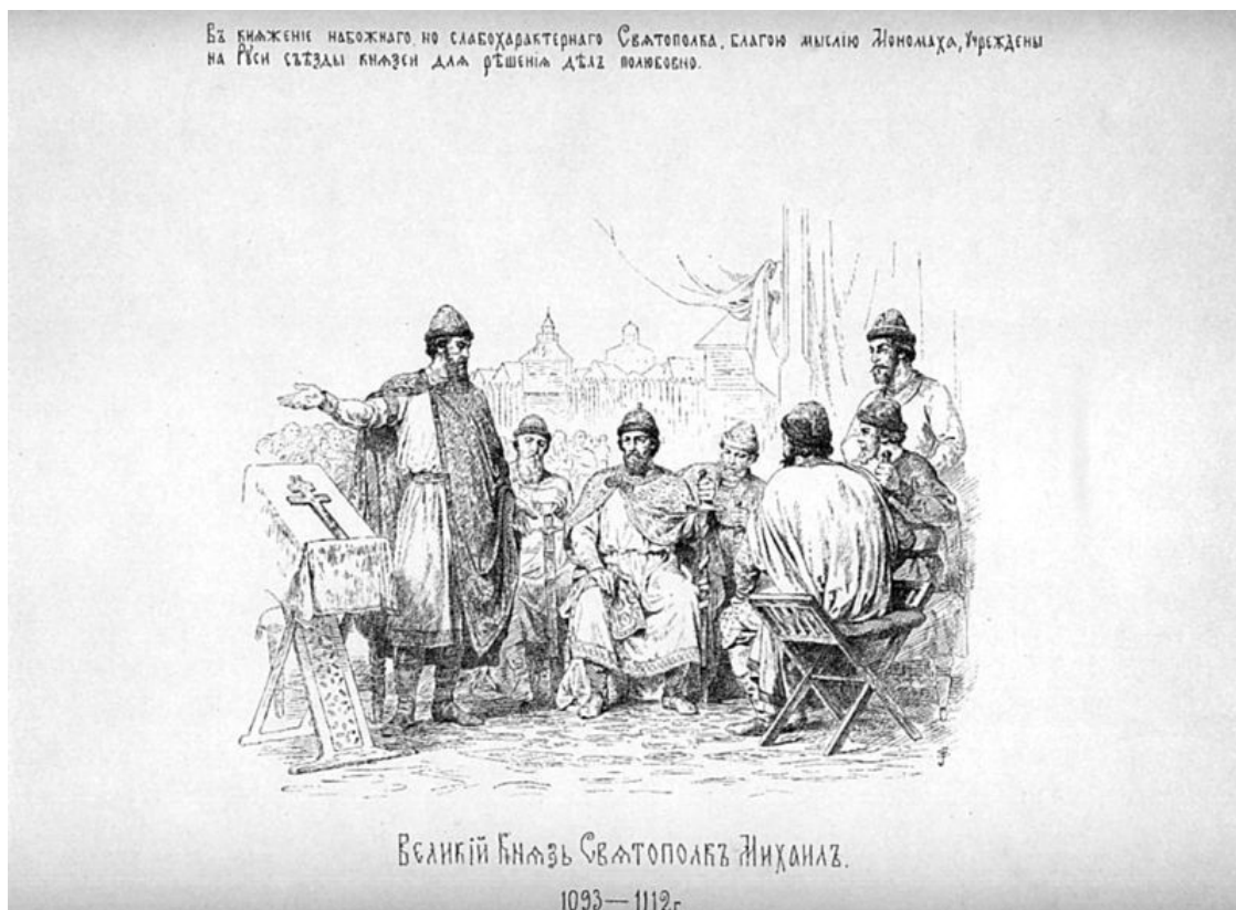
Великий князь Святополк на съезде князей. Художник В.П. Верещагин

Потому и Ростиславичи не должны были думать о Киеве: ибо родоначальник их, Владимир, умер при жизни отца, Ярослава, и, следовательно, не владел Киевом. Сын его Ростислав – так же умер, отравленный в Тмутаракани. Дети Ростиславовы получили от Всеволода уделы, которые и остались в их роду, пока он велся, Галицкое княжество.