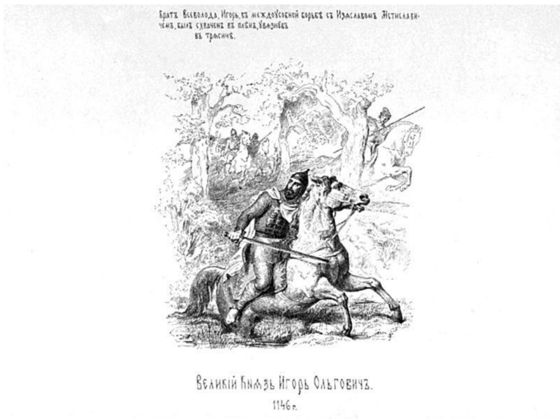
Великий князь Игорь Ольгович. Художник В.П. Верещагин

Станем рассуждать об этом праве сперва а priori.