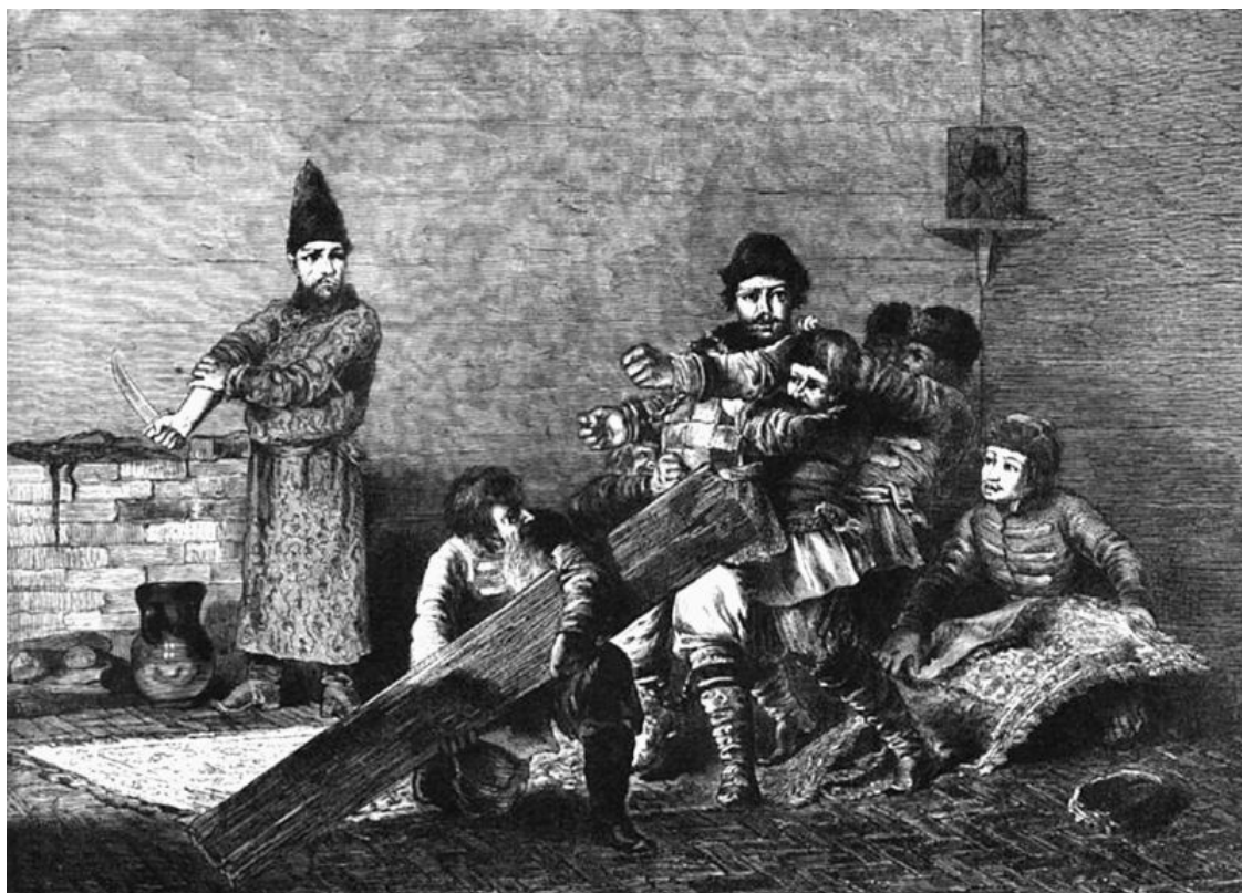
Ослепление князя Василька Ростиславича. Старинная гравюра

Давид Игоревич лишен был верно по тому же закону своей области за ослепление Василька в 1097 году: «Область Владимирская уже не твоя отныне, ибо ты был причиною вражды и злодейства неслыханного в России», – говорят ему князья по переводу Карамзина 31 .