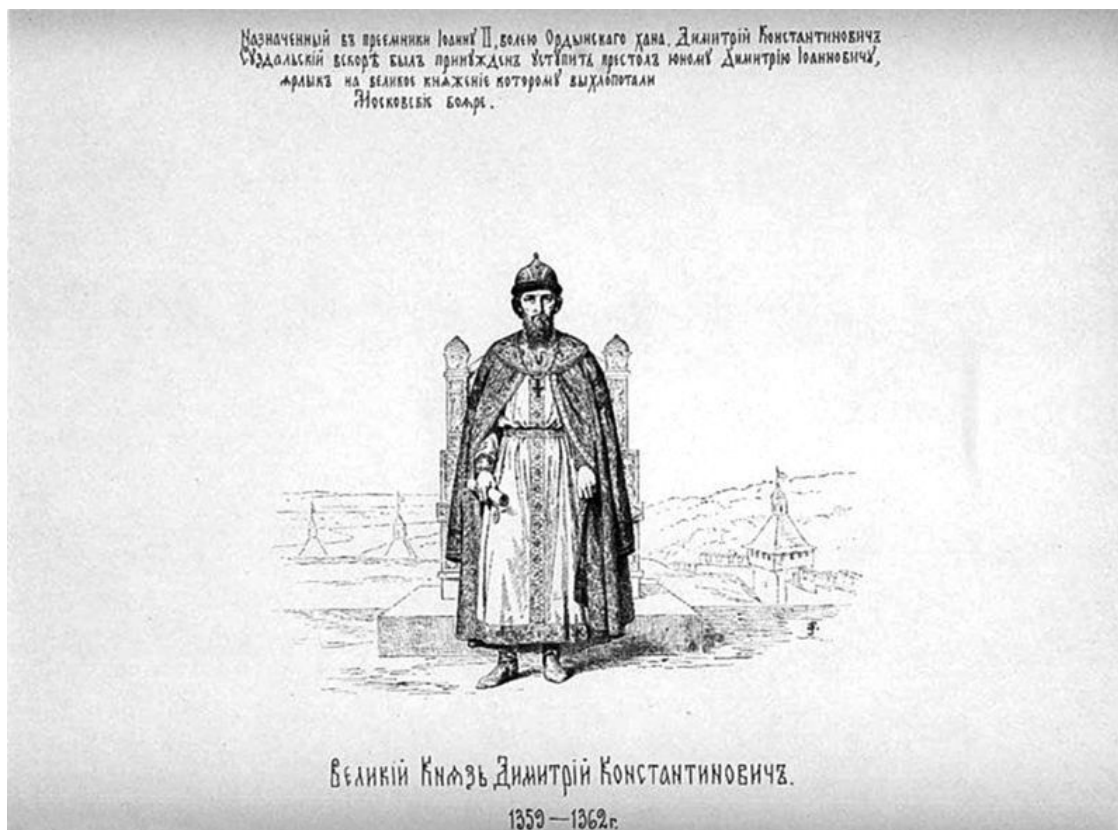
Великий князь Дмитрий Константинович. Художник В. П. Верещагин

Это понятие о праве было укоренено глубоко и продолжалось даже и тогда, когда Москва сделалась государством, и когда удельные княжества переменили совершенно свой характер и не имели никакой значительности.