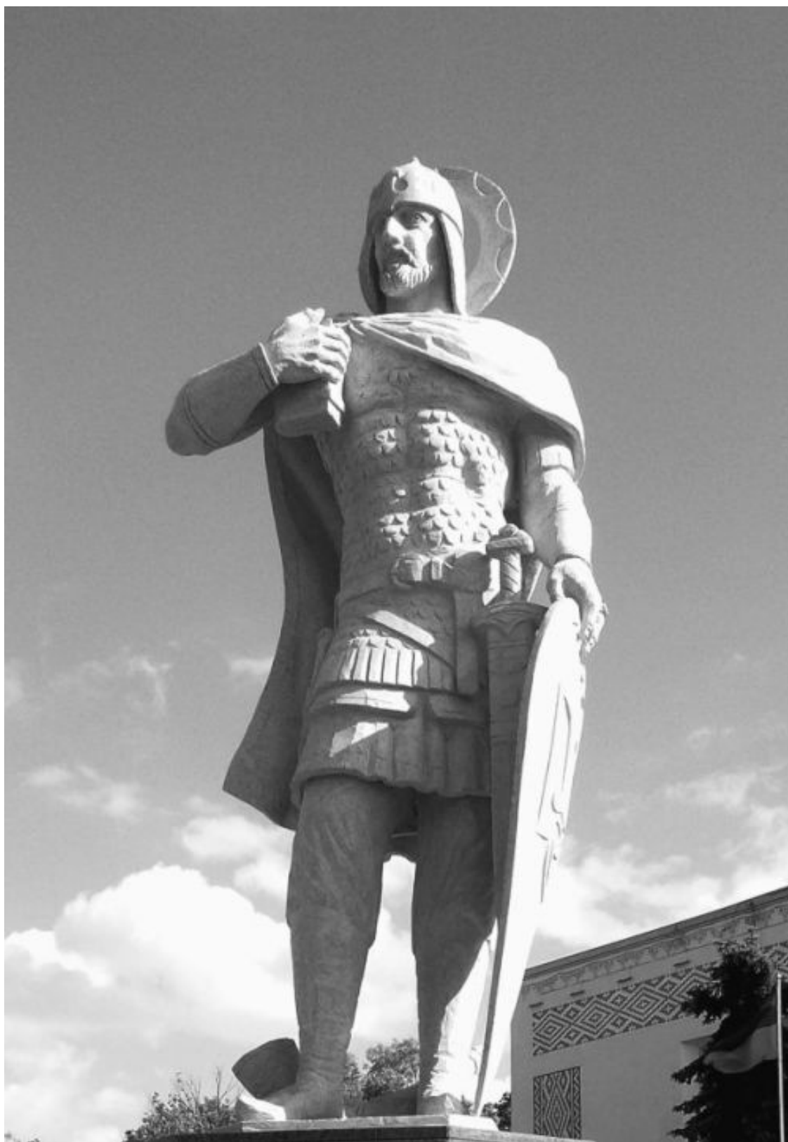
Памятник князю Борису в Борисполе

«Седи на своем столе в Киеве, понеже ты еси старейший » 4 , – говорит Мстислав Ярославу 5 , победив его в 1024 г.