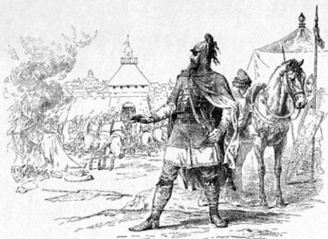
Великій Князь Изяславъ Давидовичъ.

Изяславъ Давидовичъ по смерти Юрія признавши Великаго Князя, при осаде Галицкаго города былъ покинута союзниками. Торками и Берендями и, нища спасеніемъ въ бѣгство, потерялъ великое княженіе.