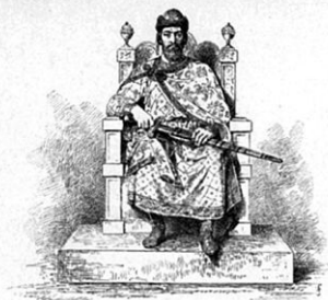
Великій Князь Всеволодъ Ольговичъ.

Рогнеда из Киева преемница Ярополка, Вячеслава, Всеволода Ольговича со- вмѣстительница подданства иудейства, жила и сначала свѣдѣла иудеев.