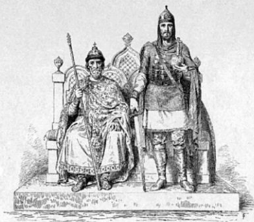
Великій князь Изяславъ Мстиславичъ и дядя его Вячеславъ Владимировичъ.

Изяславъ II добровольно раздалъ престолъ Киевскій съ дядею своимъ Вячеславу Владимировичу, сичасъ сѣе повѣстѣи о томъ изъ старинныя поглаголю и разсказаніи народа. По смерти Изяслава, преставленъ дядя призналъ сыновъ своихъ и государя Росіи Изяслава, но посѣдши вѣрнѣе пріятель тотчасъ по кончинѣ дяди.