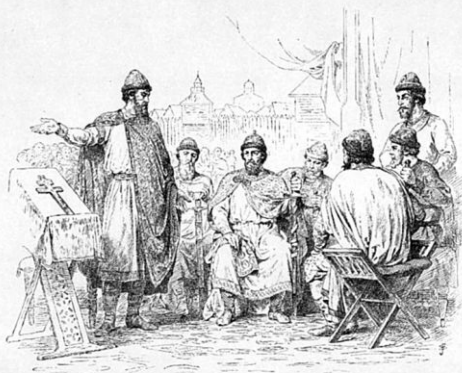
Великій Князь Святѣполкъ Микѣлазъ.

БѢ КНЯЖЕНІИ НЕДОЖНОГО ПО СЛАБОХАРАКТЕРНОМУ СВАТОПОЛКА, СЛАГОМЪ ИМѢЛИЮ НИКОЛАХА, КРЕЖДЕНІИ НА РІСНІ СЪЗДАЛИ КНЯЗІИ ДЛА РѢШЕНІА ДѢЛЪ ПРАВЕДНО.