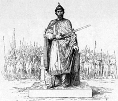
Великий князь Мстиславъ Владимировичъ.

Мстиславъ! Убавляеши, по выражению истинца, потъ отца своего; Усидано тубанаса для славы страны. Съ помощью двестиго войска своего держалъ младшихъ князей въ повиновении.