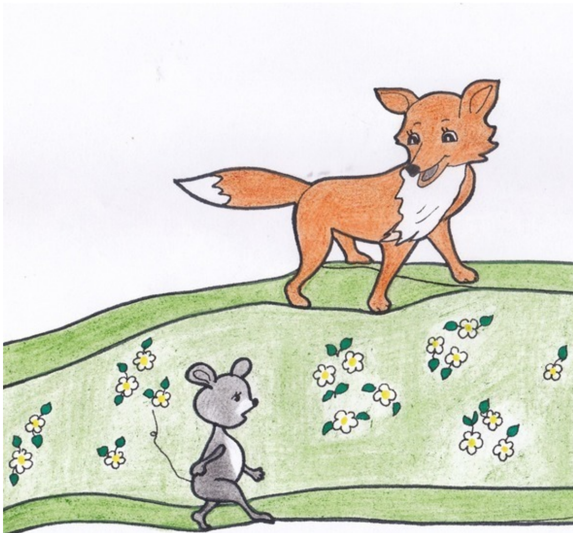
Экспедиция. Рис. А. Дубровиной