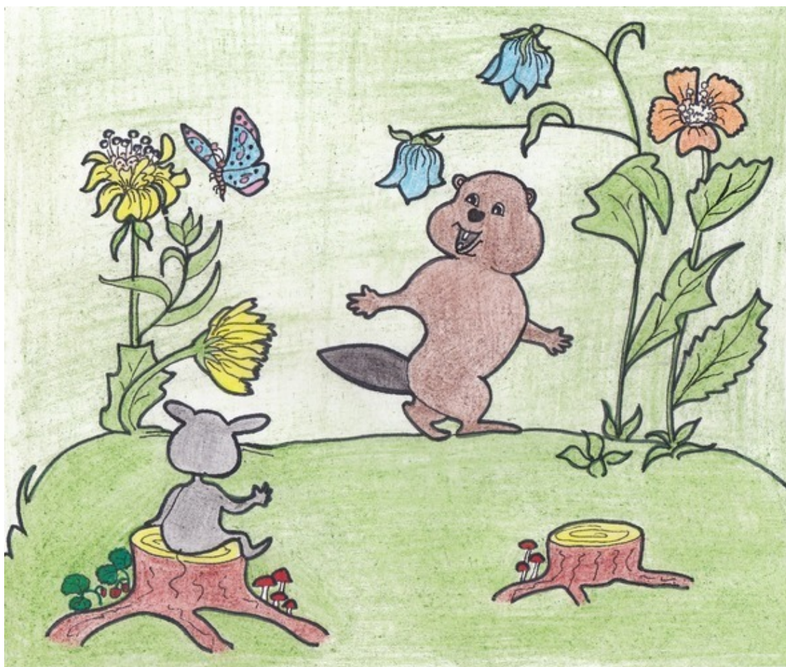
Бобрёнок и мышонок. Рис. А. Дубровиной

– Никогда не думал, что ты такой чувствительный, – удивился Мышонок. – А у тебя есть мечта?