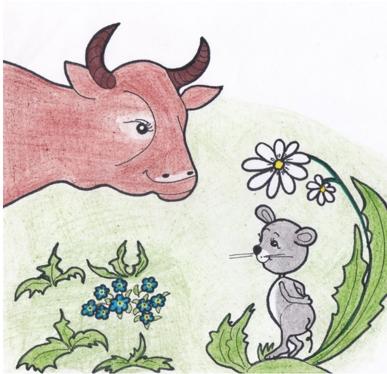
Корова и Мышонок. Рис. А. Дубровиной

– Это кто же там пищит? – удивилась Корова.