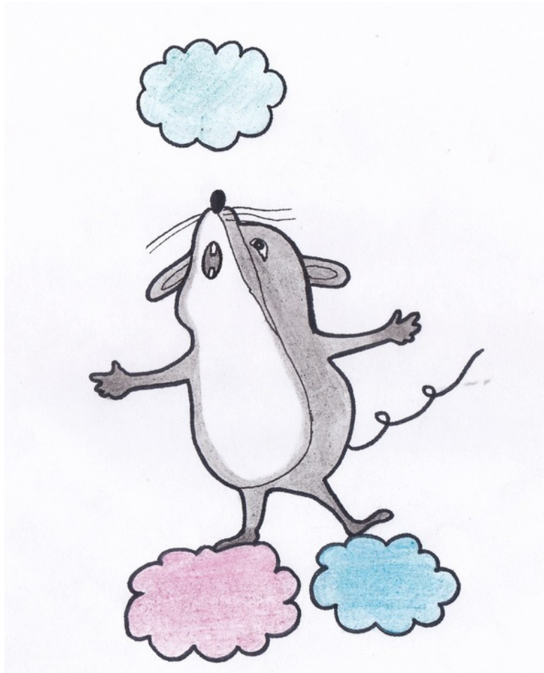
Мышонок мечтает. Рис. А. Дубровиной