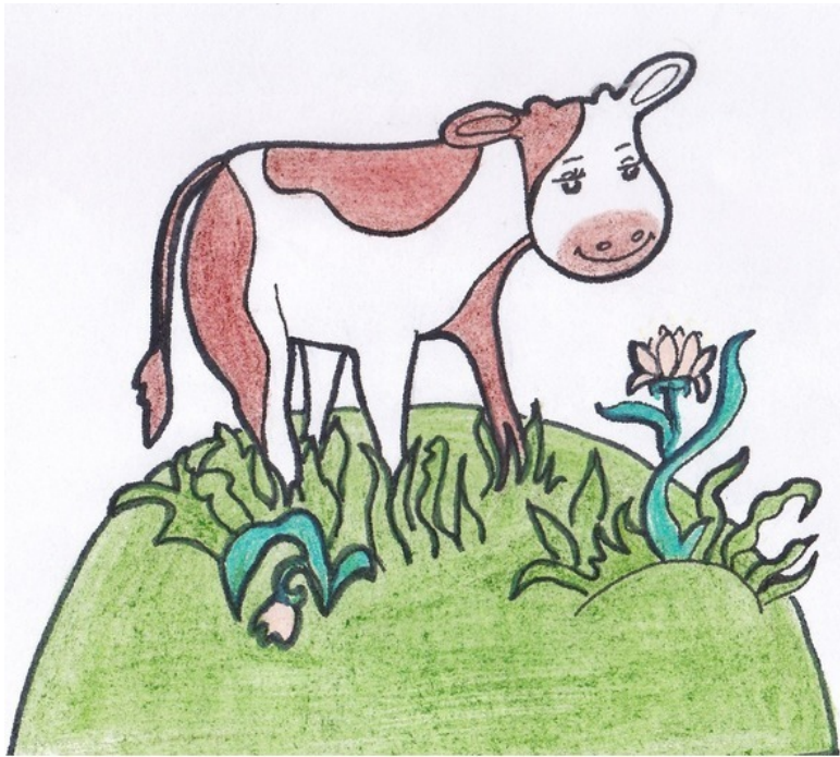
Телёнок на лугу. Рис. А. Дубровиной

Телёнок внимательно смотрел на неожиданных гостей. Потом в его голову пришла одна идея.