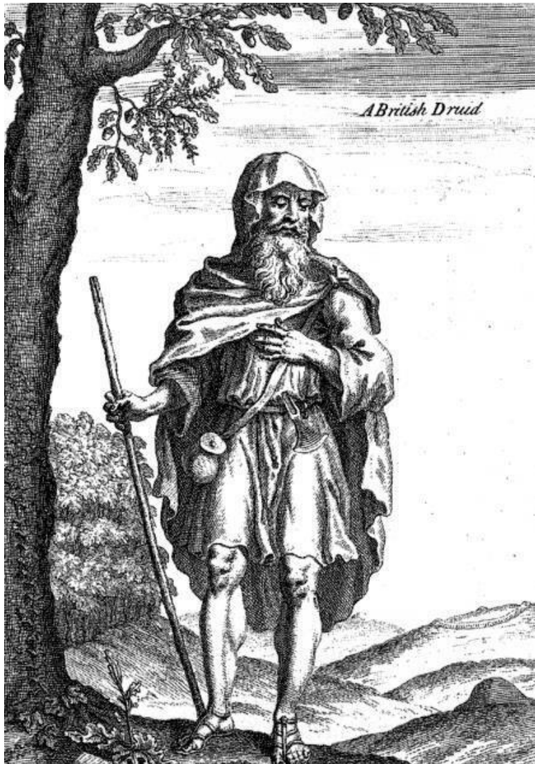
A British Druid