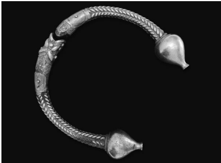
Золотой кельтский торквес. Ок. II в. до н. э.

Торквесы – шейные обручи – у кельтов были весьма распространены, как и у многих других народов. У славян аналогичные ожерелья именовались гривнами. Причем, что интересно, первоначально они являлись в основном женским атрибутом, но с течением времени превратились в украшение для мужчин, преимущественно воинов. Видимо, торквесы могли играть роль знака отличия, культового предмета или оберега, а также средства платежа – в захоронениях часто встречаются отдельные кусочки драгоценных ожерелий. Скорее всего, ими расплачивались просто как кусками драг-