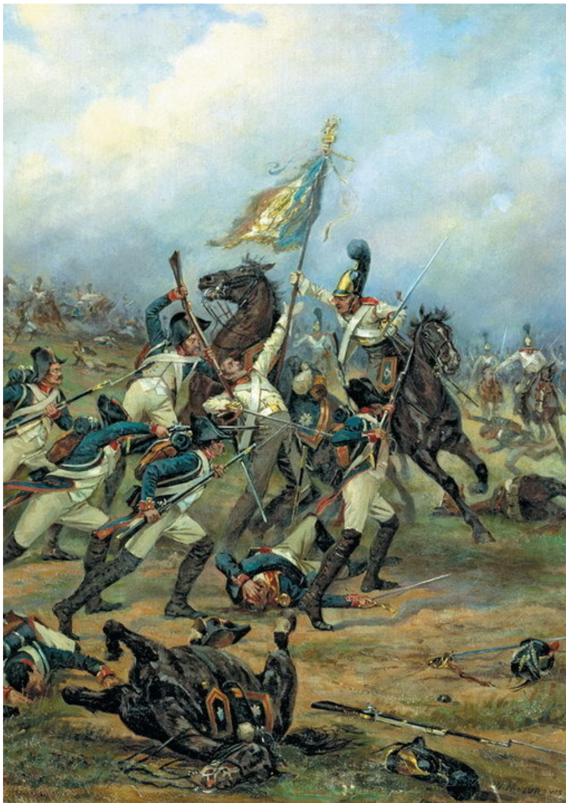
Мазуровский В. Бой за знамя (фрагмент)