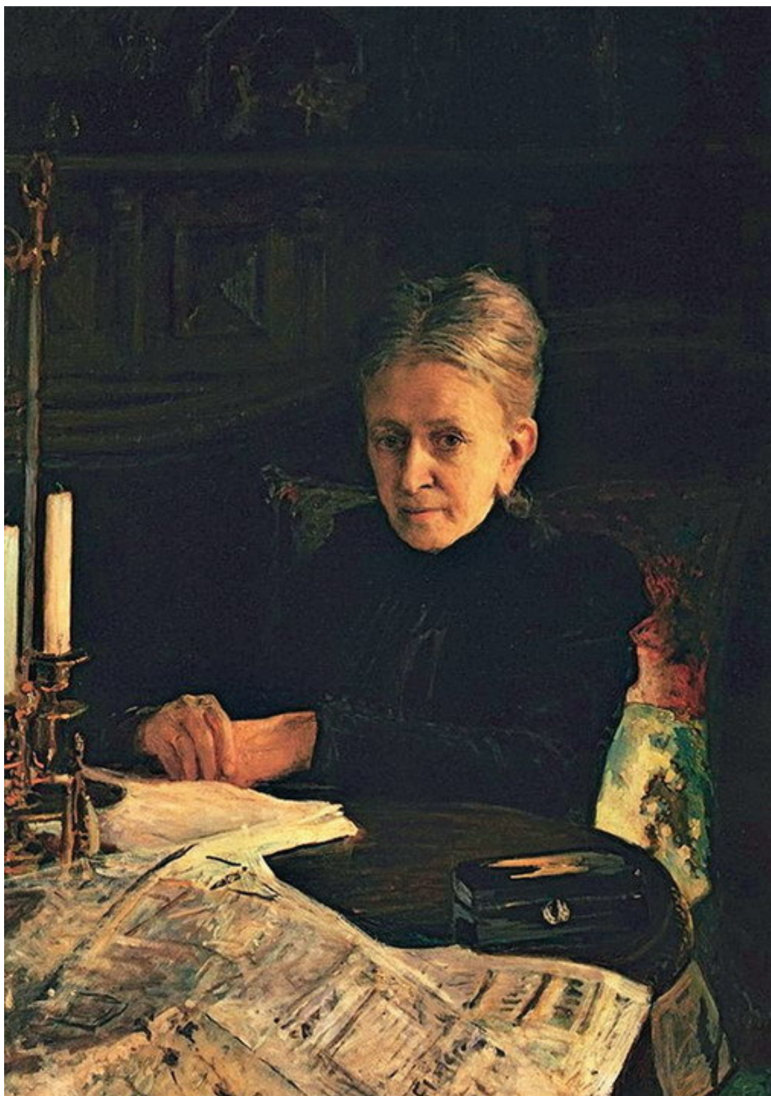
Ге Н. Н. Портрет писательницы и общественной деятельницы Елены Осиповны Лихачевой