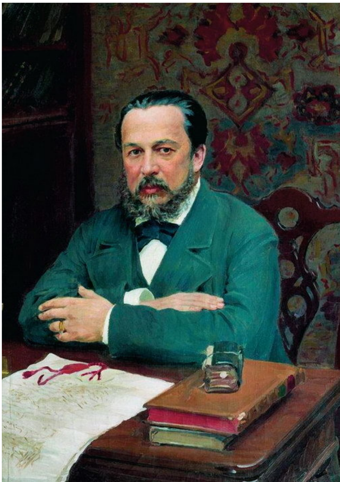
Куликов И. С. Портрет А. С. Уварова