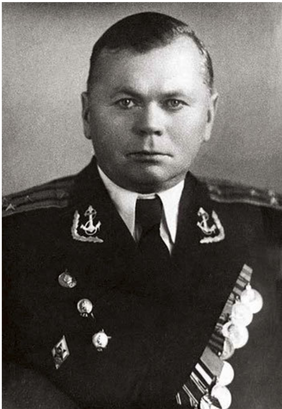
Капитан первого ранга, лауреат Государственной (Сталинской) премии Иван Иванович Заведеев