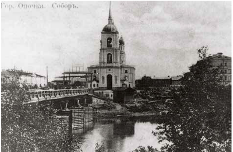
Гор. Опочка. Соборъ.

кто посмелее да потолковее – то и в Питер или Псков. Самые удачливые рыбаки отправлялись продавать рыбу, если было на чем ее везти. Самые невезучие – батрачили на других.