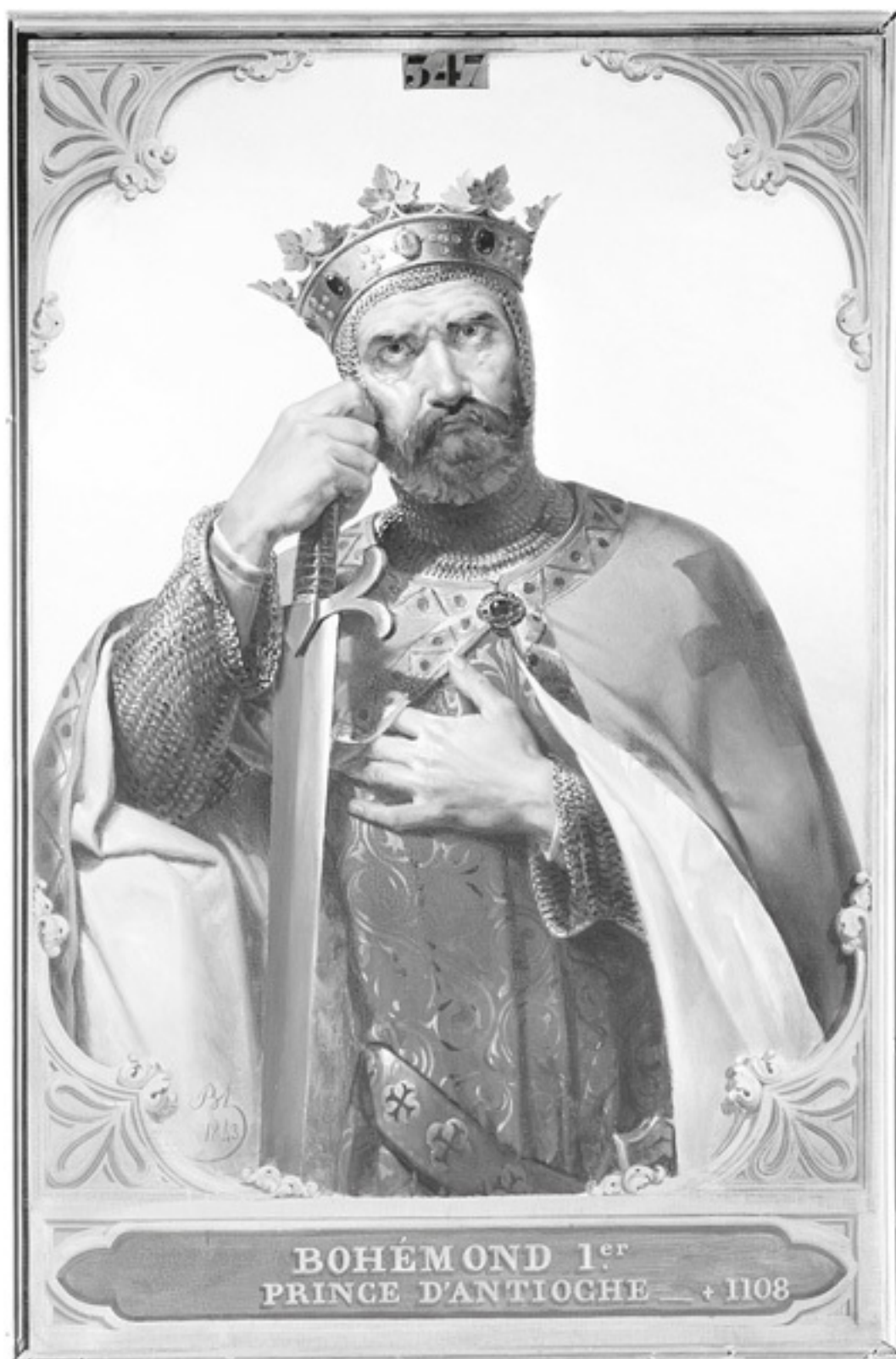
Мерри-Жозеф Блондель. Боэмунд I. 1843 г.

Но Данте ему это простил. Поэт возвысил Роберта за то, что тот был за папу, за западный обряд, за католичество. Данте только в теократической идее своего времени видел надежду на объединение Италии.