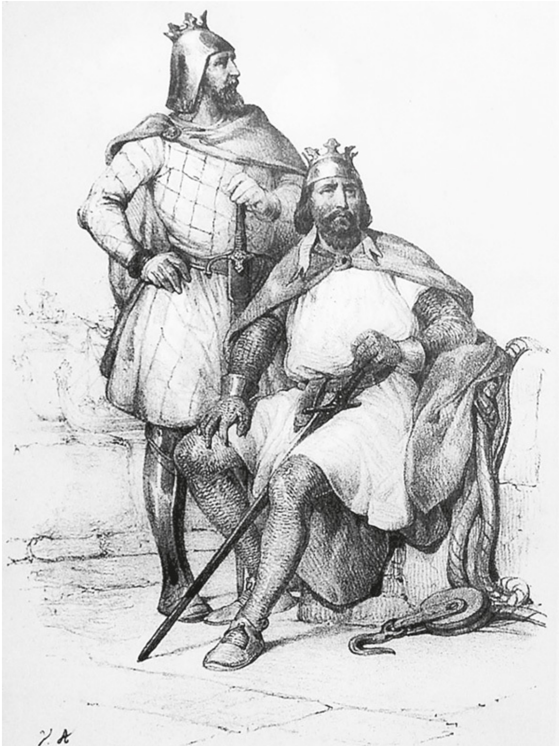
Роберт Гвискар (стоит) и его брат Рожер Сицилийский. Литография. Начало XIX в.

Нормандия сегодня – это северные французские департаменты: Манш, Кальвадос и другие, развитая индустриальная и вместе с тем романтическая область Франции. В XI веке это было место расселения северной группы германцев. В основном сюда пришли даны – те, кто жил на Ютландском полуострове, в будущей Дании.