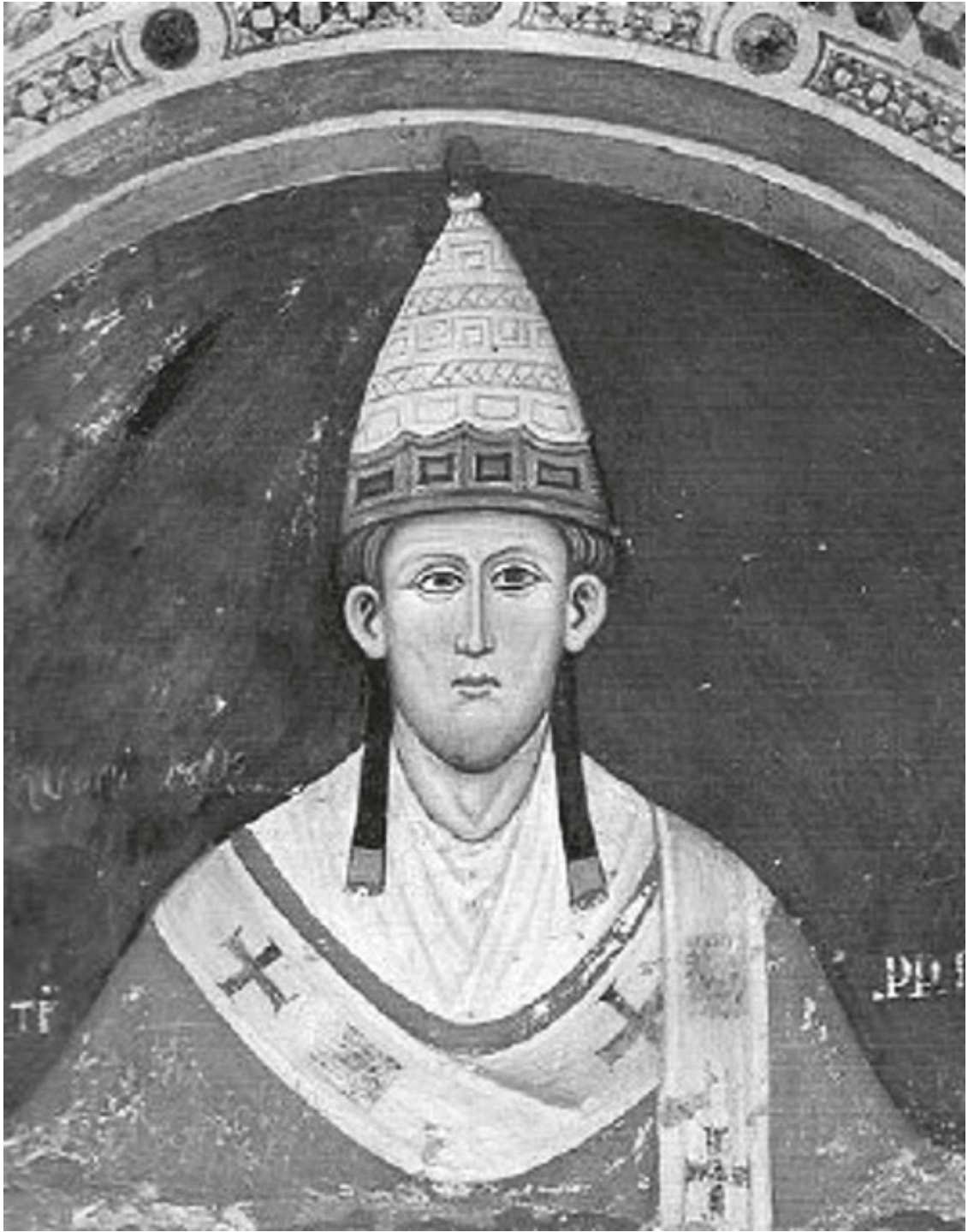
Неизвестный художник. Папа Иннокентий III. Фреска в монастыре Сакро Спеко. 1219 г.

Иннокентий III был невероятно гибок. Он то ссорился с государями, то мирился, умел их стравить, управлял всеми, его вассалами были виднейшие короли. Самое мрачное его деяние – Крестовый поход детей. Папа и здесь проявил гибкость. Он вроде бы сначала и не возражал против того, чтобы дети отправились на погибель. Некоторые исследователи говорят, что этот поход стал результатом перенаселения и голода. Дети погибали, их отправляли в рабство... И только в последний момент Иннокентий начал некоторых возвращать.