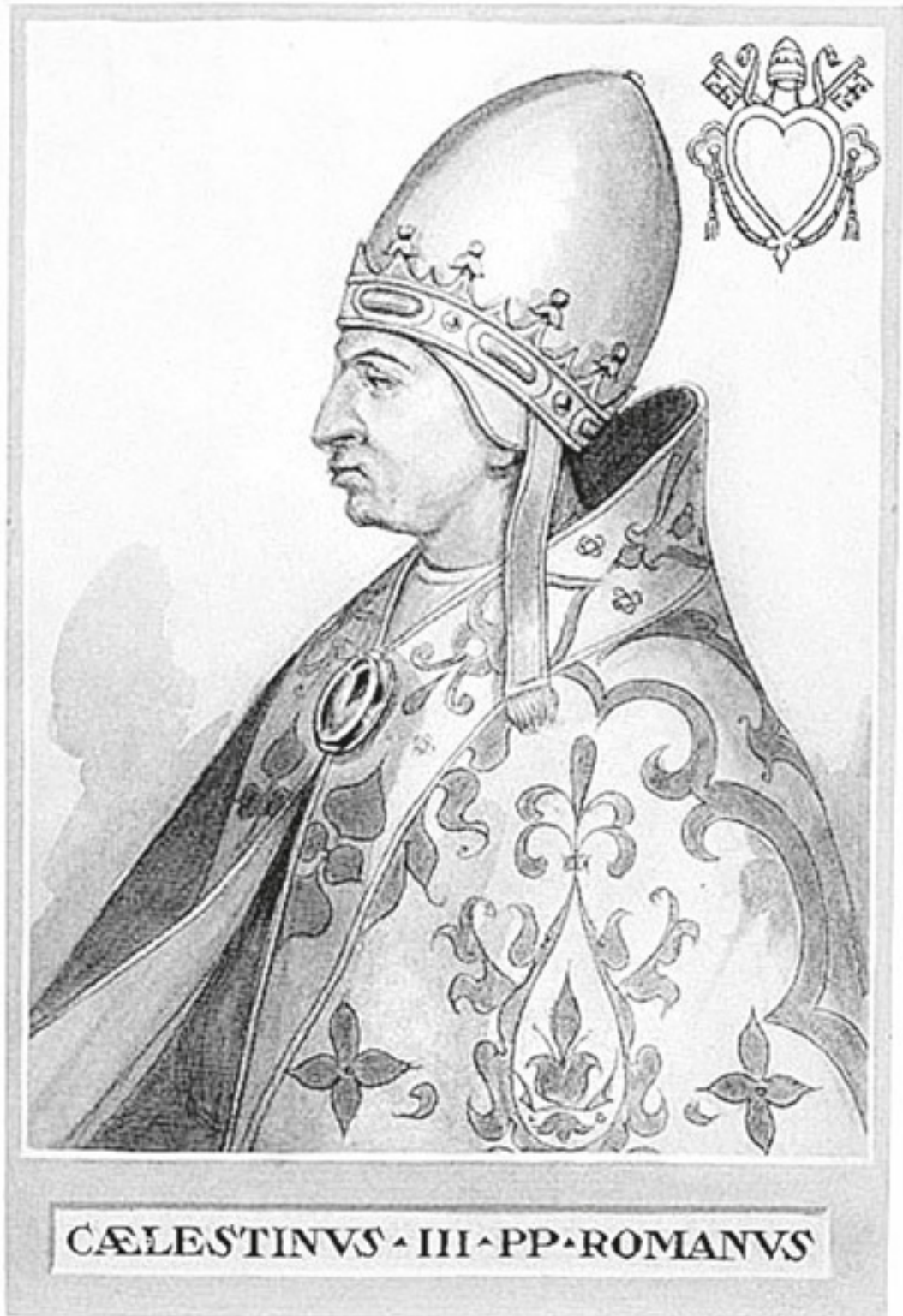
Алексис-Франсуа Арто де Монтор. Целестин III. 1842 г.

Но случилось невозможное. С точки зрения средневекового человека, это было проклятие. Сразу же после коронации в 1193 году молодой и здоровый Рожер слег с какой-то безнадежной непонятной болезнью – и через два месяца умер. В папском окружении говорили, что Бог покарал Танкреда за узурпацию власти. А может быть, проклят род Отвилей... Тема проклятия рода вообще была популярна в Средние века. Считалось, что Господь наказывает