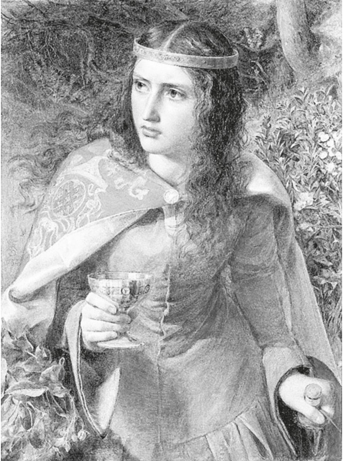
Фредерик Сэндис. Королева Алиенора. 1858 г.

Надо сказать, что в Сицилийском королевстве женщины играли более заметную роль, чем где-либо – это особенность кланового строя. Женщина у викингов – и это саги очень хорошо отражают – не отвергаема так, как это было, допустим, во Франции. Во Франции царил культ Прекрасной Дамы – теоретический, культурно-эстетический, – но в политику женщин не пускали. А Вильгельм приказал рыцарям присягнуть Констанции. Ее сразу же выдали замуж. Этот брак, который казался ему очень важным и удачным, стал трагедией для Сицилии и в конце концов ее погубил. Констанция была выдана замуж за Генриха VI, короля Германии,