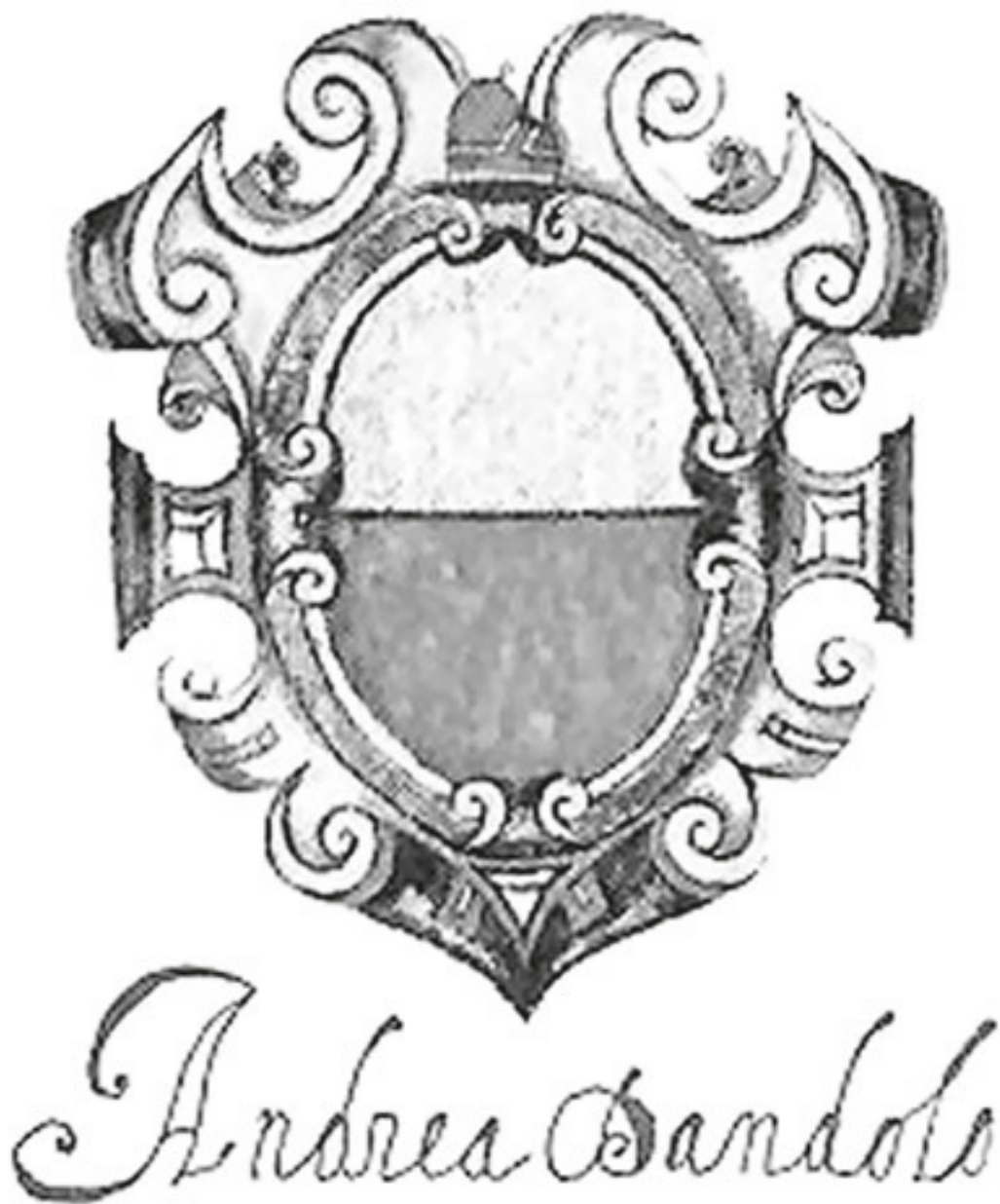
Герб Андреа Дандоло. Иллюстрация. XVII в.

До 60-летнего возраста Энрико Дандоло в политических делах не существует. В политике только его родственники. Он же был купцом, торговавшим и разбогатевшим на торговле с Востоком, и адмиралом венецианского флота.