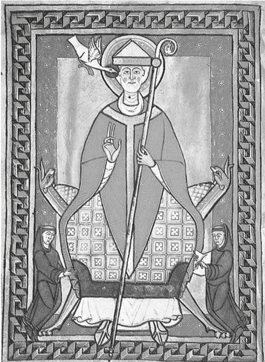
Папа Григорий VII. Миниатюра. XIV в.

Он был поглощен идеей войны с Византией. В 1081 году он был уже в ее владениях на Балканском полуострове. Сначала захватил остров Корфу – это была прекрасная военная база. Потом осадил порт Диррахий на территории нынешней Албании. Много месяцев длилась тяжелая осада. 18 октября 1081 года произошла знаменитая битва при Диррахии. Туда прибыл сам византийский император Алексей I Комнин и лично участвовал в бою. Сражались на поле боя и сам Роберт Гвискар, и его жена.