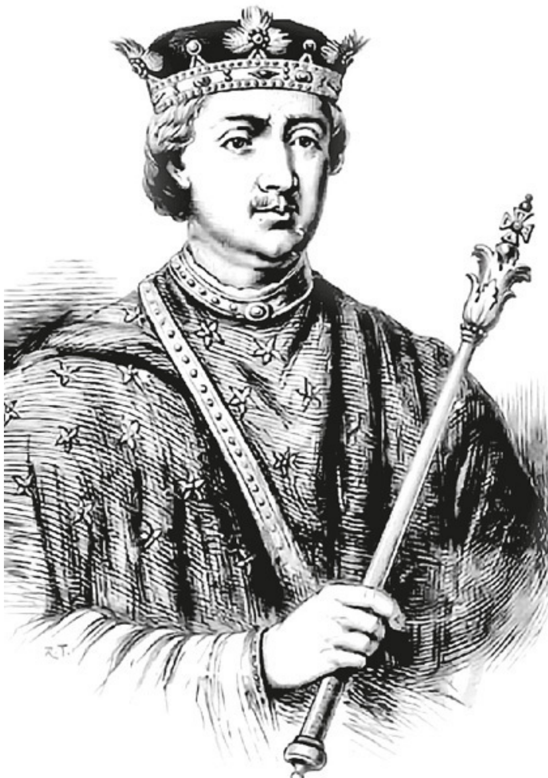
Король Генрих II