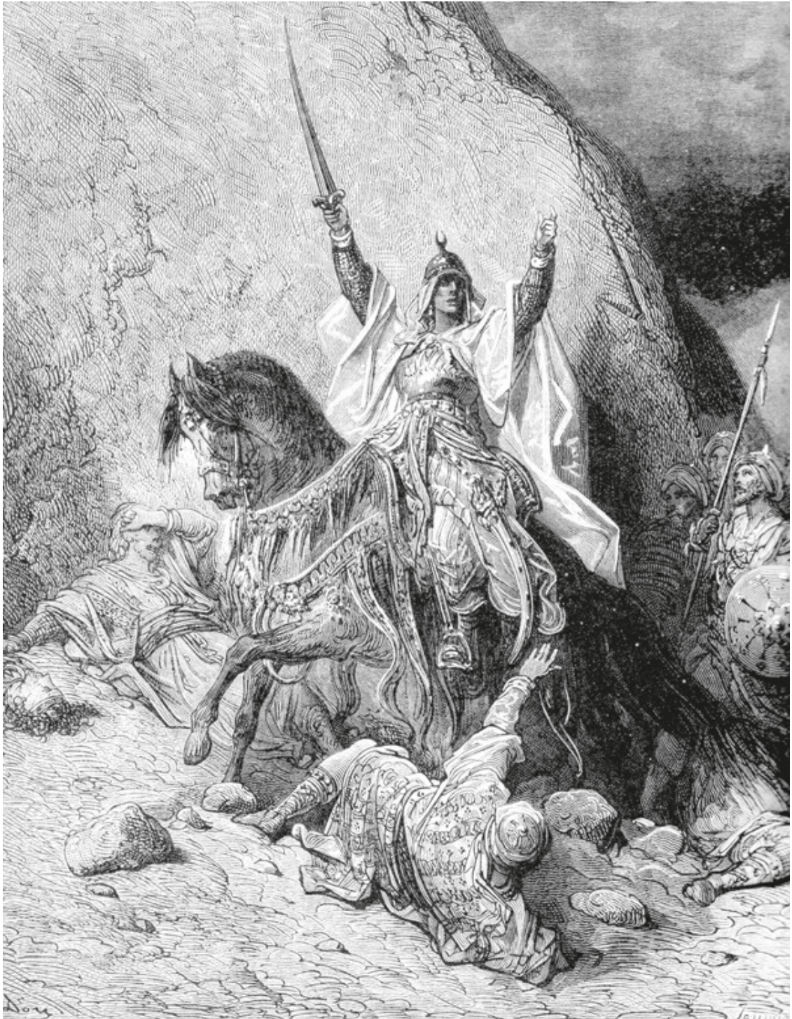
Гюстав Доре. Победоносный Саладин. Гравюра. XIX в.

Египетский правитель и военачальник Саладин начал объединять мусульманские державы против Иерусалима. Король иерусалимский Амари I обратился к христианским королям с просьбой о помощи. И только один король в Европе, Вильгельм II Сицилийский, откликнулся и послал на помощь Амари флот – 200 кораблей.