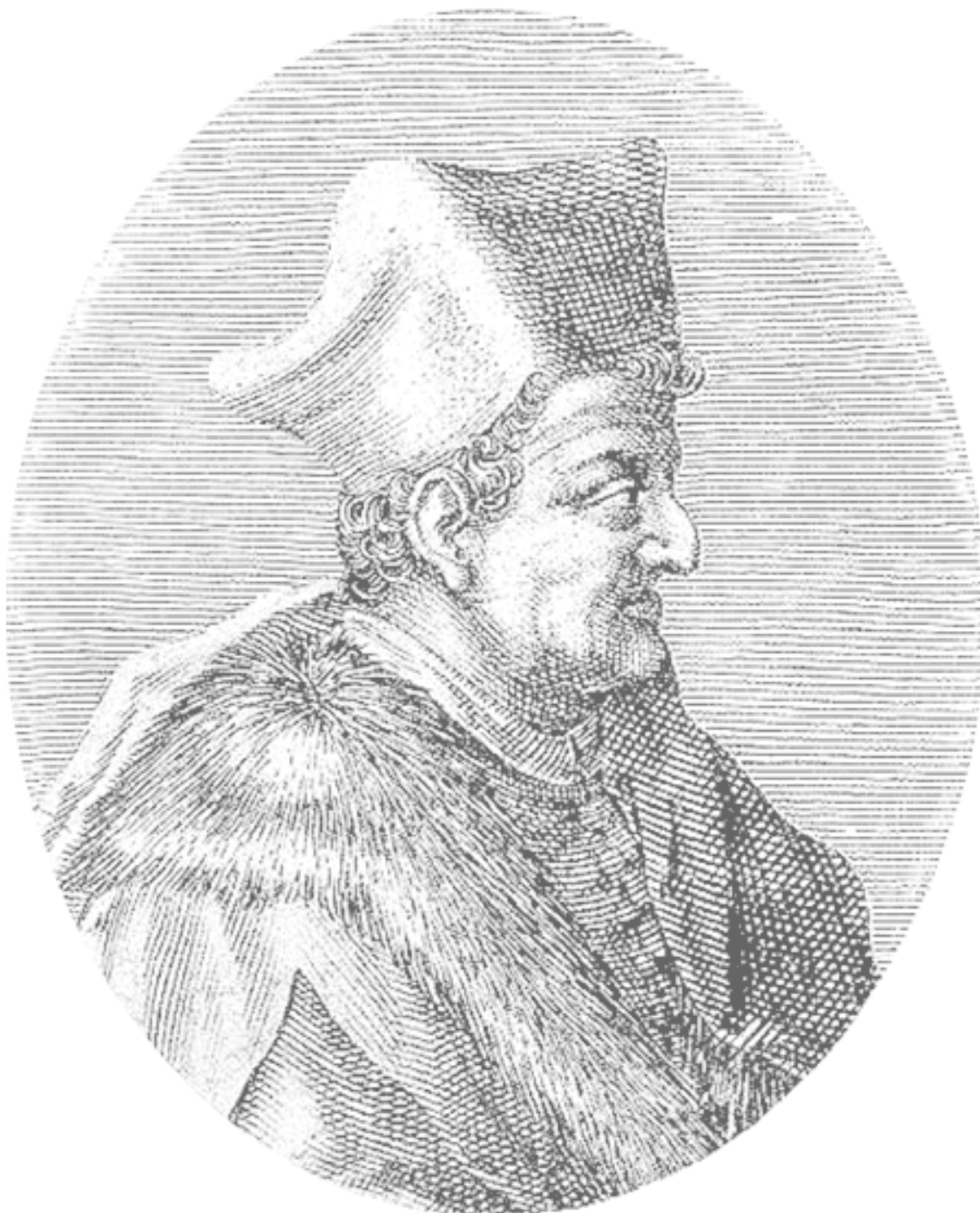
Лоренцо Валла. Гравюра. 1405–1457 гг.

Получив от папы поручение обратить арабов в истинную веру, он 10 лет, с 1061 по 1071-й, вместе с братом Рожером воевал на Сицилии и наконец захватил остров. Завоевание Сицилии имело большое стратегическое значение для мореплавания.