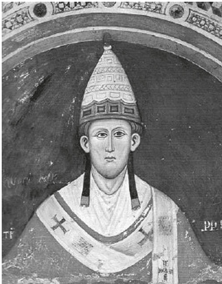
Неизвестный художник. Папа Иннокентий III. Фреска в