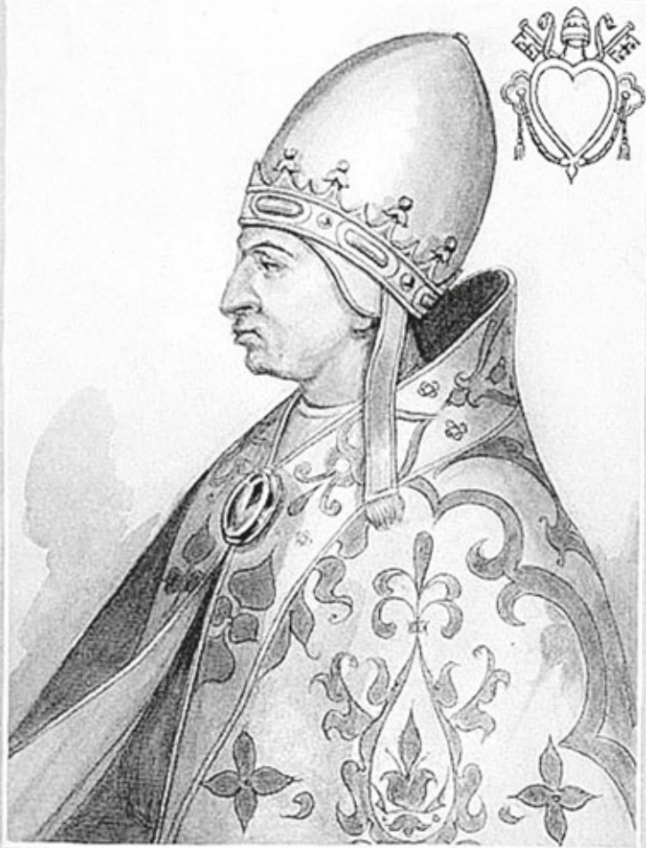
CÆLESTINVS · III · PP · ROMANVS