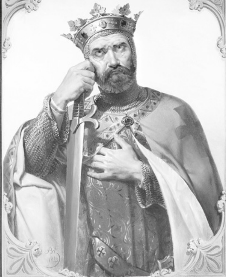
BOHÉMOND 1 er PRINCE D'ANTIOCHE — + 1108