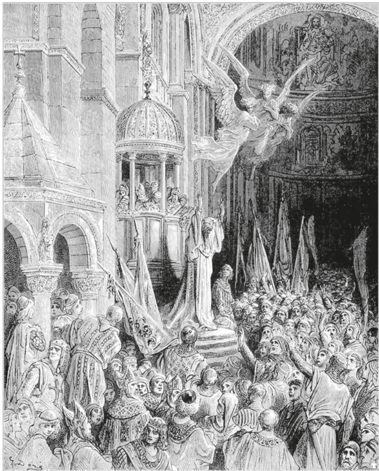
Гюстав Доре. Энрико Дандоло благословляет рыцарей. Около 1883 г.