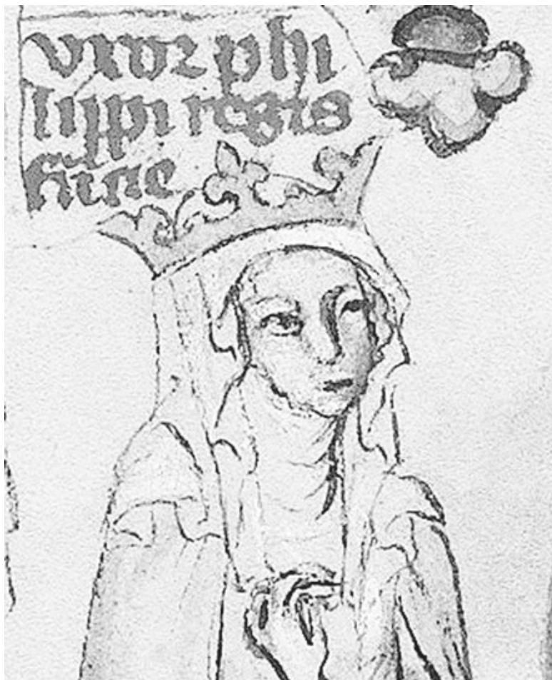
Неизвестный художник. Агнесса Меранская. XIV в.