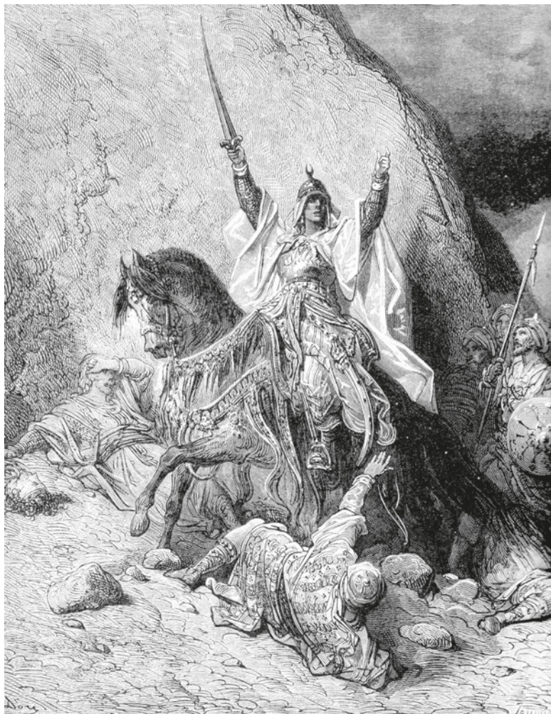
Гюстав Доре. Победоносный Саладин. Гравюра. XIX в.