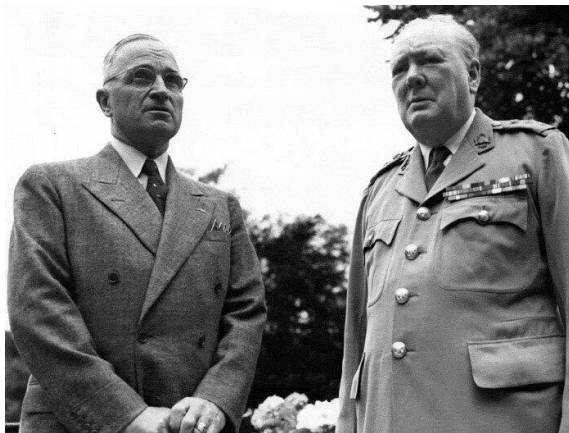
Harry S. Truman President of the United States of America inaugurated 12 April 1945

них ложную иллюзию, что можно смело идти на Сталинград за каспийской нефтью. Такое усиление Гитлера напугало американцев с англичанами. Они в страшном сне не могли представить, что объединенная Гитлером Европа способна отобрать первенство у американского финансового капитала. Эти страхи усадили за стол переговоров в Тегеране первых лиц США и Англии, которые лично гарантировали СССР начать воевать с Гитлером по-настоящему.