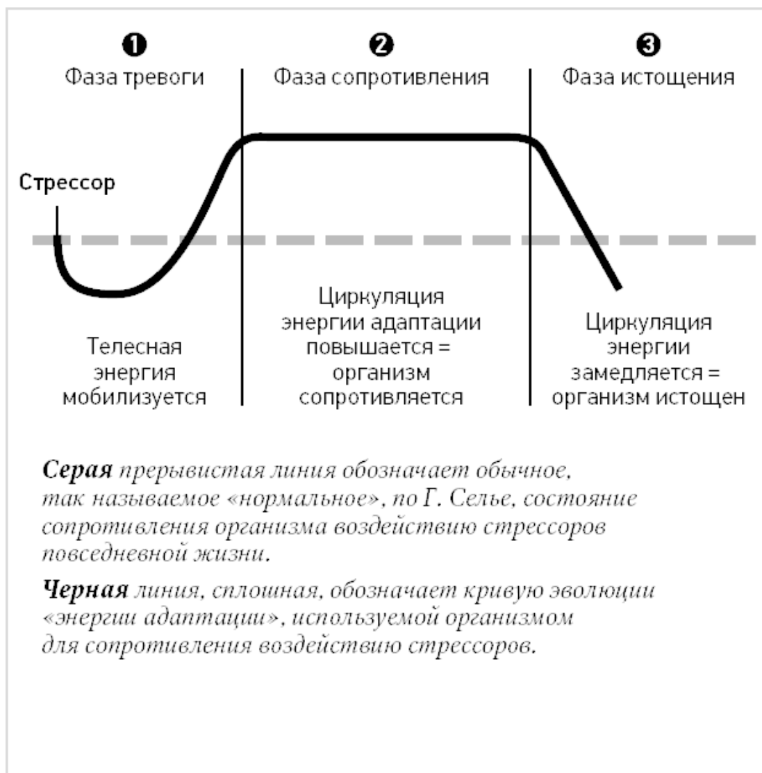
Схема 2. Развитие сопротивления стрессу в различных его фазах, согласно Хансу Селье.

Это объясняет интенсивность наших реакций, ментальную и эмоциональную окраску наших чувств. Именно в эти моменты дискомфорта, плохого самочувствия мы легче всего осознаем, как функционирует наша психосоматика. Физические сбои сопровождаются эмоциями, мыслями; мы чувствуем себя вовлеченными в процессы действия-противодействия на разных уровнях нашего организма: в теле, в голове, в сердце. Именно тогда мы ощущаем себя единым целым. Под воздействием сильного стресса большинство испытуемых чувствуют недомогание и заметное снижение умственных способностей (неприятная ситуация, хорошо известная тем, кому приходилось сдавать экзамены). Есть такие, кого возбуждает испытываемое давление: оно повышает их работоспособность, ускоряет темп мышления и повышает его продуктивность. Таким образом, деятельность многих людей становится эффективной только под воздействием чрезвычайной ситуации, что является чрезмерной «энергетической расточительностью» для организма.