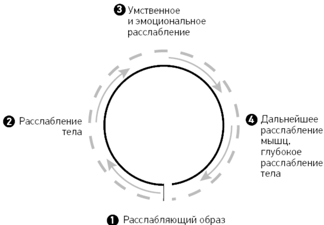
Схема 3.2. Психосоматический круг

В следующих главах мы приведем множество примеров того, как следует поступать, на основе данных современной психофизиологии и всего богатства традиционных практик, в частности даосизма. Эти методы поддержания здоровья мы испытали на себе и учили им других на протяжении долгих лет. Вы тоже можете ими воспользоваться, они благотворно влияют как на тело, так и на сознание. Выберите для повседневной практики те, которые вам больше всего нравятся, которые вы находите самыми легкими и действенными, наиболее подходящими для ваших потребностей. Они помогут вам развить «рефлекс хорошего самочувствия». Конечно, они не сотворят чудеса, но вы ощутите их действенность. Однако не заблуждайтесь: почувствовать себя лучше не обязательно означает сразу чувствовать себя хорошо. Однако если мы начинаем чувствовать себя не так уж плохо, это тоже большое достижение.