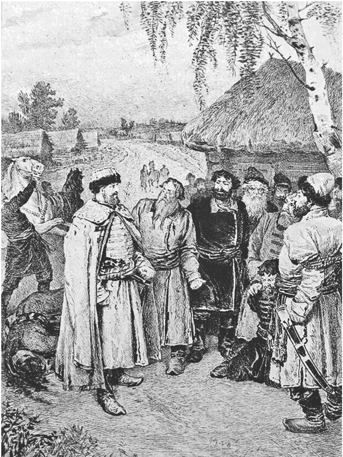
Князь Никита Романович Серебряный и связанные опричники. Рисунок К. В. Лебедева, гравюра на меди Адольфа Лалоза. Вторая половина XIX в.