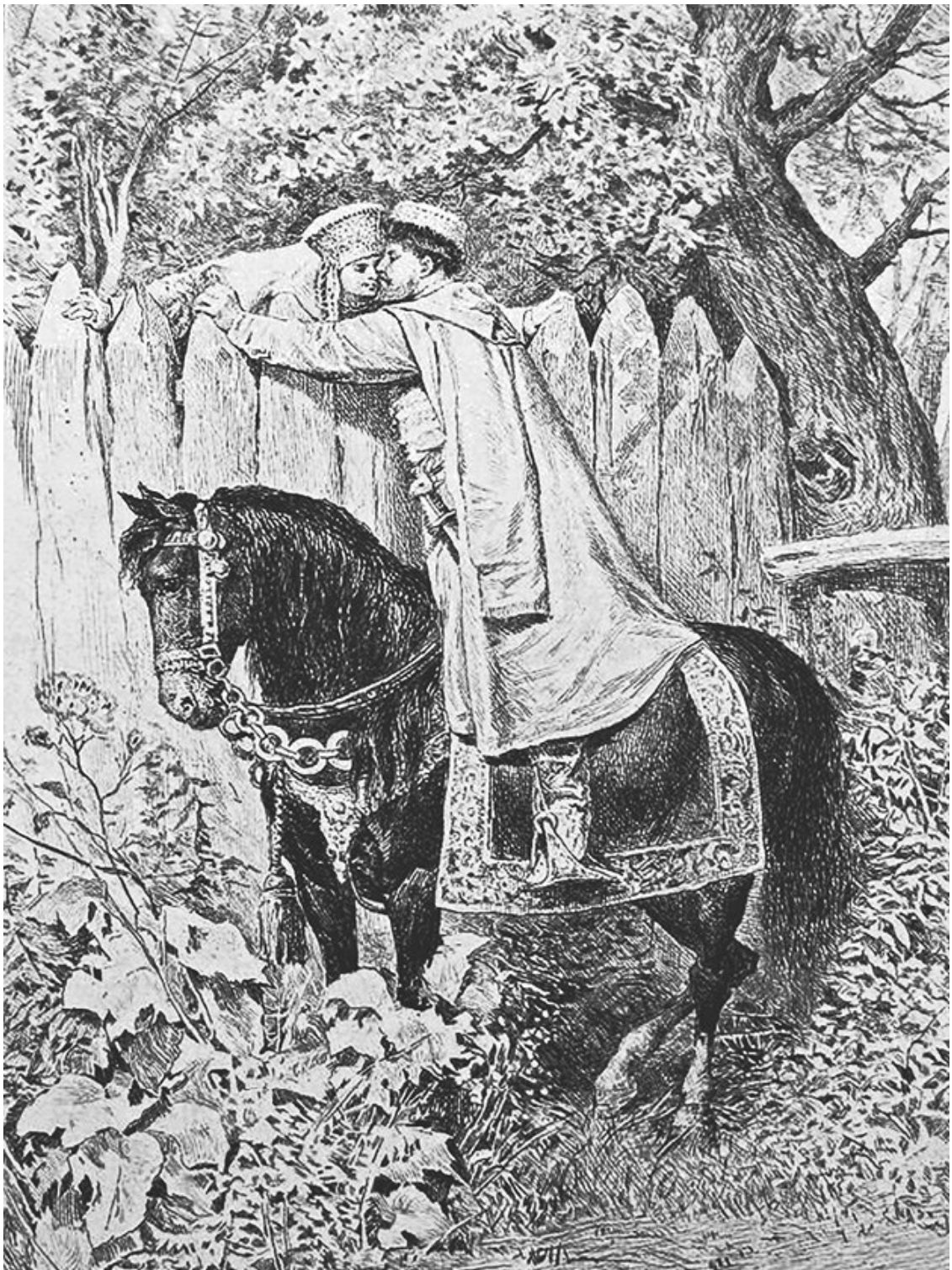
Встреча князя Серебряного с боярыней Морозовой. Рисунок К. В. Лебедева, гравюра на меди Адольфа Лалоза. Вторая половина XIX в.

– Ах я глупенькая! – сказала Пашенька, – чего я наделала. Вот на свою голову послушалась боярыни! Да и можно ли, боярыня, на такие песни набиваться!