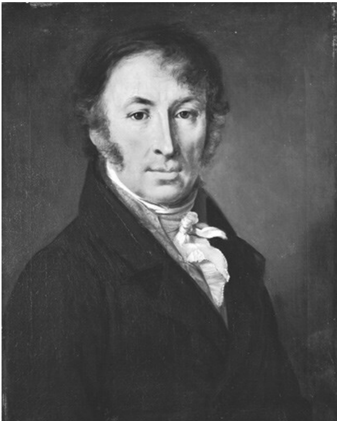
В. А. Тропинин.