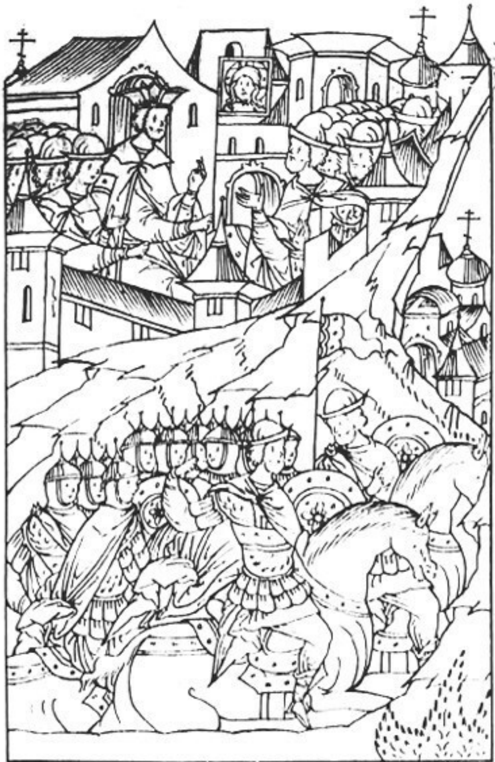
Иван IV Грозный посылает Василия Семеновича Серебряного и Семёна Васильевича Шереметьева в Муром. Миниатюра из Лицевого летописного свода. 1568