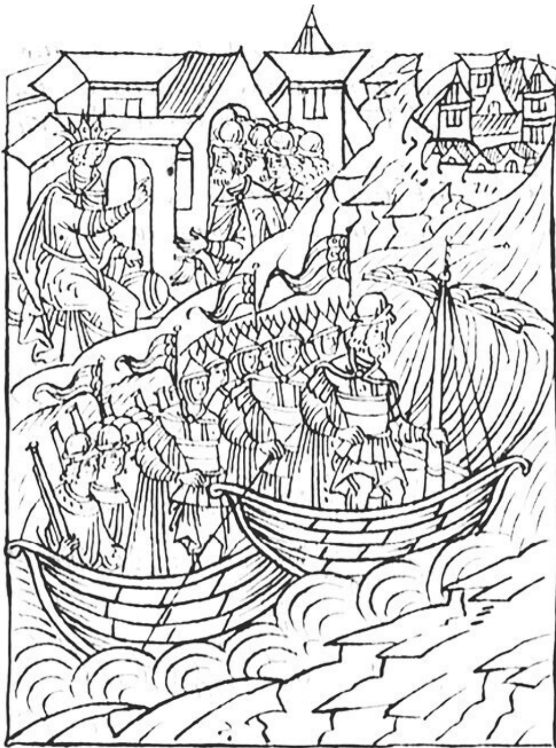
Петр Семенович Серебряный-Оболенский в Казанском походе. Миниатюра из Лицевого летописного свода. 1568

Более того, братья в какой-то мере сумели расквитаться с противником за поражение Шуйского: они взяли сильную литовскую крепость Озерище. Василий Семенович возглавлял тогда войска осаждающих, и это именно его тактическому таланту Россия обязана успехом.