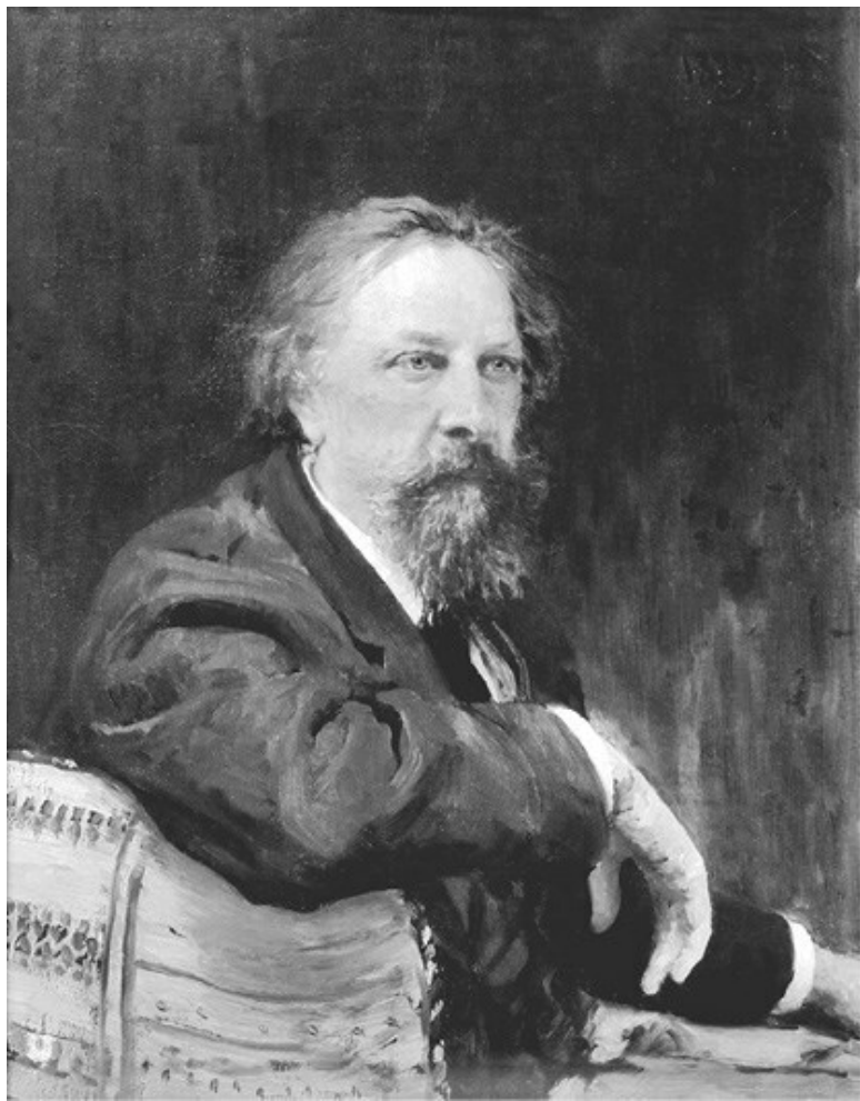
И. Е. Репин.