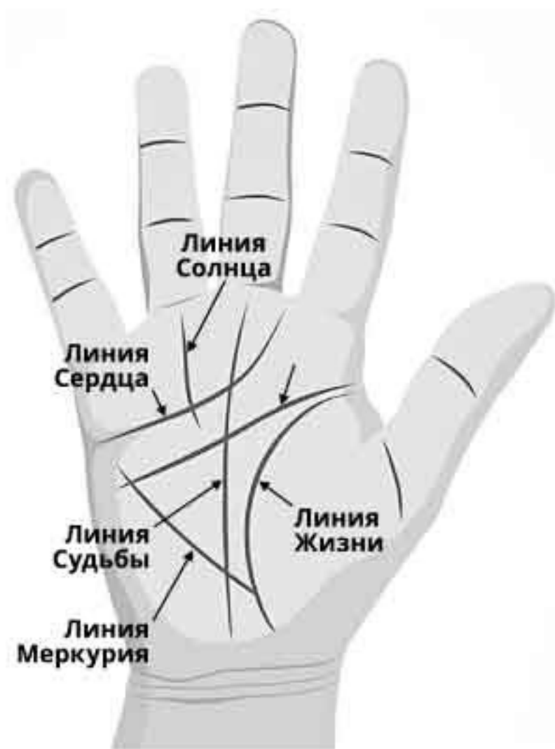
Рис. 1. Схема расположения основных линий на ладони

Взгляните на свои ладони и попробуйте найти основные линии. В этом поможет приведенная слева схема.