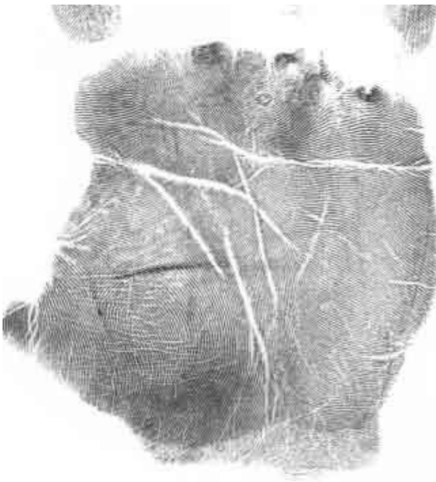
Рис. 4. Пример пустой ладони, которая характеризуется минимумом линий

С точки зрения астрологии мужской образ идеальной женщины, его анимы, описывается позициями Венеры и Луны в карте, а анимус в женской карте характеризуется Марсом и Солнцем. Хиромантия очень наглядно помогает оценить силу мужского и женского в каждом из нас: выводы об этом можно сделать по количеству линий на ладони и грубости кожи. В среднем большинство мужчин обладает ладонями с более грубой кожей и малым числом линий, нежели у женщин. В хиромантии ладони с малым числом линий принято называть пустыми, а с большим их количеством – полными.