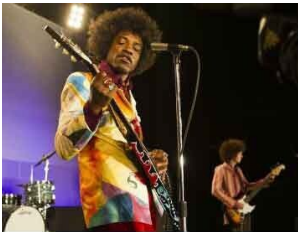
Рис. 3. Джими Хендрикс — пример знаменитого левши из мира рок-музыки

Имеет смысл также вспомнить о том, что ведущая (для правши это правая) рука связана с активной социальной реализацией, а пассивная может быть связана с поведением в близком кругу, в семье. Например, если у правши на левой искривлен указательный палец, вполне вероятно, что в семье он проявляет излишне много командирских замашек характера.