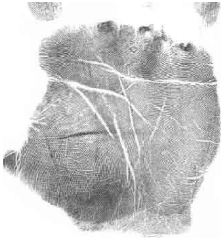
Рис. 4. Пример пустой ладони, которая характеризуется минимумом линий