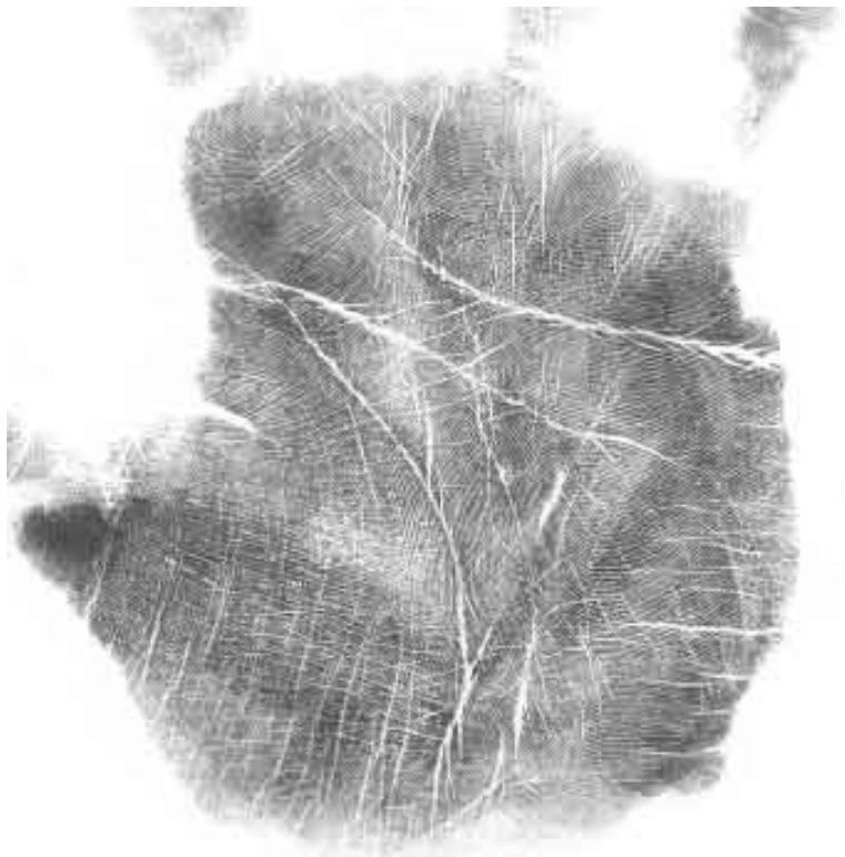
Рис. 5. Пример полной ладони, отличающейся обилием линий

Поскольку линии руки связаны с реакциями нервной системы на события жизни, то малое их число указывает на