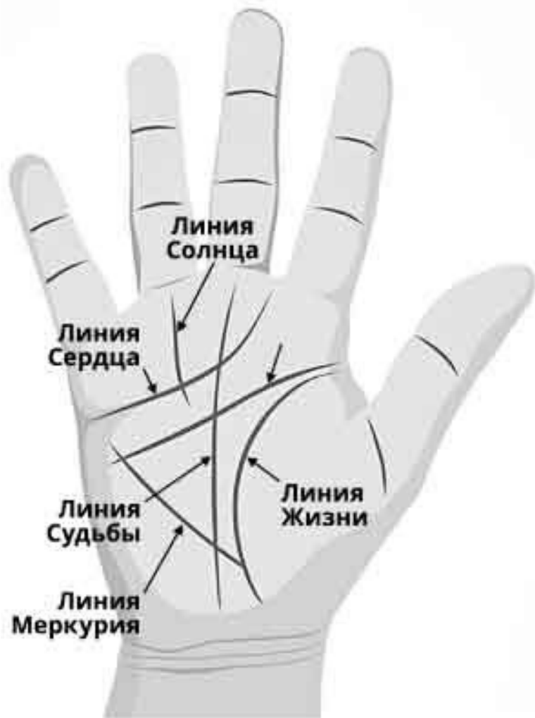
Рис. 1. Схема расположения