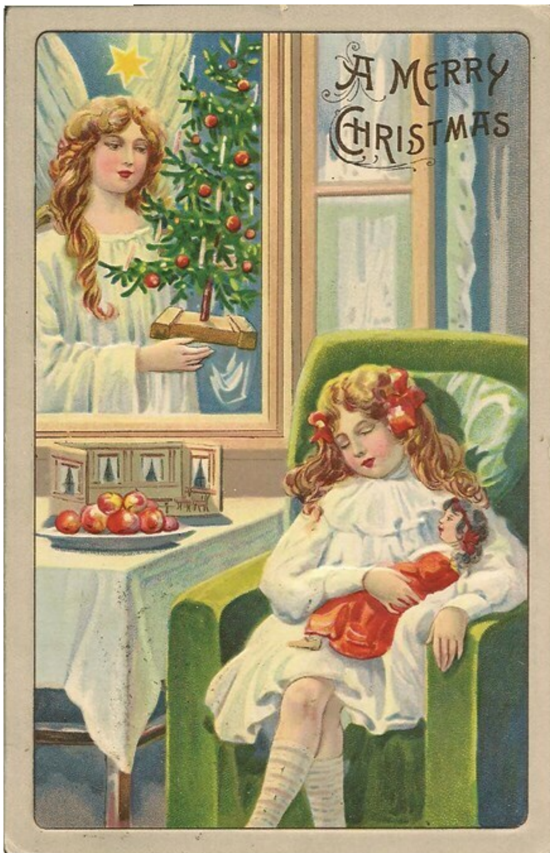
Рождественская открытка. 1900-е гг.