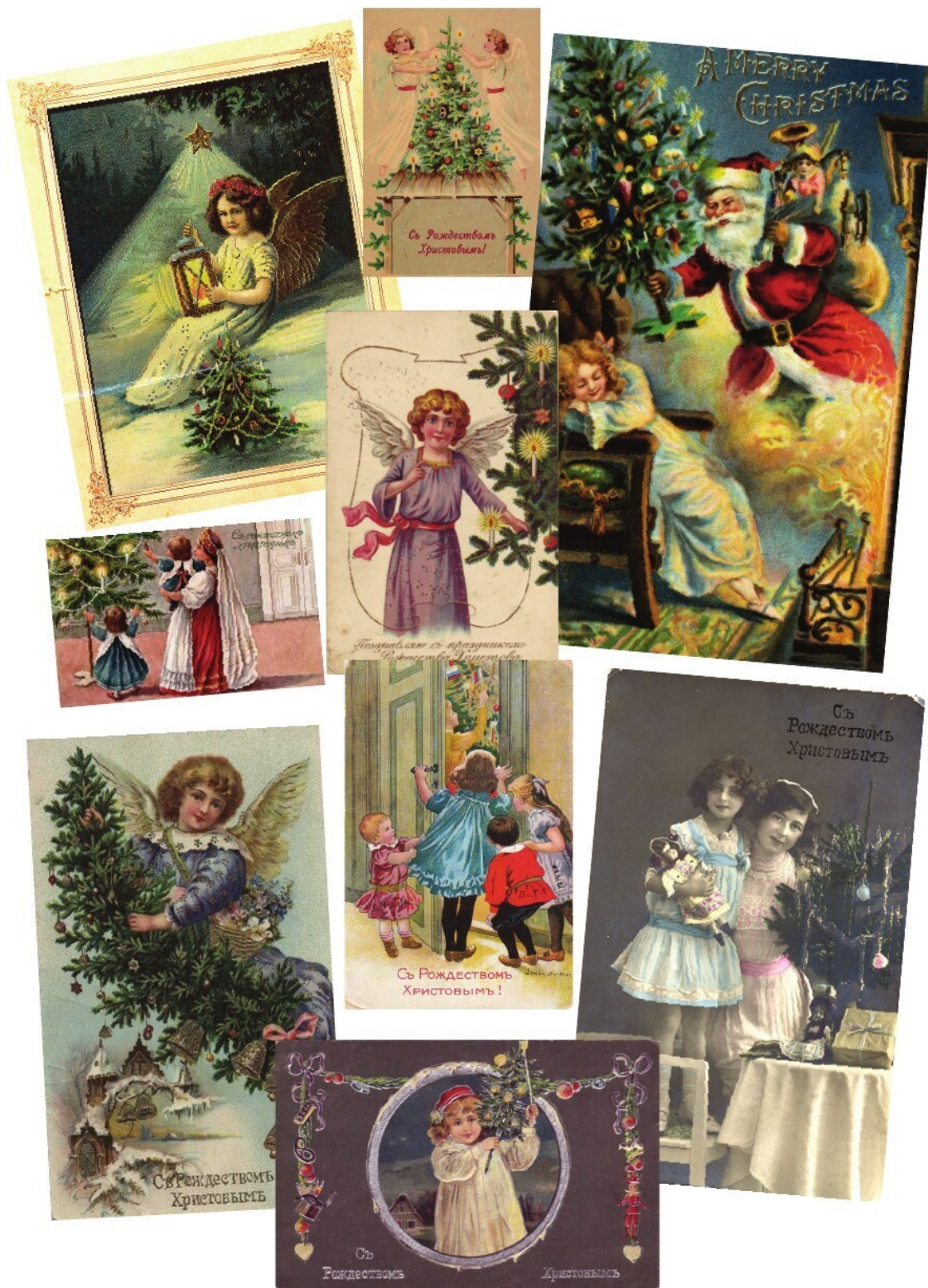
Старые рождественские открытки

Между тем профессионально изготовленных елочных украшений на русских елках становилось все больше и больше. Авторы мемуаров сообщали, что на елках наряду с самодельными украшениями обычно висело и много других вещей: «Вот пряники в виде львов, рыб, кошек... Вот огромные конфеты в блестящих бумажках, с приклеенными к ним фигурами лебедей, бабочек и других животных, сидящих в гнезде пышной кисеи... Вот очень забавные