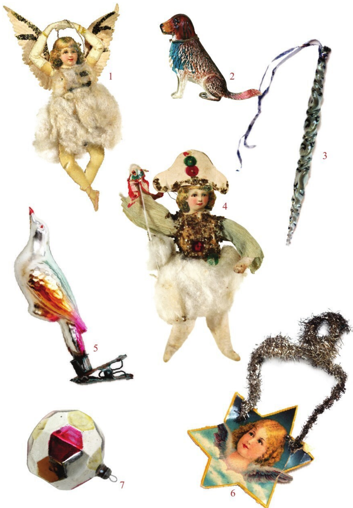
Из коллекции Л. Блатт. 1, 4, 6. Игрушки с хромолитографией с использованием ваты и мишуры, 1890–1920-е гг. 2. Собака; дрезденская картонажная, ручная роспись; 1890–1920-е гг. 3. «Викторианская» подвеска; богемское стекло; 1890–1910-е гг. 5. Птица; цветной лак, перламутр; 1900–1910-е гг. 7. «Китайский бумажный фонарик»; стекло, цветной лак; 1920-е гг.