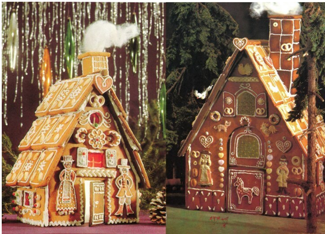
Пряничные рождественские домики. Из книги: Brüder Grimm. Hänsel und Gretel. Verlag Karl Nitzsche, Niederwiesa, 1987.

Среди елочных украшений немало было и сахарно-пряничных изделий, конфет и фруктов. Популярны были пряничные домики и украшения из соленого теста – ангелочки, гномики, девочки, мальчики. «Сладкие» украшения делались из сахара и леденцов, из карамели и шоколада. Часто им придавалась форма игрушек 140 . В связи с тем, что произведения «кондитерской архитектуры» (Е.В. Душечкина) так долго преобладали среди украшений рождественского дерева, сами елки в России в конце 1830-х – 1840-е годы обычно продавались в кондитерских Москвы и Петербурга, принадлежавших иностранцам, в первую очередь швейцарцам. Причем это были елки, если можно так выразиться, готовые к употреблению, елки уже украшенные – картонажами, китайскими фонариками, свечами, «моделями вещей, уменьшенными по масштабу» и, конечно же, разнообразными сладостями 141 .