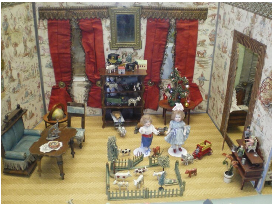
К концу XIX в. украшенная рождественская елка стала неперенным атрибутом даже кукольных домов. Музей игрушки, Прага. 2010.