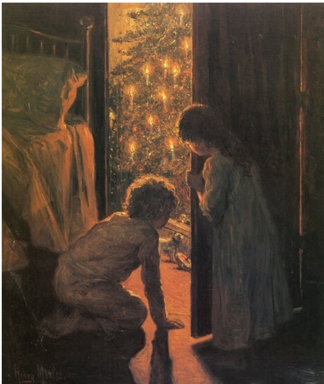
Генри Мослер. Рождественское утро. Ок. 1916

Не нравятся мне и те игрушки, которые я позднее собственноручно произвожу из цветной бумаги на уроках труда в начальной школе – аляповатые разноцветные цепи, неуклюжие снежинки, кривые корзиночки, слегка кособокие фонарики. Дома я никогда бы не повесила их на елку – увы, рукодельница из меня никакая, и выставлять результаты моих трудов напоказ – это уж слишком, но учительница с маниакальной настойчивостью из года в год украшает нашими самоделками новогоднее дерево, стоящее в классе. Трудовое воспитание есть трудовое воспитание. Впрочем, сам процесс изготовления игрушек приятен – он символизирует приближение Нового года.