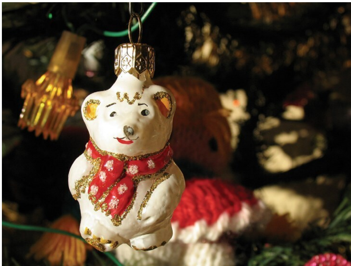
Фото Е. Сярой. 2009

Бережно сохранялись старые елочные игрушки в семейных дворянских коллекциях, включавших, как известно, произведения разного художественного достоинства, с которыми обычно были связаны различные «семейные истории или память о предках» 40 . Особенно отчетливо эта тенденция проявлялась в провинции, где существовала особая «традиция привязанности» к старым вещам 41 . И в советское время, несмотря на уплотнения, тесноту, частые переезды и подчас откровенную нищету, с елочными игрушками не спешили расставаться. Кроме того, в отдельные периоды советской истории купить их было практически невозможно, и приходилось довольствоваться тем, что есть.