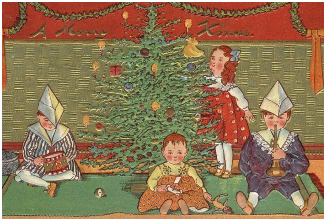
Американская рождественская открытка. 1900-е гг.

елках. Поэтому и накануне, и во время праздника дети не имели возможности делать с елочными игрушками то, чего им, вероятно, больше всего хотелось, а именно играть с ними, как с игрушками обыкновенными 28 . Им настойчиво внушали, что эти игрушки существуют прежде всего для того, чтобы украшать елку, а не для игры, и такая «отстраненность» делала их еще более привлекательными.