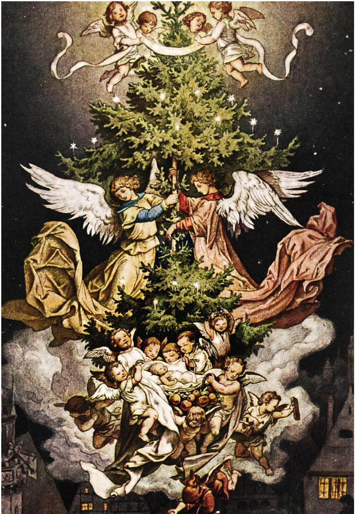
Людвиг Рихтер. Рождественская ночь. Немецкая рождественская открытка. 1900-е гг.