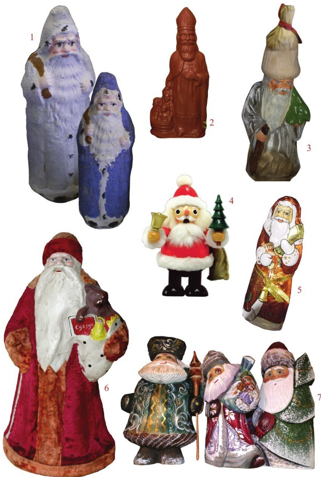
1, 3. Рождественские Деда. Музей игрушки, Прага. 2010. Фото автора. 2. Шоколадная фигурка Св. Николая. 4. Дед Мороз. Деревянные рождественские украшения из Эрцгебирге. Специализированный магазин елочных украшений, Берлин, Германия. Февраль 2010. Фото автора. 5. Шоколадная фигурка Санта-Клауса. 6. Дед Мороз; прессованный картон, аппликация, бархат, ручная роспись; 1950-е гг., производство УССР. Из коллекции Л. Блатт. 7. Деда