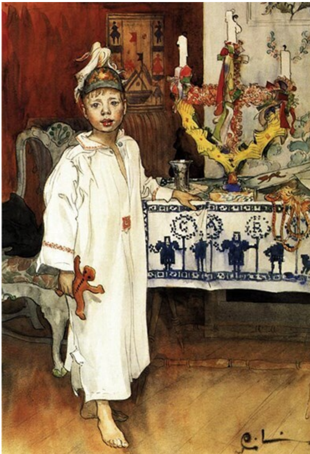
Карл Ларссон. Рождественское утро. 1890-е гг.

Из Германии же ввозились в Россию и игрушечные заготовки – цветные и фольгированные картонажные фигурки, фарфоровые головки, заготовки из стекла, которые уже здесь превращались в готовую игрушку.