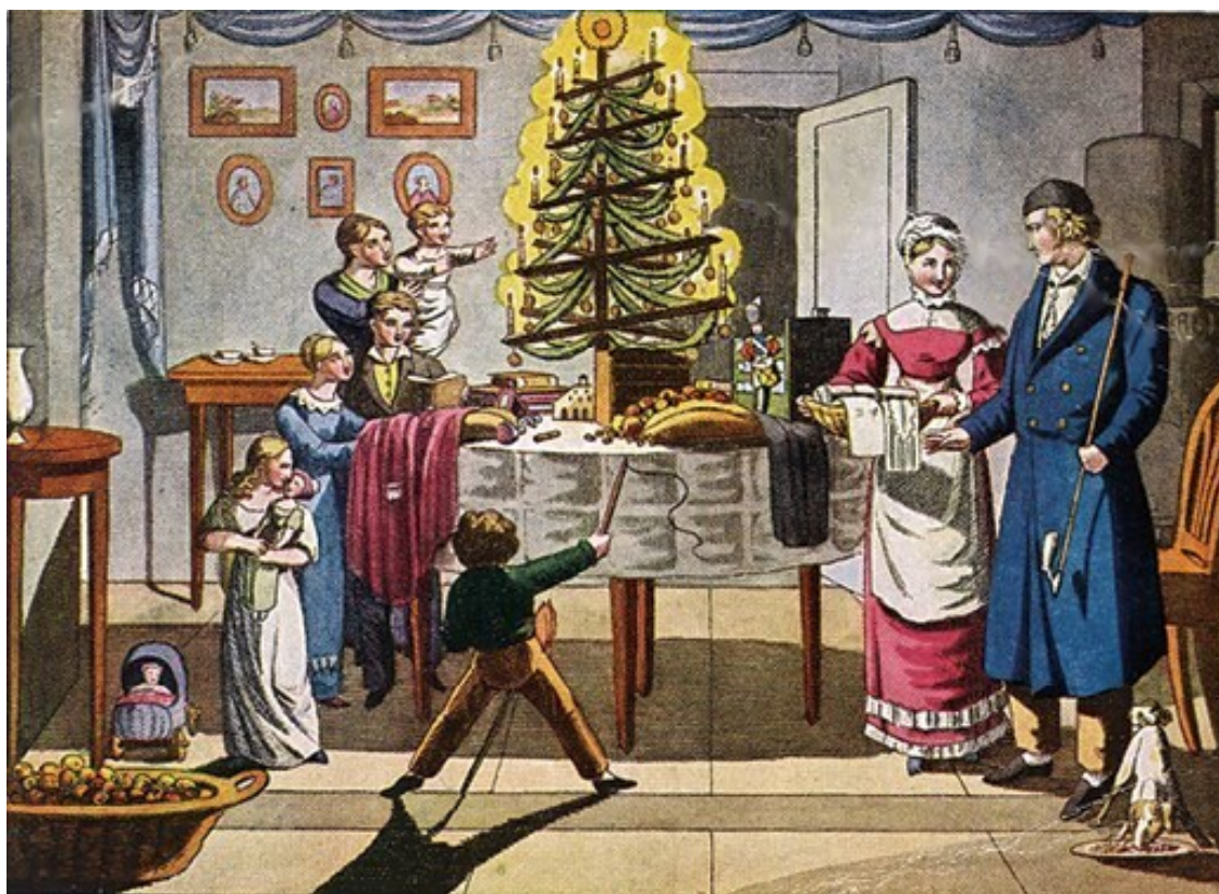
Рождество XIX – начала XX в. Немецкая открытка