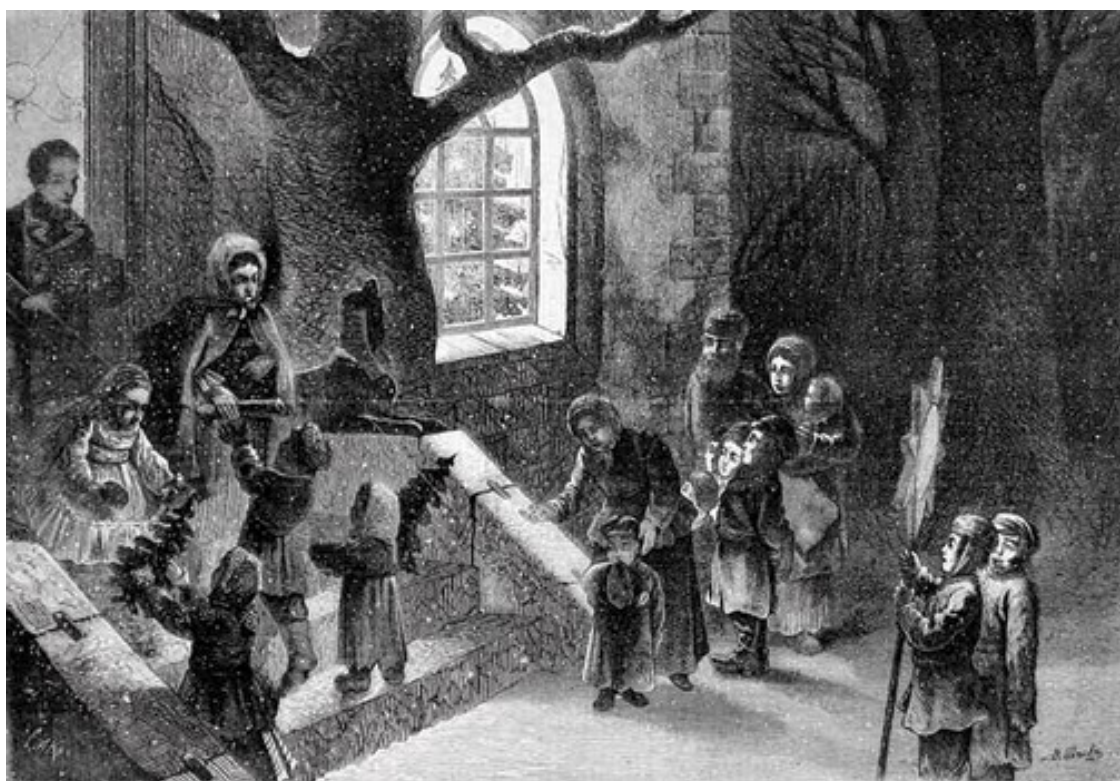
Рождественский сочельник в России. Эстамп. 1876

На Рождество елки традиционно и повсеместно устанавливались как в сельских, так и в городских церковно-приходских школах 104 . В XX веке сельская елка вышла за пределы школы. В рассказе М. Круковского, опубликованном в рождественском номере журнала «Мирок» за 1914 год, упоминается случай, когда в одной из сельских школ Олонецкой губернии детям отказались устраивать елку. Тогда они сами срубили и установили рождественское дерево, а затем нарядили его так, как смогли, – в тряпочки и конфетные обертки – и зажгли на нем свечи. Анализируя этот случай, О.П. Илюха усматривает причину столь быстрого и стойкого приобщения детей к «елочной» традиции в созвучии ее карельским языческим ритуалам 105 .