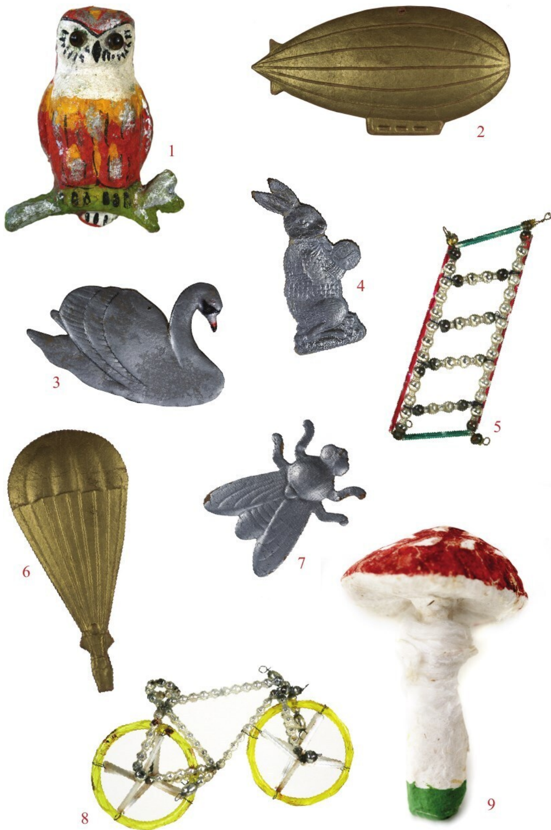
Из коллекции Л. Блатт. 1. Сова; папье-маше, стеклянные глаза, ручная роспись; 1910–1920-е гг. 2–4, 6, 7. Картонажные дрезденские игрушки: лебедь (ручная роспись, 7 см), заяц с мячиком (фольгированная, 11 см), «викторианская» пчела (фольгированная, разносторонняя,