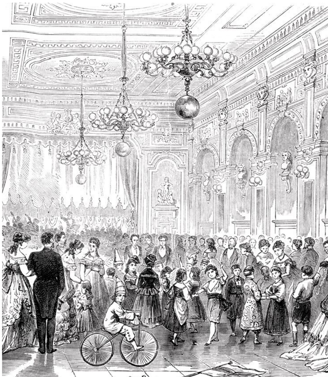
Празднование Рождества в России XIX века. Публичная елка. Из книги: Е.А. Вишленкова, С.Ю. Малышева, А.А. Сальникова. Terra Universitatis: Два века университетской культуры в Казани. Казань, 2005

Обывателю же и даже городскому интеллигенту нарядить елку было непросто. Привозные елочные игрушки стоили дорого (например, цена выставленной на продажу полностью украшенной елки колебалась в 1840-е годы от 20 до 200 рублей ассигнациями) 86 , а доходы населения были низкими. В середине XIX века провинциальные приказчики получали 50–100 рублей в год, работники при домах – 15–40 рублей, мелкие канцелярские служащие – 36–72 рубля, уездные и городские врачи – 180–224 рубля, библиотекари и их помощники – 108–168 рублей 87 . Значительная часть горожан жила ниже черты бедности. Недешево обходились и