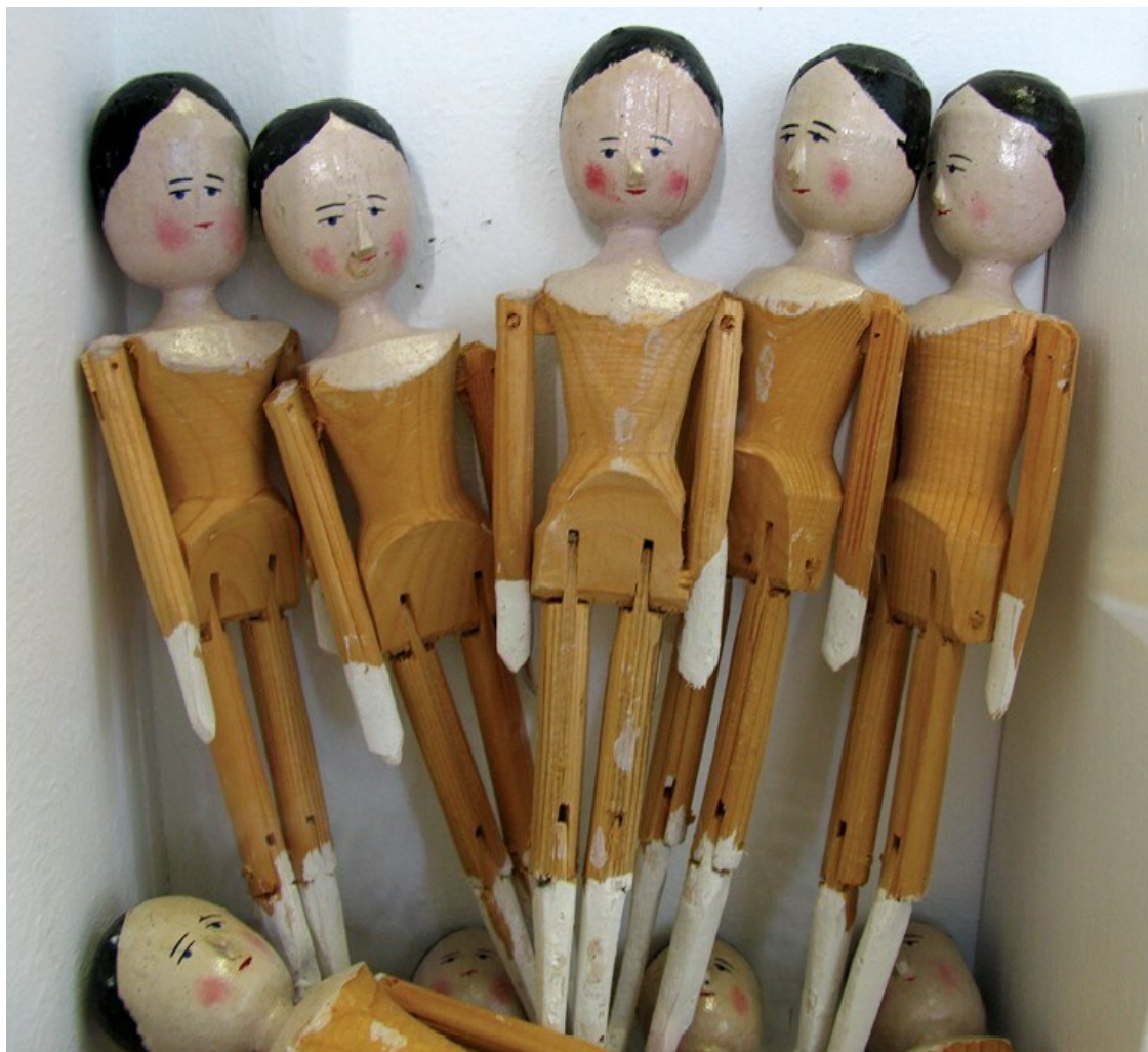
Куклы-«скелетки». Музей игрушки, Мюнхен. 2009.

Впрочем, куколки-«скелетки» (а точнее говоря, «скелетки») – самый дешевый сорт кукол, идущий по три копейки за штуку, – продавались и одетыми и могли попасть на елку уже в таком виде 126 .