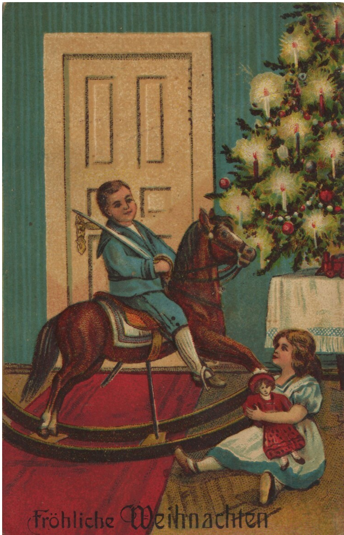
Немецкая рождественская открытка. 1990-е гг.