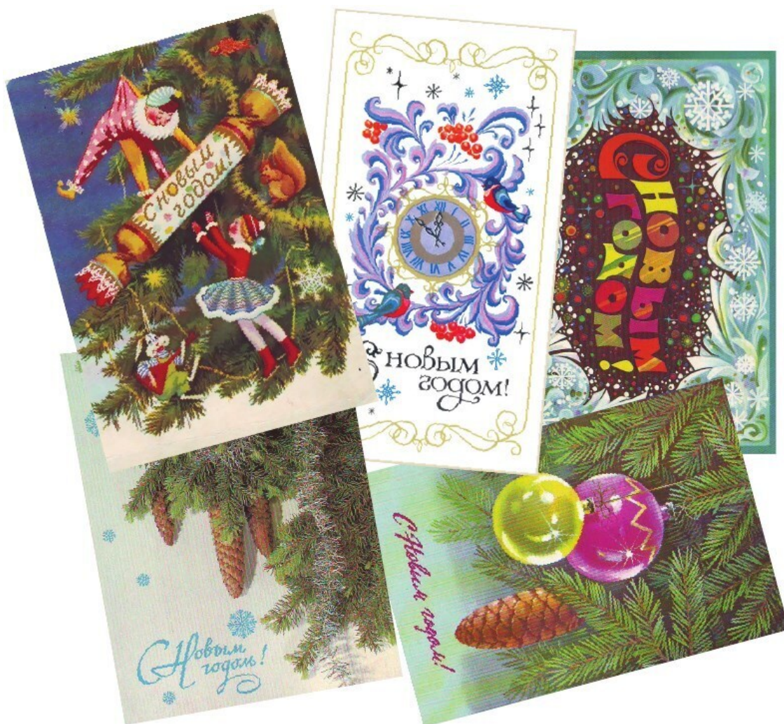
Советские новогодние открытки разных лет