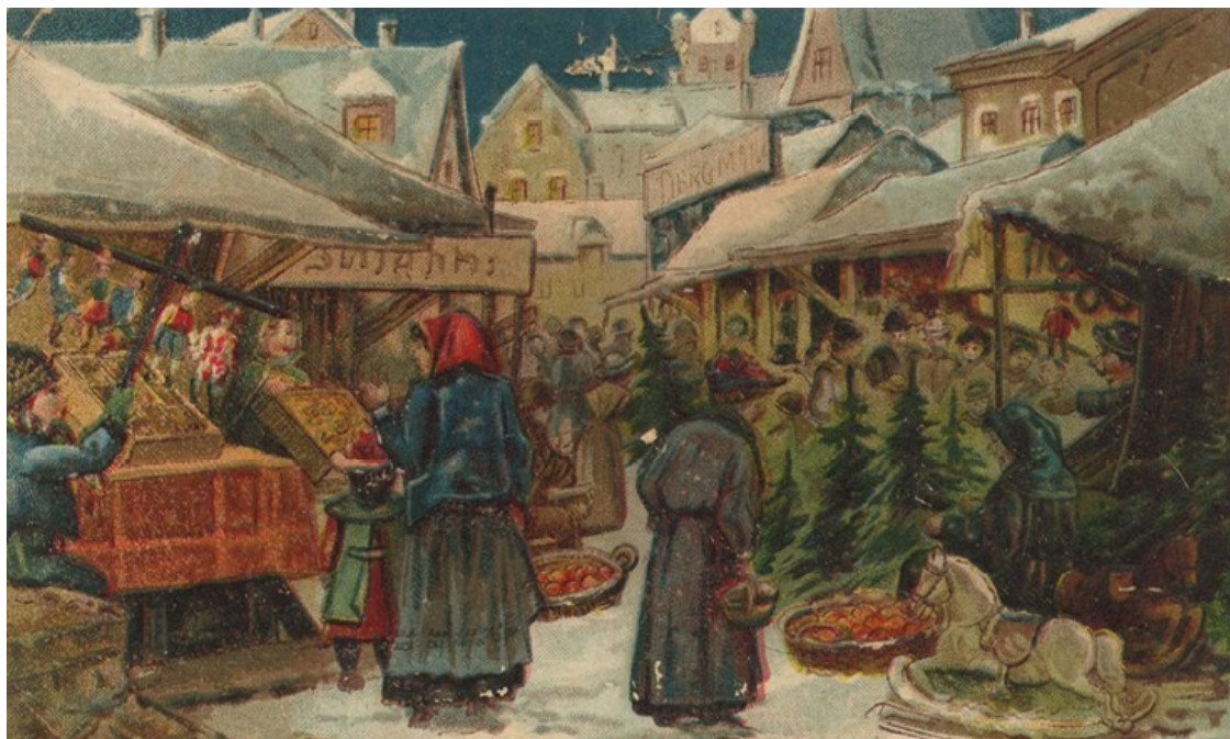
Рождественский базар. Открытка. Германия. 1900 (?)