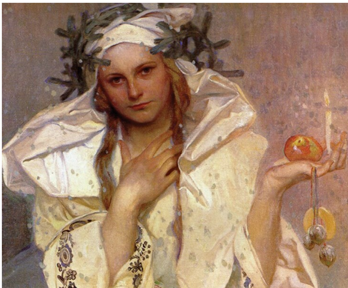
Альфонс Мария Муха. Рождество в Америке (фрагмент). 1919

Первоначально рождественская елка в России рассматривалась как атрибут привилегированной дворянской праздничной культуры (да и реально была им), что вполне соответствовало одной из приоритетных задач социальной политики Николая I, направленной на укрепление и «очищение» дворянства. Позднее, по мере демократизации праздника и расширения его сословных границ, нарядная елка все чаще украшала собой буржуазное жилище. Все большее количество удачливых предпринимателей (купцов, торговцев, банкиров) и лиц доходных профессий (врачей, адвокатов, государственных служащих) пытались воспроизвести в своем повседневном быту дворянский образ жизни, а по роскоши и красоте елочного убранства – даже перешеголять своих более родовитых и сановных современников. Богато украшенная елка олицетворяла собой буржуазное стремление к индивидуальному и семейному материальному благополучию и подтверждала его наличие. Она была тем символом, который, с одной стороны, объединял семью и отделял, отграничивал ее от «чужих», а с другой – свидетельствовал о ее общественном престиже и мощи, значимости и богатстве, вне зависимости от знатности происхождения.