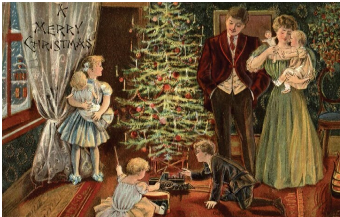
Американская рождественская открытка. 1900-е гг.

В советское время – время торжества «префигуративной» культуры 19 – дети как носители и трансляторы нового советского опыта также оказались весьма кстати. Накануне нового, 1936 года, возвращая рождественскую, а теперь уже новогоднюю елку после ее запрета, «лучший друг всех советских детей», большевик и партийный функционер Павел Постышев (благодаря возвращению елки ему даже удалось ненадолго разделить это почетное звание с самим Сталиным), призвал в «Правде» организовать «веселую встречу Нового года для детей (курсив мой. – А. С.)», устроить «хорошую советскую елку во всех городах и колхозах!» 20