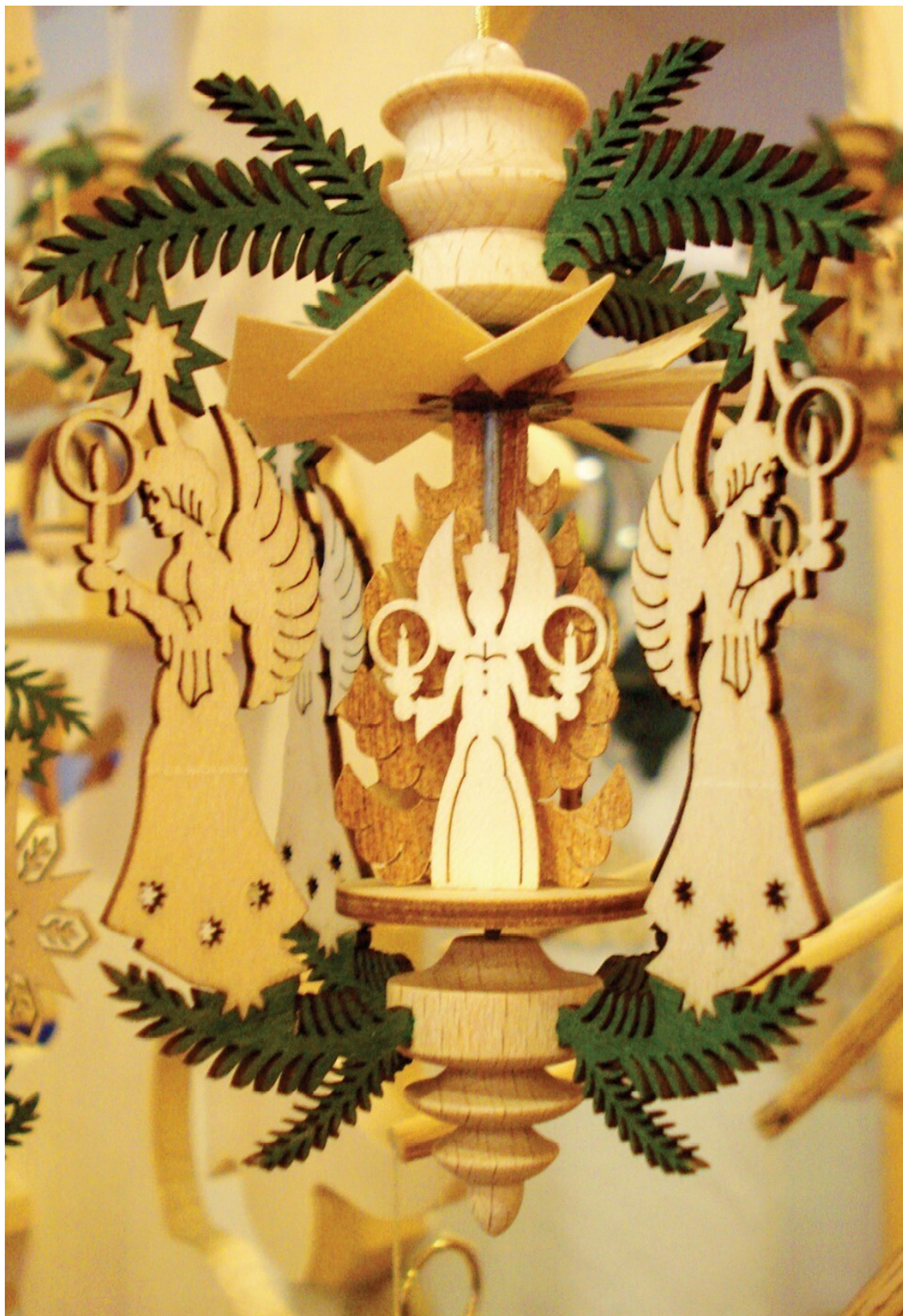
Фрагмент рождественского украшения из дерева, Эрцгебирге. Специализированный магазин елочных украшений, Берлин, Германия. Февраль 2010.