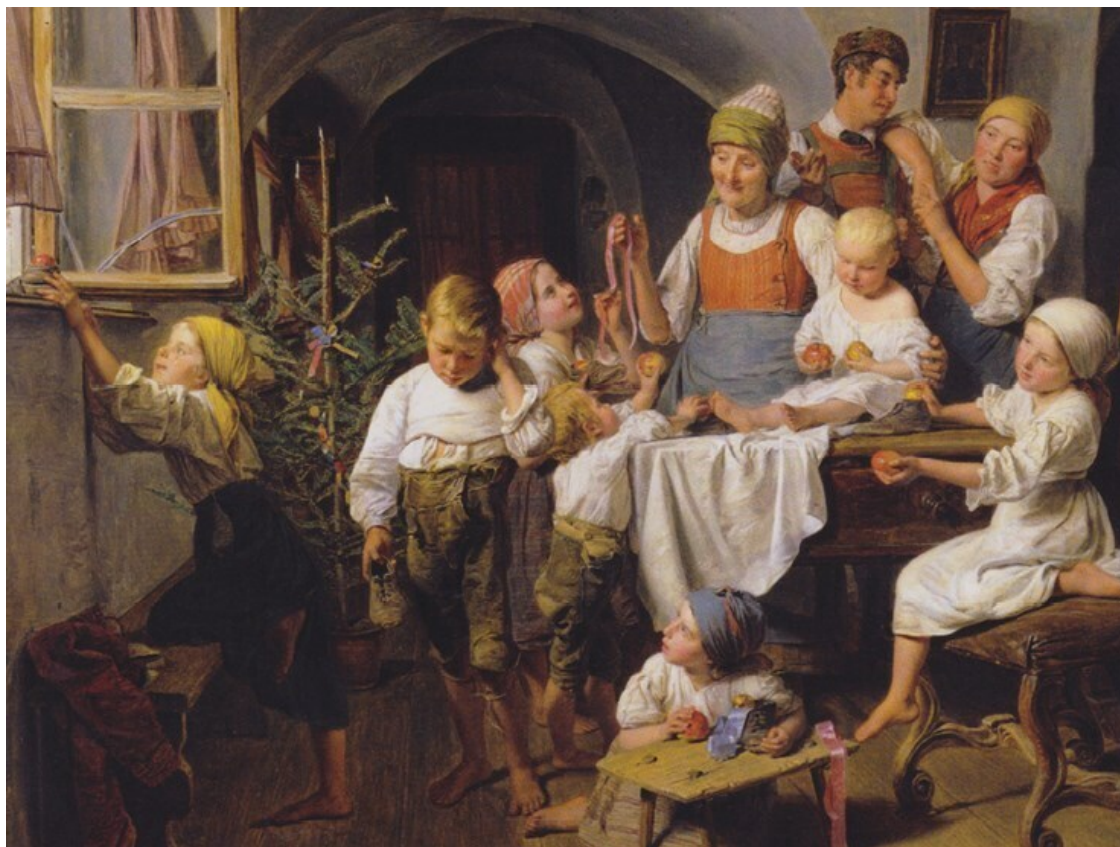
Фердинанд Георг Вальдмюллер. Рождественское утро (фрагмент). 1844

Вместе с тем домашняя елка стала знаком принадлежности к когорте «новой», интеллектуальной элиты. Не случайно этот праздник занял особое, «культовое» положение в среде выдающихся деятелей культуры Серебряного века, а его явные и неявные отзвуки и повторяющиеся мотивы отчетливо прослеживались в их творчестве.