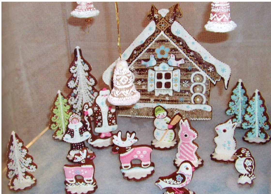
Северо-русские козули. Из книги: Т.В. Зеленина. Елка моего детства. Архангельск, 2006.

При всем многообразии игрушек, украшавших русские елки, особое место среди них, безусловно, занимали игрушки из стекла. Ведь именно посеребренное стекло позволяло рождественскому дереву сиять во всем его блестящем великолепии, отражая и усиливая игру света.