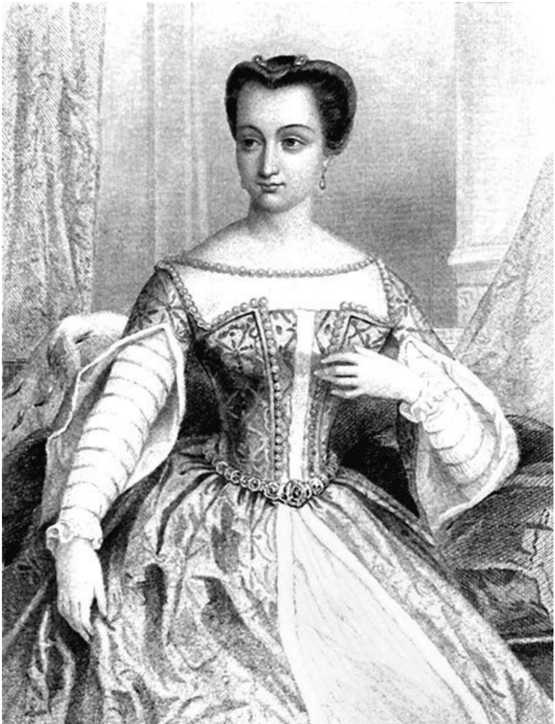
Диана де Пуатье (1499–1566) – возлюбленная и официальная фаворитка короля Генриха II Французского

Но фаворитка – это не только выдумка влюбленного воображения и символика королевской власти, могущества и мужественности. У нее имелась и своя должность. Часто, прибрав к рукам искусство, художественную литературу и нравственность, она получала весьма высокий статус, который распространялся на все и принуждал к повиновению даже министров. Впрочем, власть, обретенная преимуществом в любви и слабости к ней короля, в какой-то мере оставалась домашней. И можно только удивляться тому, что все, что было во Франции богатого, прекрасного, достойного и талантливого, приносило свою дань к ногам этого существа,