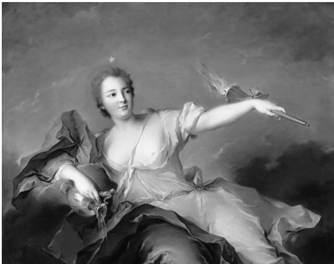
Мари-Анн де Майи-Нель (1717–1744) – французская фаворитка Людовика XV, пятая дочь маркиза Луи III де Майи-Нель (1689–1767) и Арманды де Ля-Порт-Мазарен (1691–1729)

государю, – это делалось лишь для того, чтобы оторвать короля от той партии, где она доминировала, и обеспечить победу ее конкурентам.