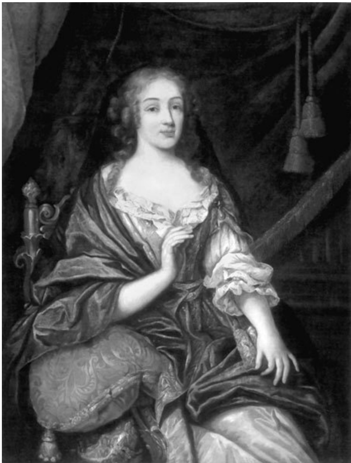
Луиза-Франсуаза де Ла Бом Ле Блан (1644–1710) – герцогиня де Лавальер и де Вожур, фаворитка Людовика XIV

было конца, не упускали даже самых пустячных затей. Но помимо игры угадывается и внутренняя глубина: перед нами те, кто действительно, по-настоящему любил.