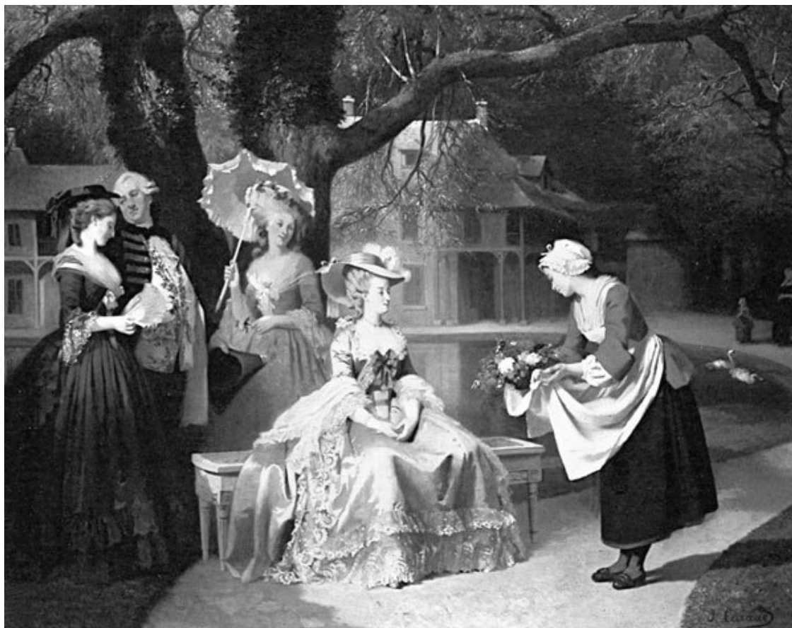
Мария Антуанетта и Людовик XVI в саду Тюильри с мадам Лэмбэйл