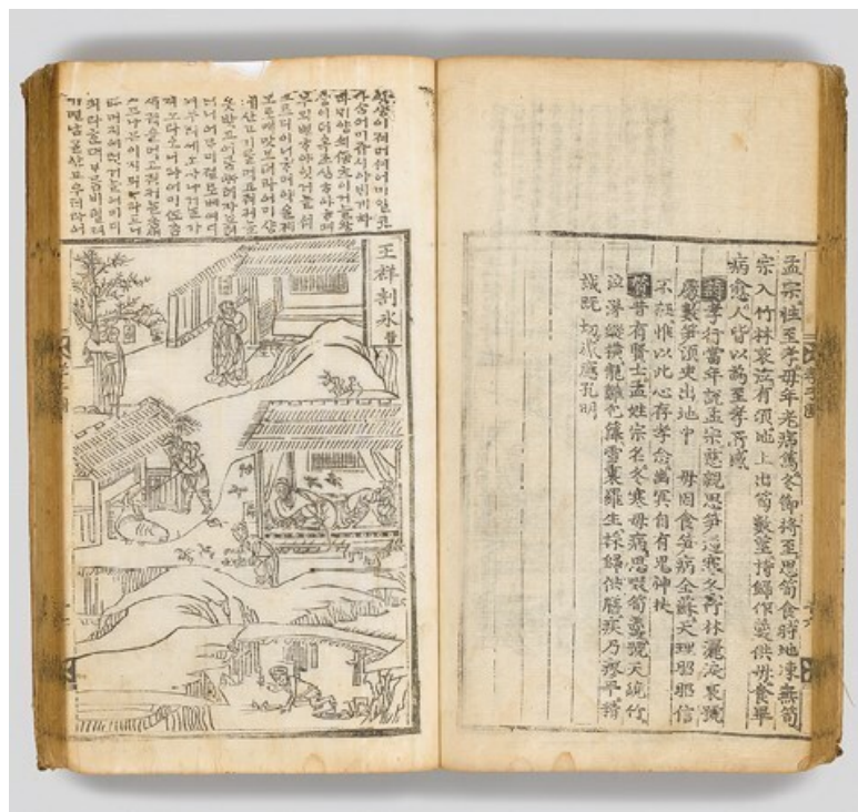
Рис. 1. Самганхэнсильдо. Ксилография. 23,5 × 37,5 см. Национальный музей Республики Корея, Сеул

ком много времени за созерцанием живописи.