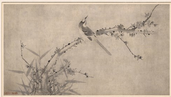
Рис. 2. Чо Сок (##, 1595–1668). Птица на ветке сливы. XVII в. Бумага, тушь, 83,3 × 46,1 см. Национальный музей Республики Корея, Сеул

В монохромной живописи важную роль играет незаполненное пространство – ёбэк. Большую часть произведения могли оставлять незаполненной, ёбэк становилось туманом, водой, небом, воздушным пространством.