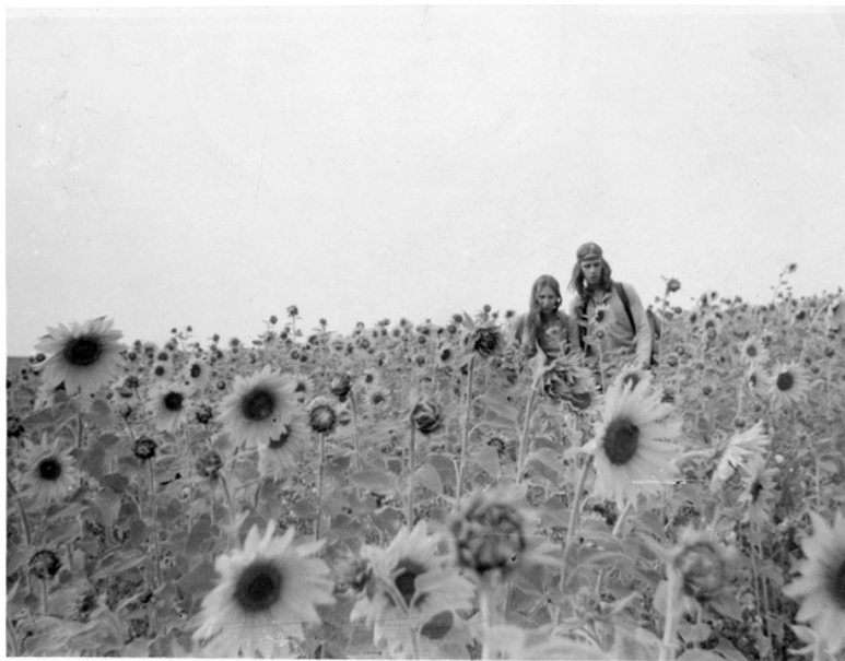
Ил. 3. Лена из Москвы и Гулливер из Горького.

ся в Москве, и у нее есть несколько главных героев, которые в моей интерпретации играли основную роль в продвижении повествования. Сейчас я в полной мере осознаю ошибки, которые допустила, чтобы сделать эту историю более удобной для чтения. Вторая глава является анализом различных аспектов хипповского движения и включает части, посвященные идеологии, кайфу, материальности, безумию и женщинам-хиппи.