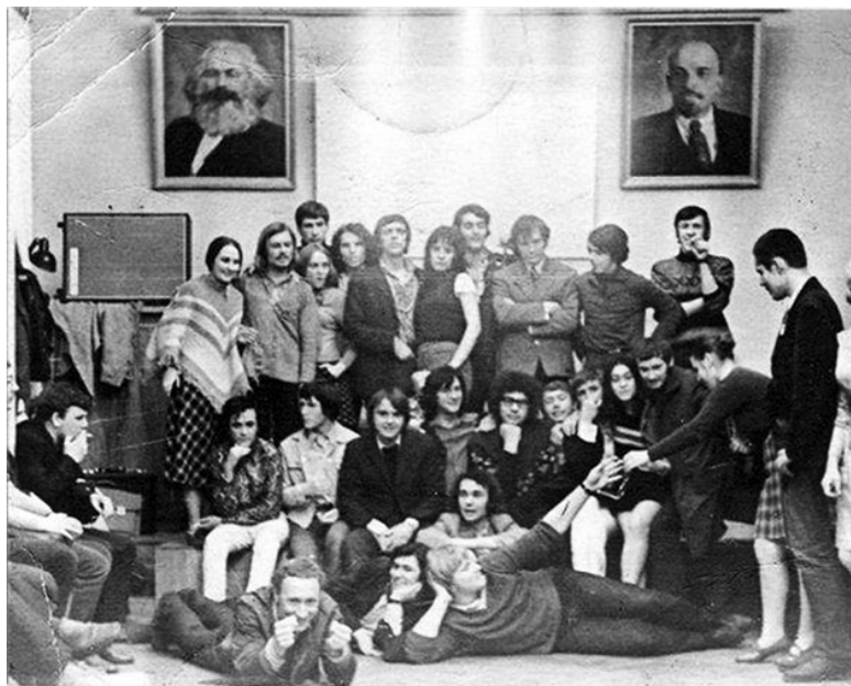
Ил. 13. Солнце и хиппи его первой Системы, 30 апреля 1971 года.

ного отца», все чаще и чаще выпивая и напиваясь, сидя на Пушкинской площади, – авторитет и легенда, чья система росла и продолжала жить своей собственной жизнью, пока он медленно угасал в течение последующих двадцати лет.