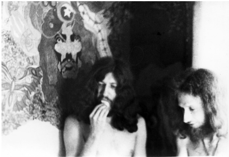
Ил. 8. Кащей и Шекспир в хипповской квартире («на флэту»), начало 1970-х.

Параллельно с новой, видимой хипповской Москвой создавалась хипповская Москва скрытая. В то время как дефицит личного пространства выталкивал советских хиппи, как и любую другую молодежь, на улицы, они также продолжали начатую в 1950–1960-х традицию превращения личных квартир в квазипубличные пространства. По мере того как расселялось все больше коммуналок и люди перебирались в отдельное жилье на московских окраинах, некоторые моло-