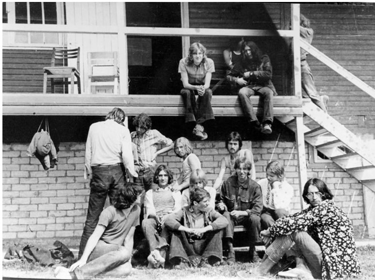
Ил. 15. Тусовка московских и эстонских хиппи, лето 1972 года.

Интересно, что в этой брошюре специально подчеркивалось, что хиппи представляют опасность не своим внешним видом и даже не тем, что употребляют наркотики, а «идеями». «Идеи» считались заразными и опасными не только для общества в целом, но и для самих комсомольцев-дружинников. Поэтому авторы инструкции стремились не допустить возникновения каких-либо симпатий у читателей. Один из парадоксов советского общества заключается в том, что наи-