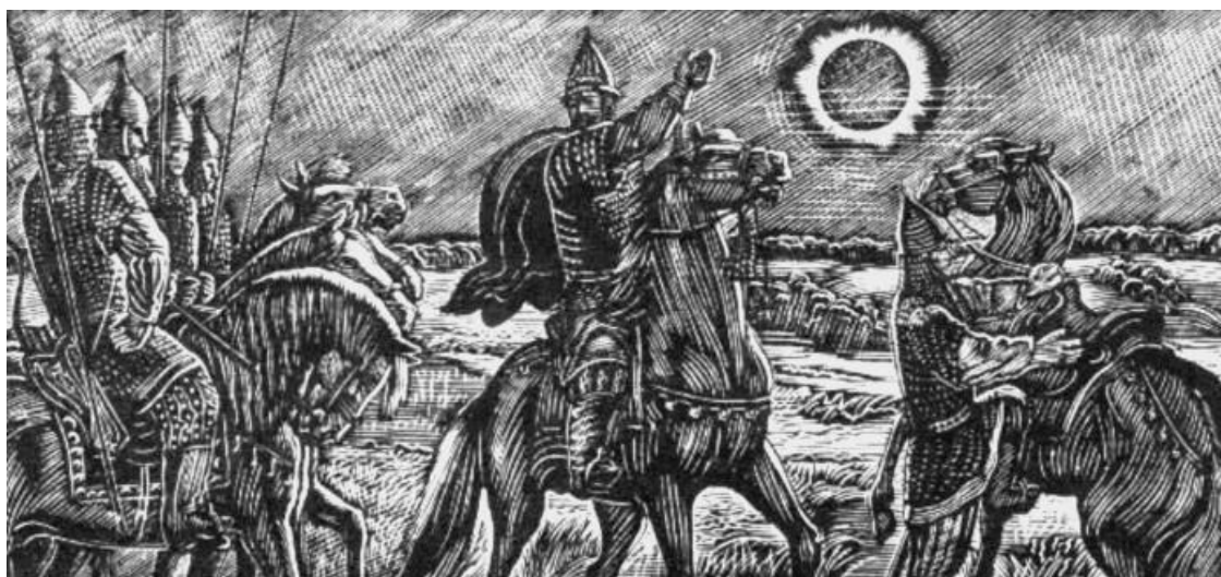
«Слово о полку Игореве», иллюстрация В. Фаворского

Скоро встреча со Святыми горами – местом уникальным во многих смыслах. Но за двадцать километров, отделяющих мост через Оскол от станции Святогорск, мы успеем рассказать вам о том, что село Букино славно не тем, что здесь находится так называемая стыковая станция двух дорог, и не только тем, что в округе на пятьдесят километров находятся наизнаменнейшие грибные леса, богатство которых Донбасс вот уж лет тридцать-тридцать пять пытается выбрать своими корзинками, сумками да рюкзаками, да никак не управится.