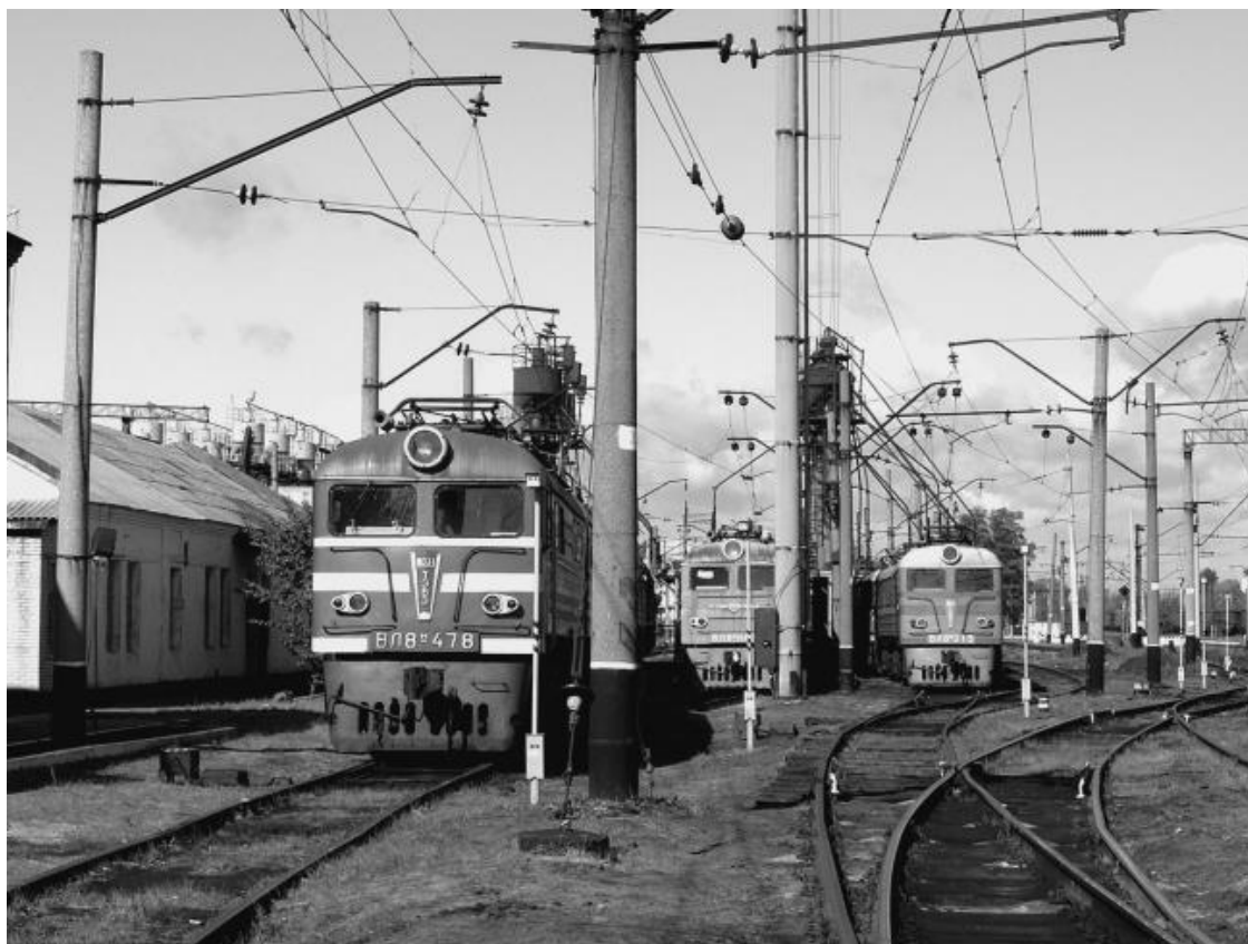
Станция Красный Лиман, локомотивное депо

От Славянска почти строго на восток 28 километров отличного шоссе с двумя мостами, один из которых железнодорожный.