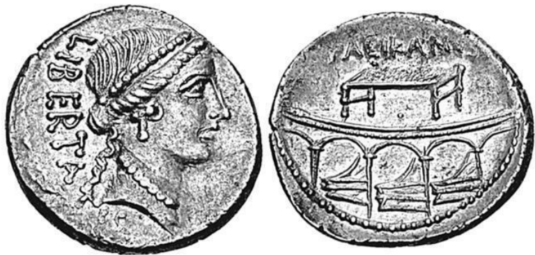
Изображение Ростры на римской монете

Это строгое государство, где все общественные классы подчинены друг другу, тем не менее оно не деспотическое. Аристократия, которой принадлежит власть, не похожа на венецианскую аристократию, совещающуюся втайне и не позволявшую громко высказывать свое мнение. Самые важные вопросы обсуждаются публично в Комиции. В том месте, где происходили народные собрания, есть кафедра для ораторов, и ее считают священным местом ( templum ). Кафедрой служила возвышенная площадка – ростра, откуда оратор был повсеместно виден, что заставляло его прилично одеваться и принимать благородные позы. Стена, ее поддерживающая, имеет странное украшение; к ней прикрепили же-