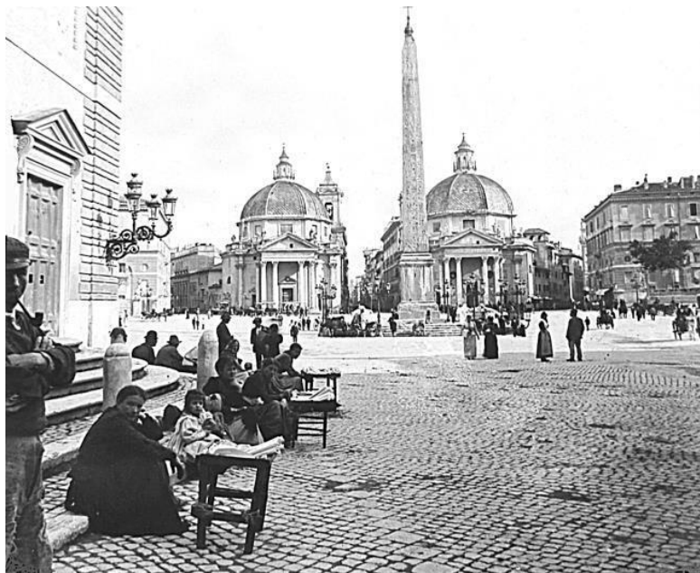
Пьяцца-дель-Пополо. Фото конца XIX в.

дешь ли его в том же виде, когда расстался? Вот первый вопрос, которым задаешься, когда возвращаешься в Рим. Трудно не быть им озабоченным, и как только выходишь из вагона на площадь Диоклетиановых терм, такую тихую прежде, а теперь такую оживленную и шумную, невольно смотришь во все стороны с беспокойным любопытством.