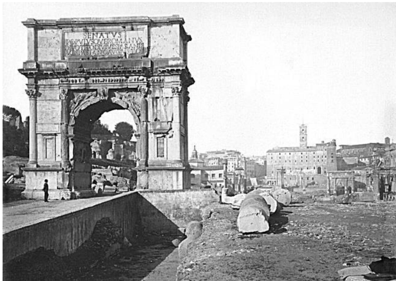
Арка Тита. Фото 1875 г.

О направлении Священной дороги археологи спорили немало. Неудивительно, что вопрос этот остался для нас темным; даже в древности он, по-видимому, не был вполне ясным. Из примера Помпеи мы знаем, что на улицах в то время не было надписей; так как имена, которые им давали, распространялись только по обычаю, в их обозначении могло быть много неопределенности. Так Варрон 12 и Фест 13 сооб-