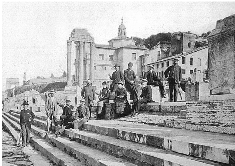
Археологи на Римском Форуме. Фото 1880 г.

дору, и все находили у древних писателей тексты, подкреплявшие их мнение. Чтобы рассеять эту путаницу, необходимо было сделать новые раскопки. Их предприняли с мыслью, что теперь достигнут окончательных результатов. Недостаточно было сделать несколько отверстий и дойти в некоторых местах до античной почвы, решили совершенно освободить площадь от обломков и вполне очистить ее; это было средством узнать наконец правду о загадках Форума.