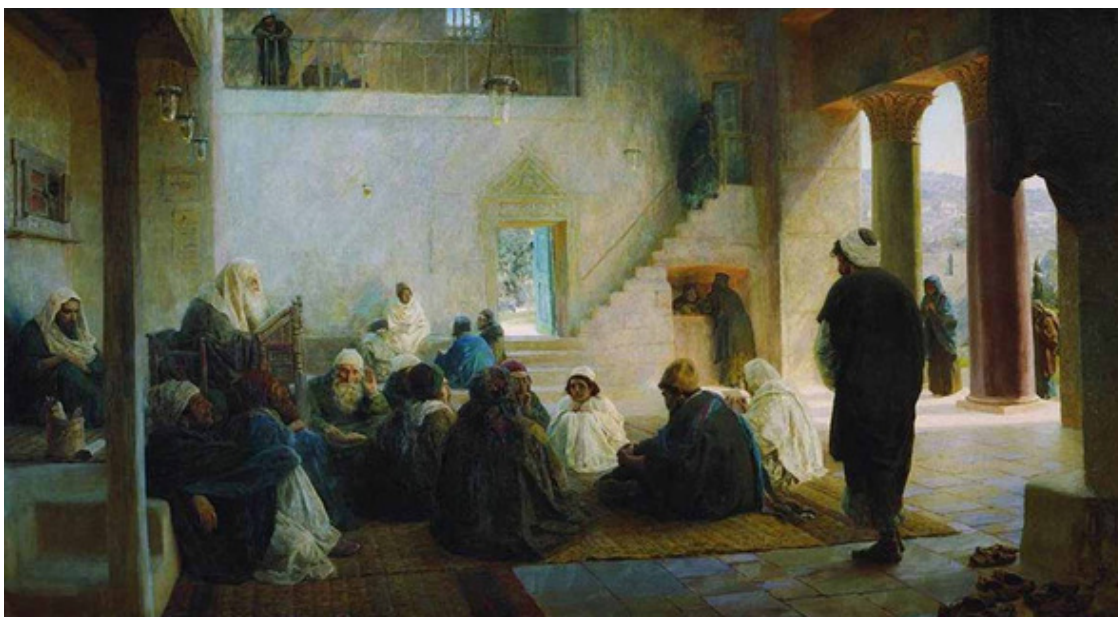
Поленов В. Д.

Лк.2:43—45 Когда же, по окончании дней праздника, возвращались, остался Отрок Иисус в Иерусалиме; и не заметили того Иосиф и Матерь Его, но думали, что Он идёт с другими. Пройдя же дневной путь, стали искать Его среди родственников и знакомых и, не найдя Его, возвратились в Иерусалим, ища Его.