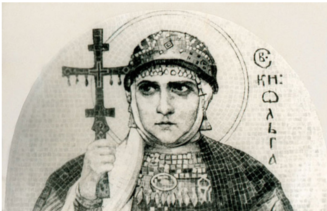
Великая княгиня Ольга

Вот и сейчас в глубоком раздумье Ольга медленно шла по узенькой улочке в надежде на то, что Всевышний услышит ее молитвы. «Что же делать, Господи великий и милостивый?» – молилась она дни и ночи напролет. Святослав с войском был далеко, помощи ждать было неоткуда, одна надежда на чудо и Бога.