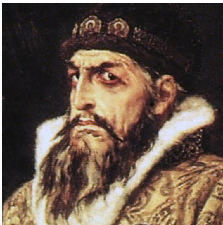
Царь Иван Грозный

Опричный погром колыбели русской цивилизации, вольного и свободолюбивого Великого Новгорода в 1569—1570 годах показал антинародный характер власти, которая с оружием в руках выступила против своего города. Вместо выполнения своей основной функции защиты городов и населения от чужестранцев, власть превратилась в свою противоположность, воюя против собственного народа. Отрицая собственный народ, власть готовит и собственное отрицание.