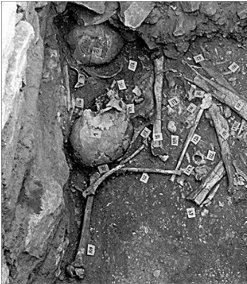
Захоронение останков людей и животных, найденное археологами в Бадже