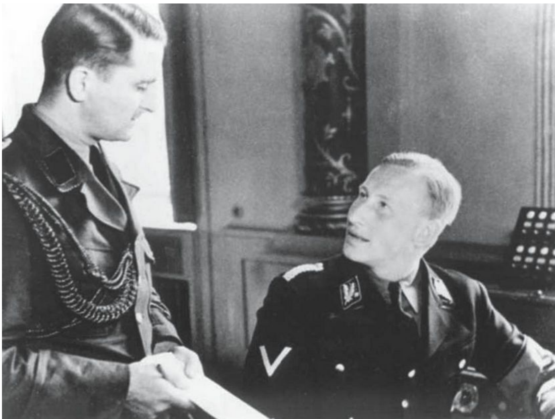
Альфред Науйокс на докладе у Рейнхарда Гейдриха