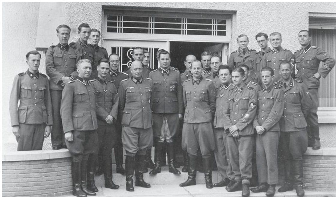
Иностранные добровольцы в войсках СС с немецкими сослуживцами

После Западной кампании 1940 г. и оккупации ряда европейских стран в войска СС был начат набор иностранных добровольцев. Из них было создано два новых полка СС, ставших позднее основой для дивизии «Викинг». В начале 1941 г. общеэсэсовские обозначения частей – штандарт, штурмбанн и штурм были заменены на армейские аналоги – полк, батальон и рота.