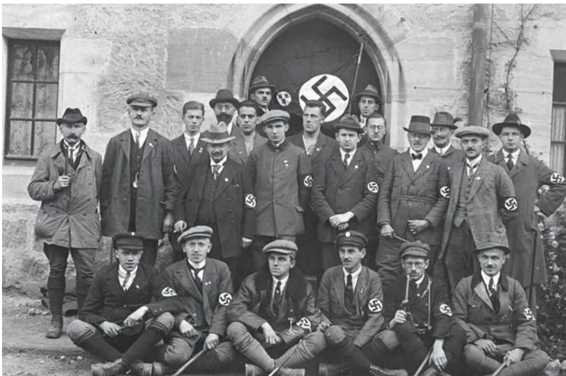
Члены НСДАП на Немецком дне в Кобурге. 1922 г.

После провала путча Гитлер попал в тюрьму в Ландсберге, а НСДАП, СА и ударный отряд были запрещены. Несмотря на запрет, численность партии и СА (находившихся на нелегальном положении) непрерывно росла. К моменту выхода Гитлера из тюрьмы численность СА увеличилась почти в 15 раз. В 1925 г. запрет с функционирования НСДАП был снят, и деятельность СА с февраля 1925 г. вновь стала вестись официально. В апреле того же года бывший член ударного отряда Юлиус Шрек получил задание создать новое подразделение для личной охраны Гитлера. 21 сентября 1925 г. Шрек приказал организовать аналогичные подразделения по всей Германии, из расчета 20 человек в Берлине и по 10 человек на местах в остальной Германии. В отличие от СА, к кандидатам предъявлялись определенные требования: быть в возрасте от 25 до 30 лет, иметь двух поручителей из числа НСДАП и жить на одном месте не менее пяти лет.