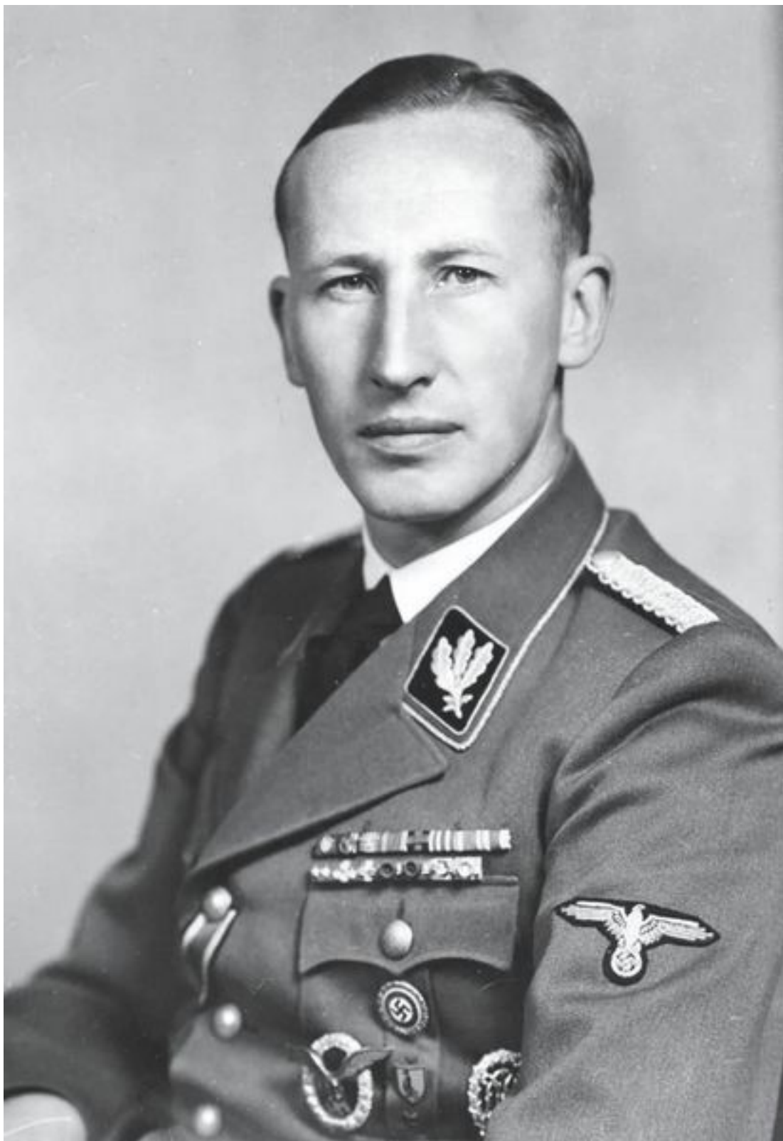
Рейнхард Гейдрих. Фото военных лет

За годы войны численность войск СС неуклонно росла. Так, на 1 декабря 1939 г. в рядах войск СС насчитывалось 40 000 солдат и офицеров, годом позже, 1 декабря 1940 г., их численность увеличилась до 50 074 человек, а на 1 декабря 1941 г. составила уже 198 364 человека. Через год, 1 декабря 1942 г., в их рядах числилось уже 230 000 человек, а на 1 декабря 1943 г. — 433 400 человек. К концу войны численность войск СС еще более увеличилась и составила