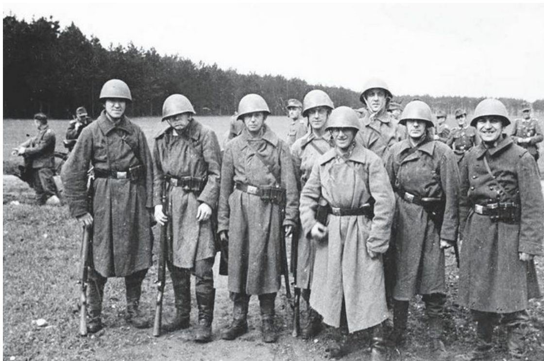
Диверсанты полка «Бранденбург» на Восточном фронте. 1941 г.

Накануне войны с СССР абвер усилил работу по вербовке русских белоэмигрантов и представителей национальных диаспор народов Советского Союза. Были организованы украинский батальон «Нахтигаль» (Соловей), грузинская группа «Тамара» и эстонская группа «Эрна» (см. соответствующие главы). В апреле 1941 г. II батальон полка принял участие в нападении на Югославию. В ходе боев особо отличились югославские фольксдойче. Тем временем численность полка росла вместе с увеличением числа рот в нем. Накануне вторжения в СССР диверсионные части были распределены по немецким армиям следующим образом: I батальон полка и батальон «Нахтигаль» были переданы в подчинение группы армий «Юг», II – в группу армий «Север», III батальон – в группу армий «Центр». Пополнение из граждан СССР позволило немцам роту агентов развернуть в целый батальон.