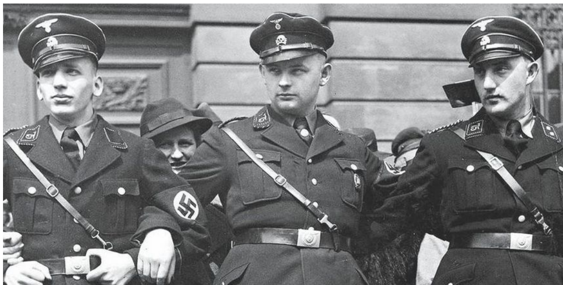
Члены 75-го штандарта СС в оцеплении на берлинских улицах

ние СС в равной мере отрицательно действовало на штурмовиков. 30 июня 1934 г. отряды СС при поддержке армии и с ведома Гитлера арестовали и уничтожили почти все руководство СА во главе с Эрнстом Ремом.