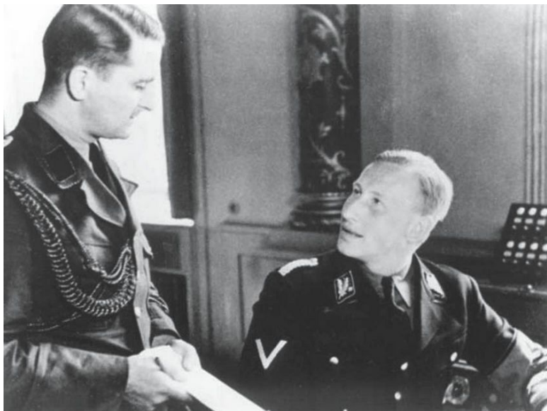
Альфред Науйокс на докладе у Рейнхарда Гейдриха

К концу 1930-х гг. все чаще интересы СД, гестапо и полиции безопасности стали пересекаться, что вносило большую путаницу в работу силовых ведомств. Сначала был организован координационный орган – Главное управление полиции безопасности (Sicherheitspolizeihauptamt). После начала Второй мировой войны последовали дальнейшие преобразования. Для упорядочения работы и более строгого разграниче-