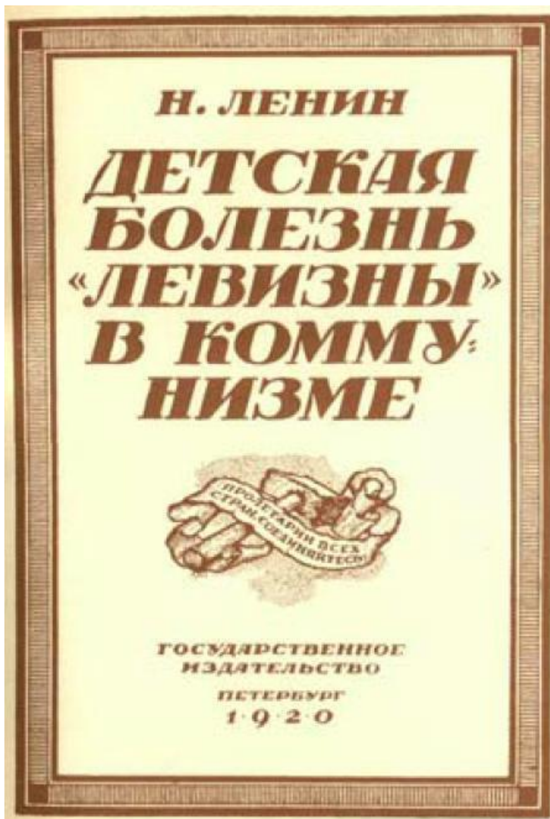
Обложка книги В. И. Ленина «Детская болезнь «левизны» в коммунизме». – 1920 г. (Уменьшено)