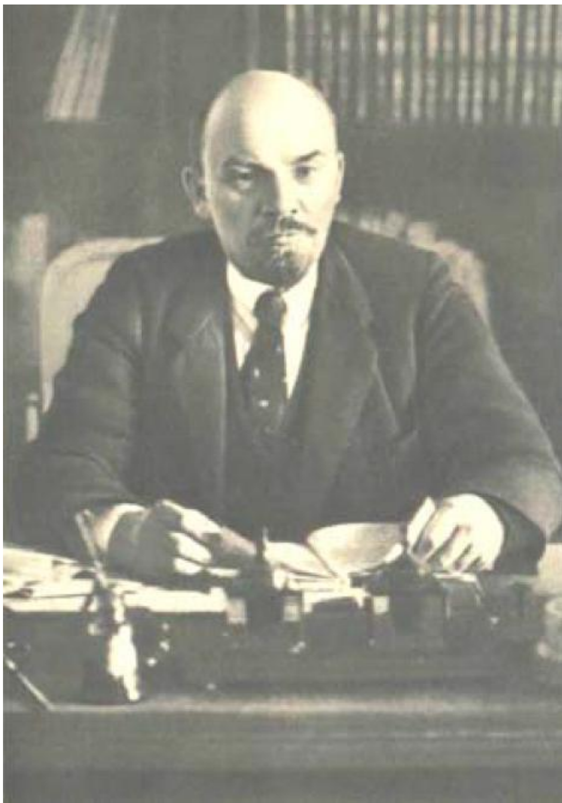
В. И. Ленин. Октябрь 1918 г.