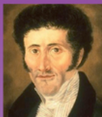
Э. Т. А. Гофман