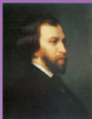
А. де Мюссе