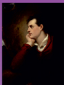
Дж. Г. Байрон