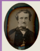
Э. А. По