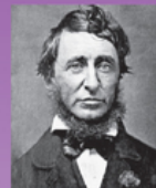
Г. Д. Торо