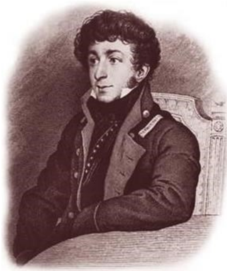
К. Н. Батюшков Художник О. Кипренский. 1815

Он считался олицетворением молодости и надеждой русской литературы начала XIX века, был любимым поэтом Пушкина-лицеиста. Впрочем, и в зрелые годы Пушкин относился к нему с большой симпатией, награждая его эпитетами «счастливый ленивец», «певец забавы». Однако можно утверждать, что великий поэт рассматривал Батюшкова весьма односторонне, что мы и попытаемся показать.