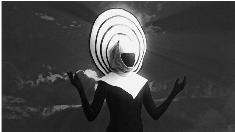
Ил. 1.4. Кадр из фильма «Во имя мира» (2011). Режиссер Джессика Митрани

Визуальное искусство тоже использует видеоформат как средство критически осмыслить социальную проблематику, связанную с идентичностью, однако в более радикальных с точки зрения политики и более экспериментальных по форме вариациях. Если выйти за рамки коммерческого фэшн-фильма, можно привести в качестве примера видеоинсталляцию Джессики Митрани «Во имя мира» (Headpieces for Peace, 2011), состоящую из одиннадцати сменяющих друг друга историй, в которых режиссер с позиций гендерных исследований критически рассматривает политику религии и стиля и прослеживает связи между модой и феминизмом. Отсылая к предисловию Мишеля Фуко, предваряющему