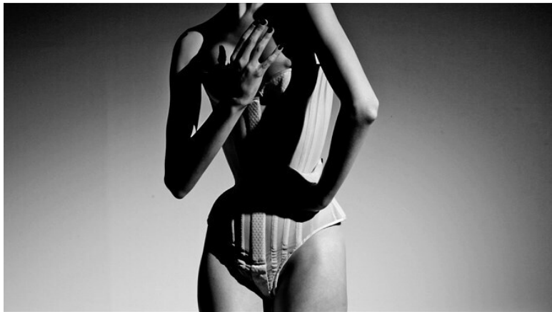
Ил. 1.5. Кадр из фильма «Талия» (2012). Режиссеры Кристиан и Мари Шуллер. Продюсер SHOWstudio