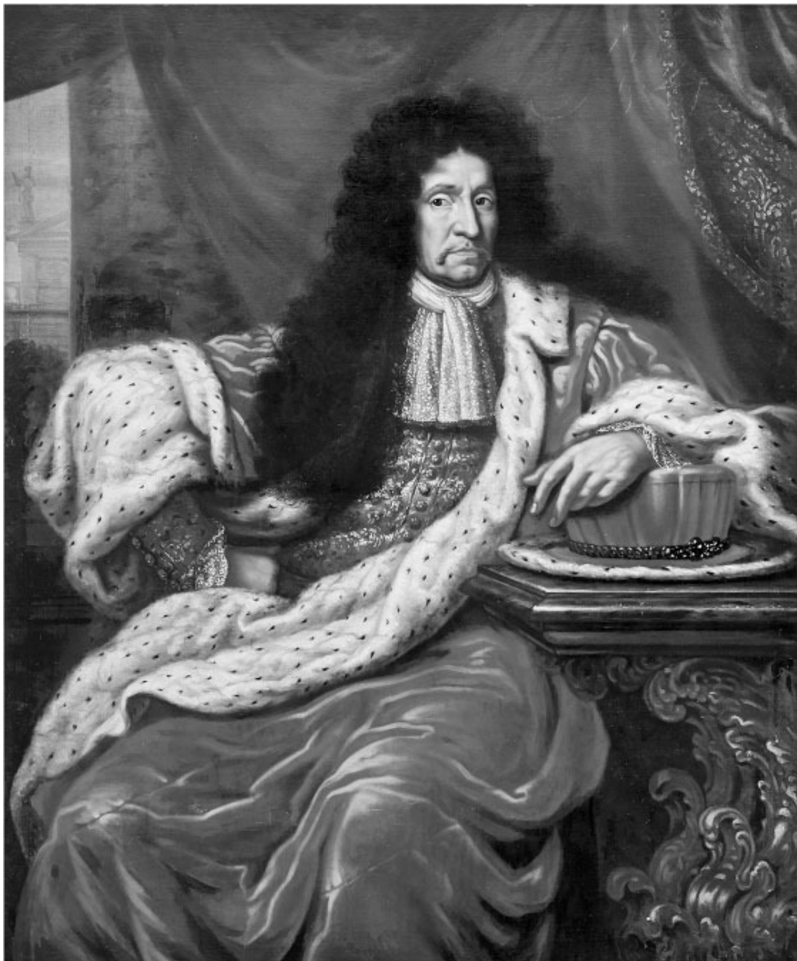
Генерал-фельдмаршал граф Эрик Йёнссон Дальберг (1625–1703), генерал-губернатор Ливонии, в мантии городского совета Риги. Портрет работы Давида Клёккер-Эренстреля

основные признаки истинного и великого благородства суть чистота происхождения, состоящая в потомственном наследовании истинно благородным отцам и матерям, и достоверность происхождения, которая должна доказываться прежде всего общественным мнением, историей и, в частности, семейными документами, не внушающими подозрений» [14, Р. 126].