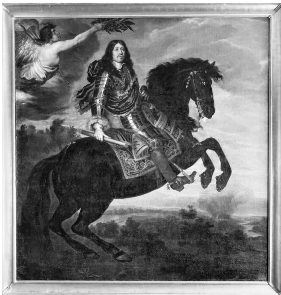
Конный портрет короля Швеции Карла X Густава в доспехах. Йоахим фон Сандрарт, 1650 г. Из собрания замка Скокlostер

Оскорбление офицера влекло отсечение руки, а в случае его гибели – повешение. Дуэль между офицерами влекла за собой смертную казнь не только для ее участников, но и для секундантов 26 .