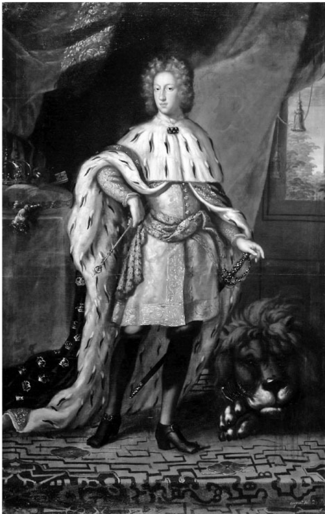
Король Швеции Карл XII в коронационном костюме в окружении символов королевской власти. Давид Клёккер-Эренстраль, 1697 г. Национальный музей Швеции