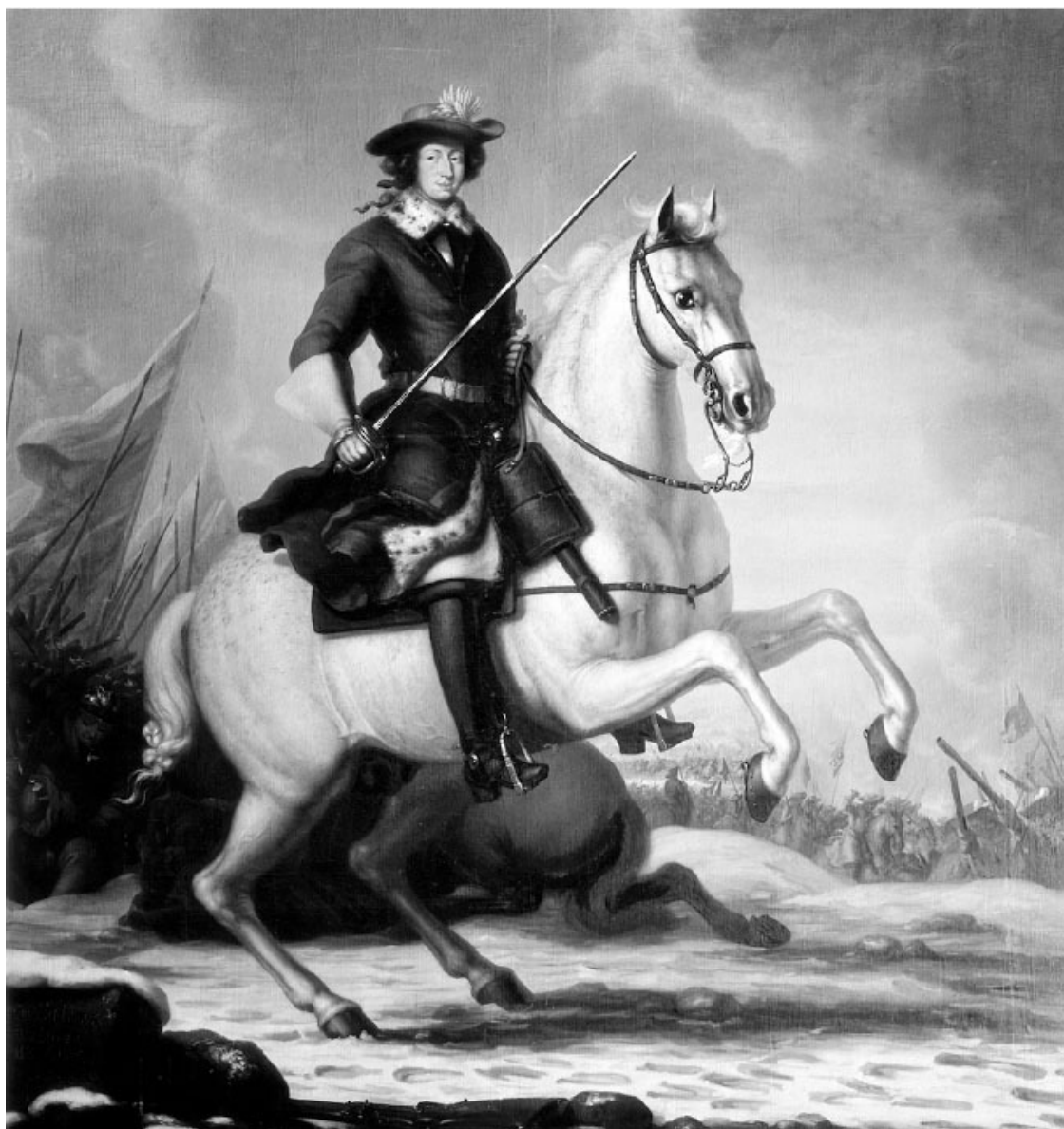
Карл XI. Король Швеции с 1660 по 1697 г. Картина Давида Клёккер-Эренстраля, 1676 г., из собрания замка Грисхольм

Солдаты внутри полка подразделялись на роты ( kompaniet ), которые сводились в батальоны. Роты назывались по названию той местности, где они формировались (рота Расбу, рота из Лагунды и т. д.) Солдаты один раз в год призывались на военные сборы, поддерживая тем самым свою боеготовность. В случае войны индельта после ухода одного солдата выставляла второго, служившего для пополнения постоянного полка. Если и второй солдат уходил на войну, индельта могла выставить нового рекрута. Из этих рекрутов в случае необходимости формировали полки военного времени – так называемые «третьеочередные» ( tremänningsregementen ) 33 . Эти полки обычно носили имя шефа (например, Уппландский третьеочередной пехотный полк, шефом которого в 1700–1712 гг. был генерал Левенгаупт, назывался «полком Левенгаупта» и т. д.). Четвертая очередь рекрутов шла на пополнение основного полка (вместо погибших или пропавших солдат второй очереди), а из рекрутов