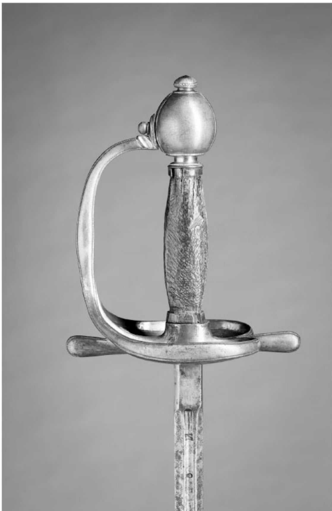
Кавалерийская офицерская шпага с оправой из позолоченной латуни, 1700 г. Из собрания Королевской сокровищницы, Стокгольм