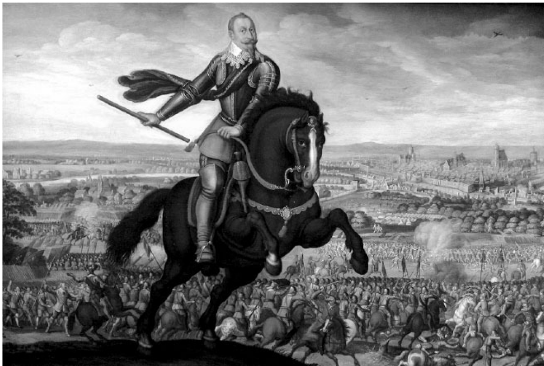
Шведский король Густав II Адольф на поле сражения при Брейтенфельде в 1631 г. Картина Иоганна Якоба Вальтера, 1632 г., из собрания Музея изобразительного искусства Страсбурга

В соответствии с этим артикулом были созданы: 21