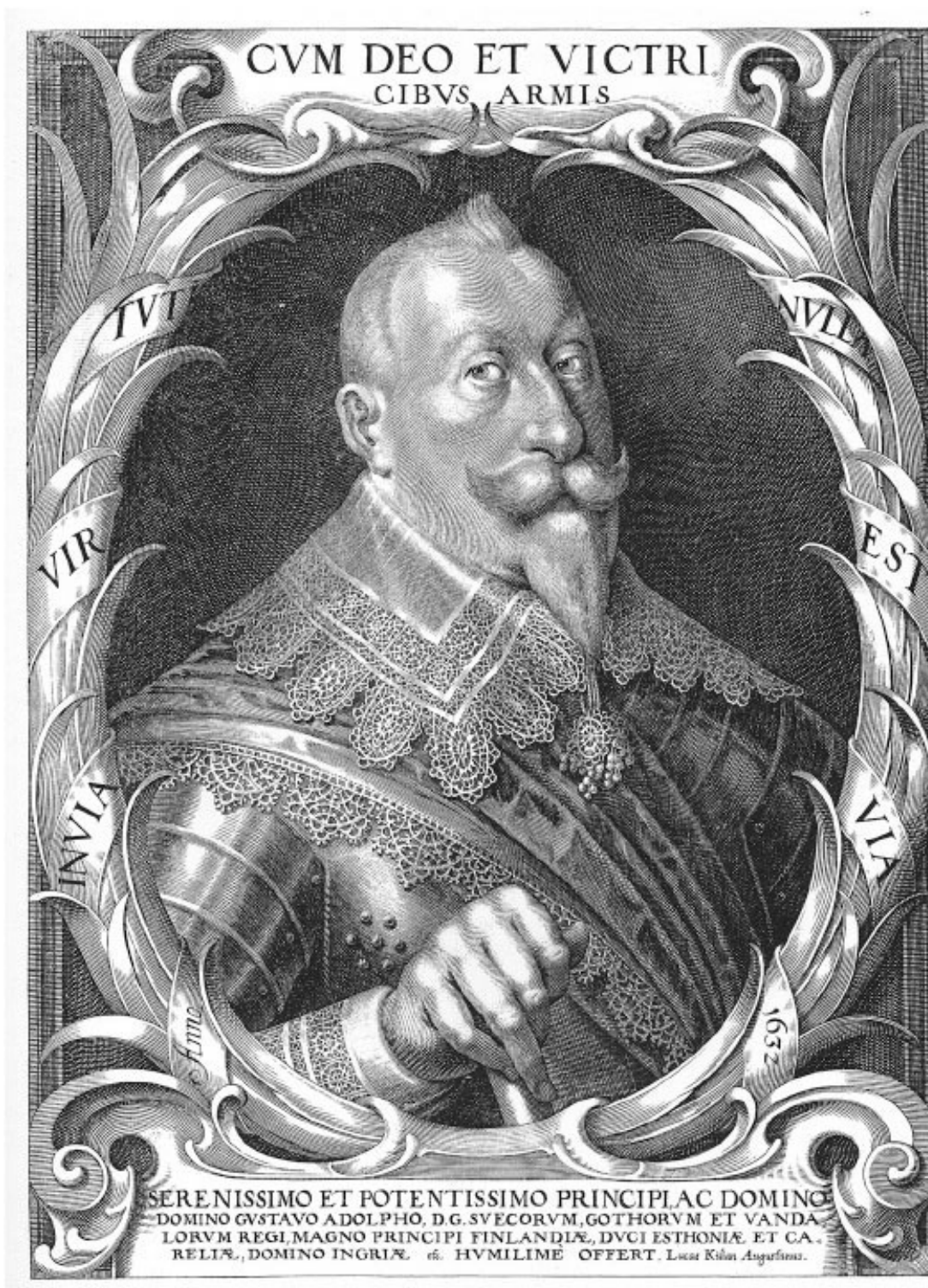
Король Швеции с 1611 по 1632 г. Густав II Адольф. Портрет, выгравированный Лукасом Килианом, около 1632 г.

Национальное пополнение армии происходило не только путем добровольной вербовки: при посредстве духовенства составлялись посемейные списки по всей стране всех мужчин старше 15 лет, и набор производился по усмотрению местных властей. Таким образом, шведы были первым народом, который организовал у себя национальную армию» 14 .