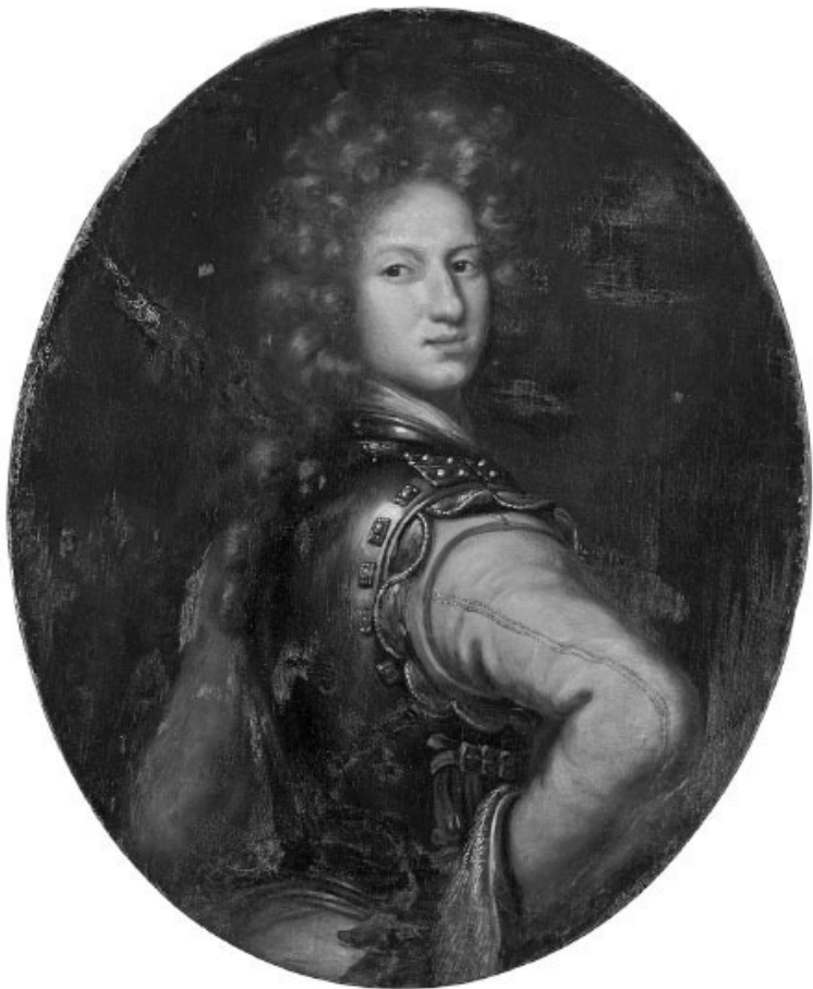
Пятнадцатилетний Карл XII в военной форме на портрете кисти Давида Клёккер-Эренстраля