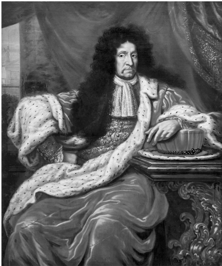
Генерал-фельдмаршал граф Эрик Йёнссон Дальберг (1625–1703), генерал-губернатор Ливонии, в мантии городского совета Риги. Портрет работы Давида Клёккер-Эрен-