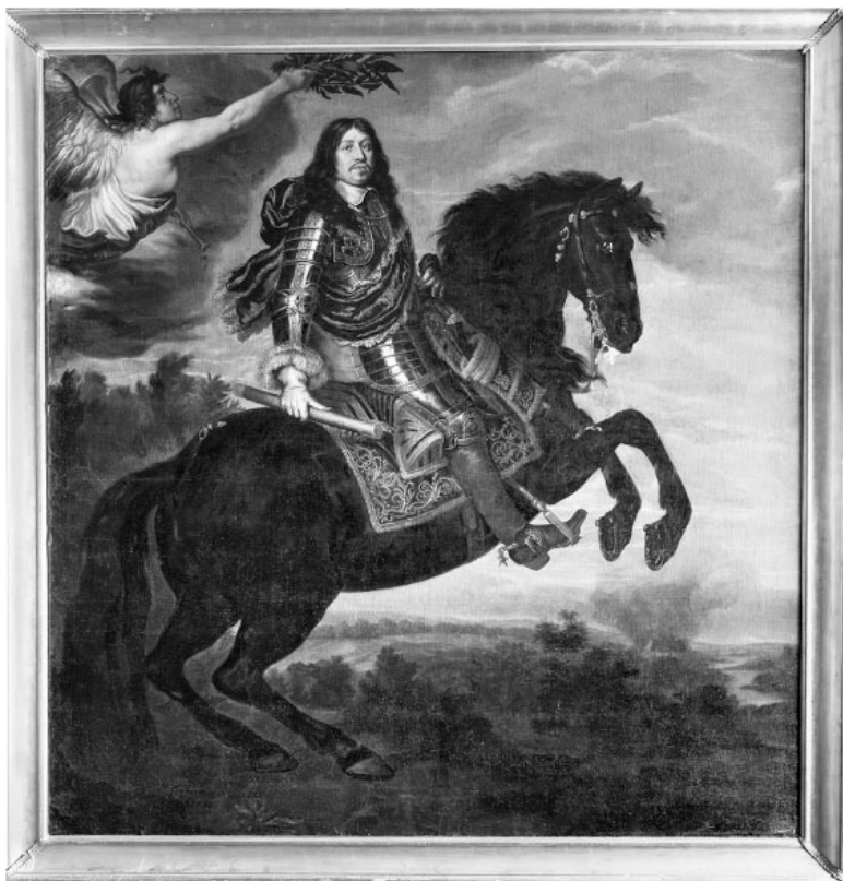
Конный портрет короля Швеции Карла X Густава в доспехах. Иоахим фон Сандрарт, 1650 г. Из собрания замка Скокlostер

Таким образом, драконовскими мерами удалось резко повысить уровень дисциплины в шведской армии, в первую