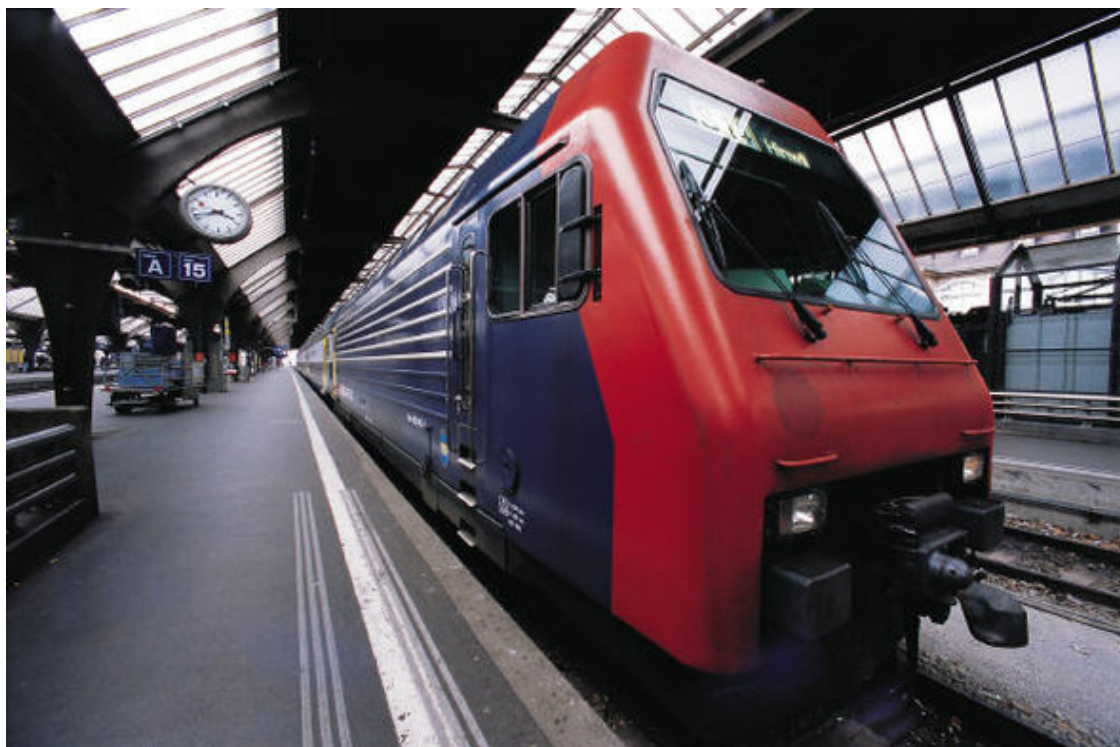
Поезд молей мечты