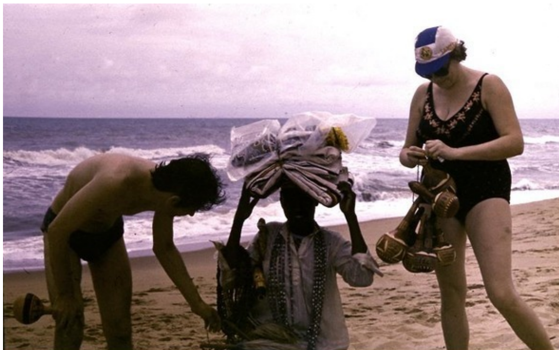
С. на пляже «Бадагри Бич» перед отъездом на Родину

И вот что самое удивительное: я совершенно не уставал! Это было больше, чем счастье. Я впервые в жизни, может быть, испытал ощущение покоя и полного довольства собой и «моей» женщиной. Со С. я был, как ребёнок в люльке: сытый, ухоженный, любимый и любящий, а главное, совершенно довольный своим существованием. Никаких тебе забот, тревожных мыслей, страхов и тягостной неопределённости.