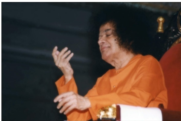
Сатья Саи Баба