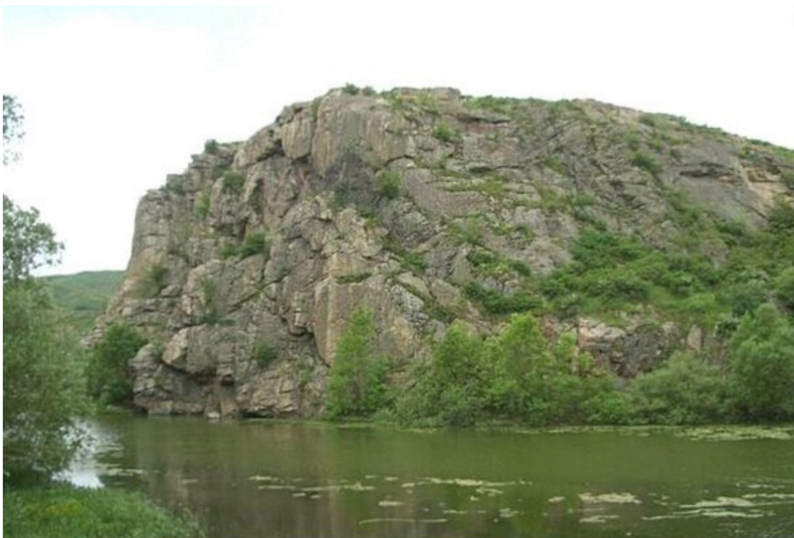
Марьин Утёс в дни моего детства... Шемонаиха

Вот из таких прекрасных мест увезли меня в незнакомый город, со странным названием Шемонаиха, где прошло основное детство. Расположен он на границе горной и степной местности на берегу быстрой реки Убы, притока Иртыша.