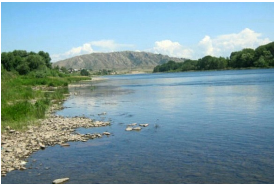
Река Уба и гора Мохнатуха... Шемонаиха

Река Уба была широкая и по виду с тихим течением, но когда начинаешь её переплывать, сразу чувствуешь ту невидимую силу, с которой она несёт твоё тело вниз по течению и только с большим трудом достигаешь другого берега далеко от того места, с которого заплывал.