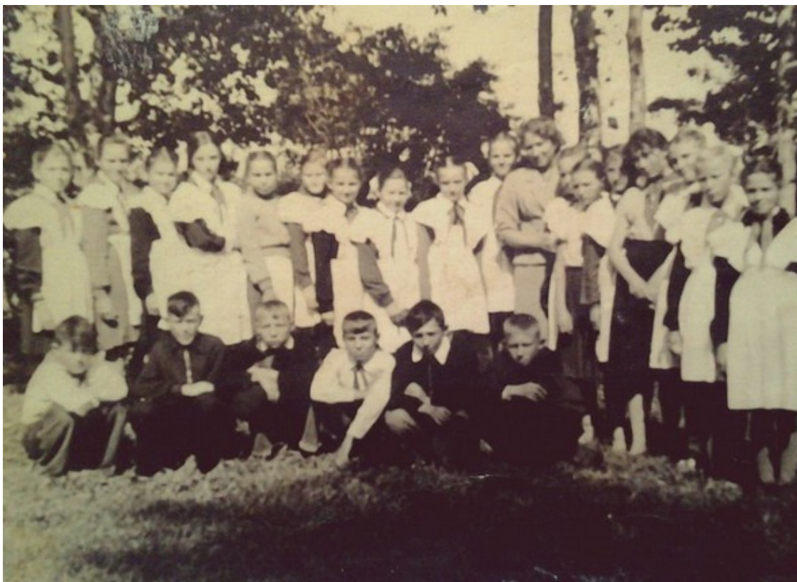
Наш седьмой класс... (я второй справа в первом ряду)

Странно, чем я становился старше, тем туманнее становилась мечта стать офицером, да и все сверстники чаще вели разговоры о мирных профессиях и высшем образовании.