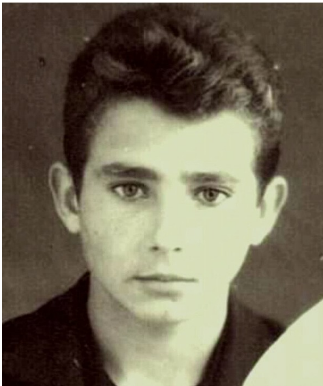
Таким я был в 9 классе... 1964 г. Шемонаиха

Однако наши встречи продолжались недолго. После окончания 9 класса я, вместе с родителями, готовился переезжать к новому месту жительства на Северный Кавказ.