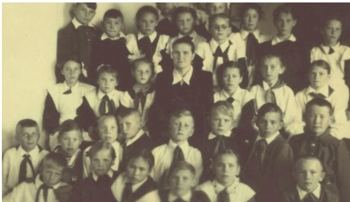
Мой третий класс... (я второй справа во втором ряду), Шемонаиха.