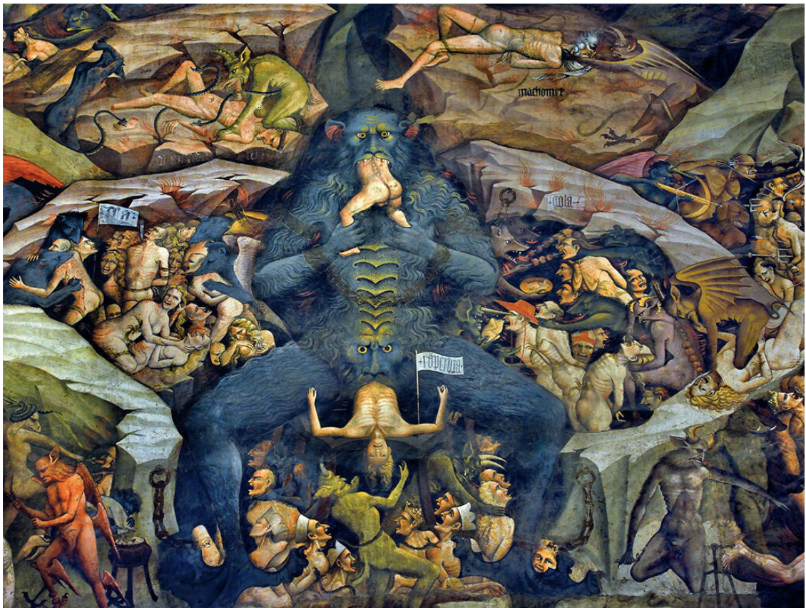
Джованни да Модена. Ад (фрагмент). 1410. Болонья, базилика Сан-Петронио