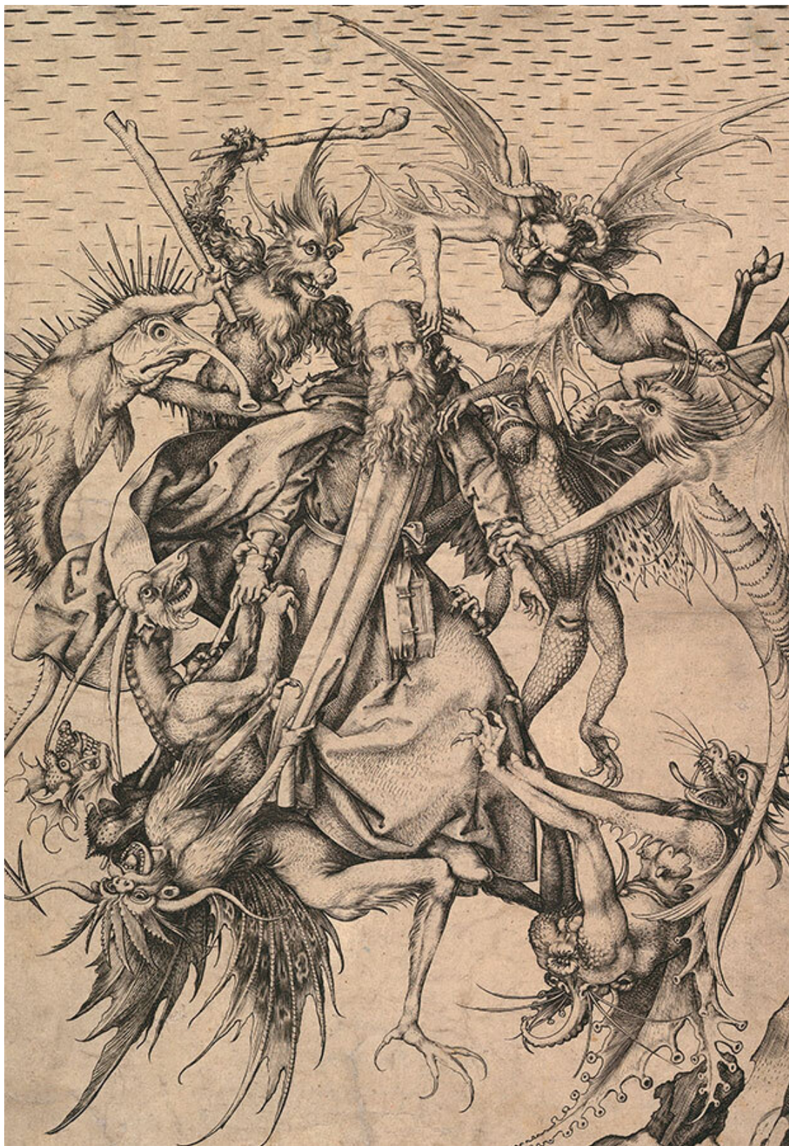
Мартин Шонгауэр. Искушение святого Антония. 1470–1474. Нью-Йорк, Метрополитен-музей