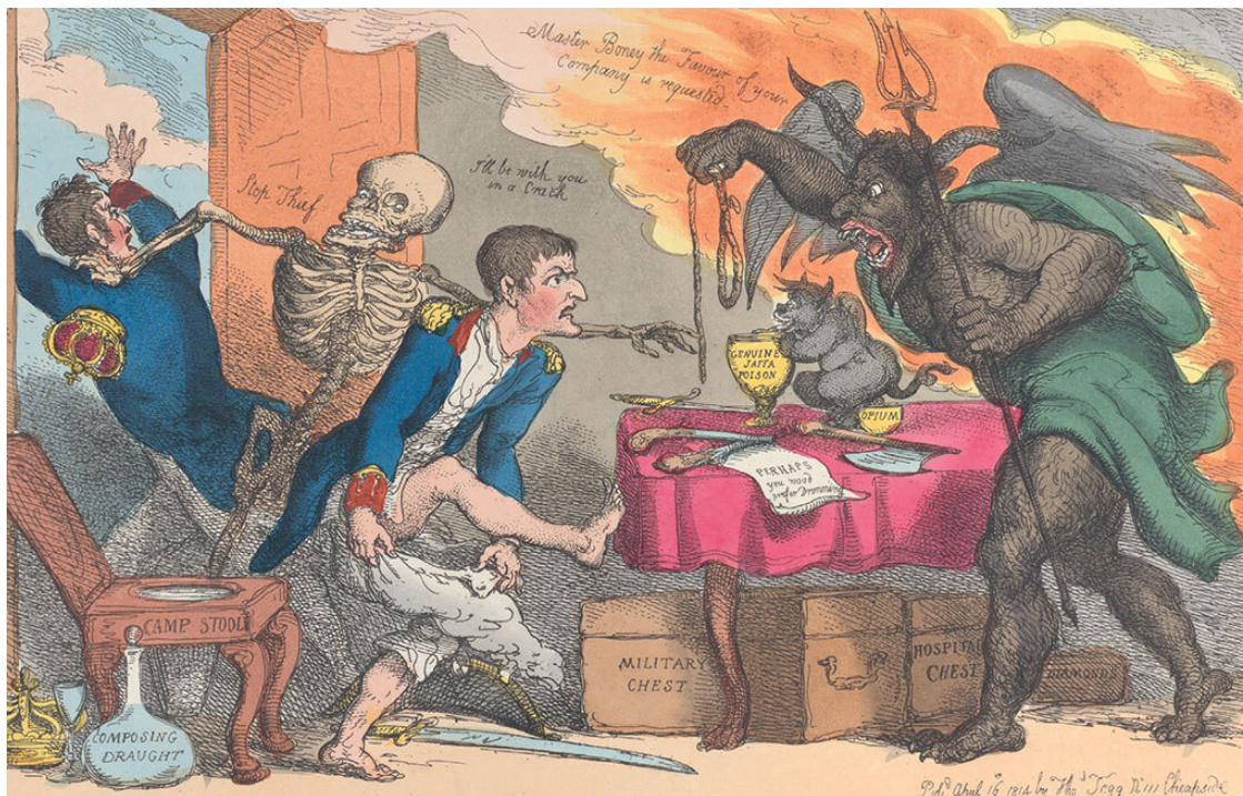
Сатирическая карикатура Томаса Роулэндсона, изображающая «дружеский» визит дьявола к Наполеону. 1814

нарушено, то это, скорее всего, приведет к несправедливости и уничтожению истины. Таким образом, зло искажает добро, оно нарушает его нормальное существование и исключает благо.