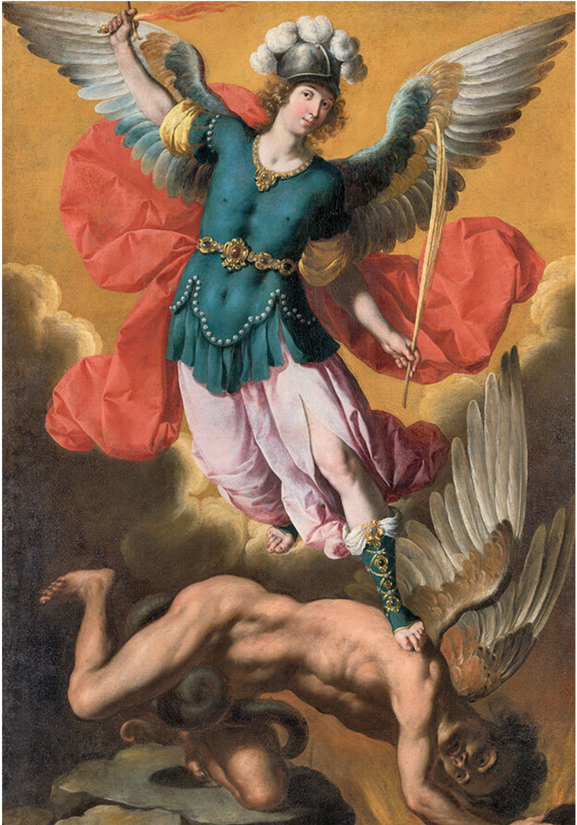
Игнасио де Рис. Архангел Михаил побеждает Сатану. 1640. Нью-Йорк, Метрополитен-музей

Именно поэтому отношение человечества к дьяволу всегда колеблется между несколько инфантильным стремлением нарисовать его зримый образ и глубокими размышлениями о