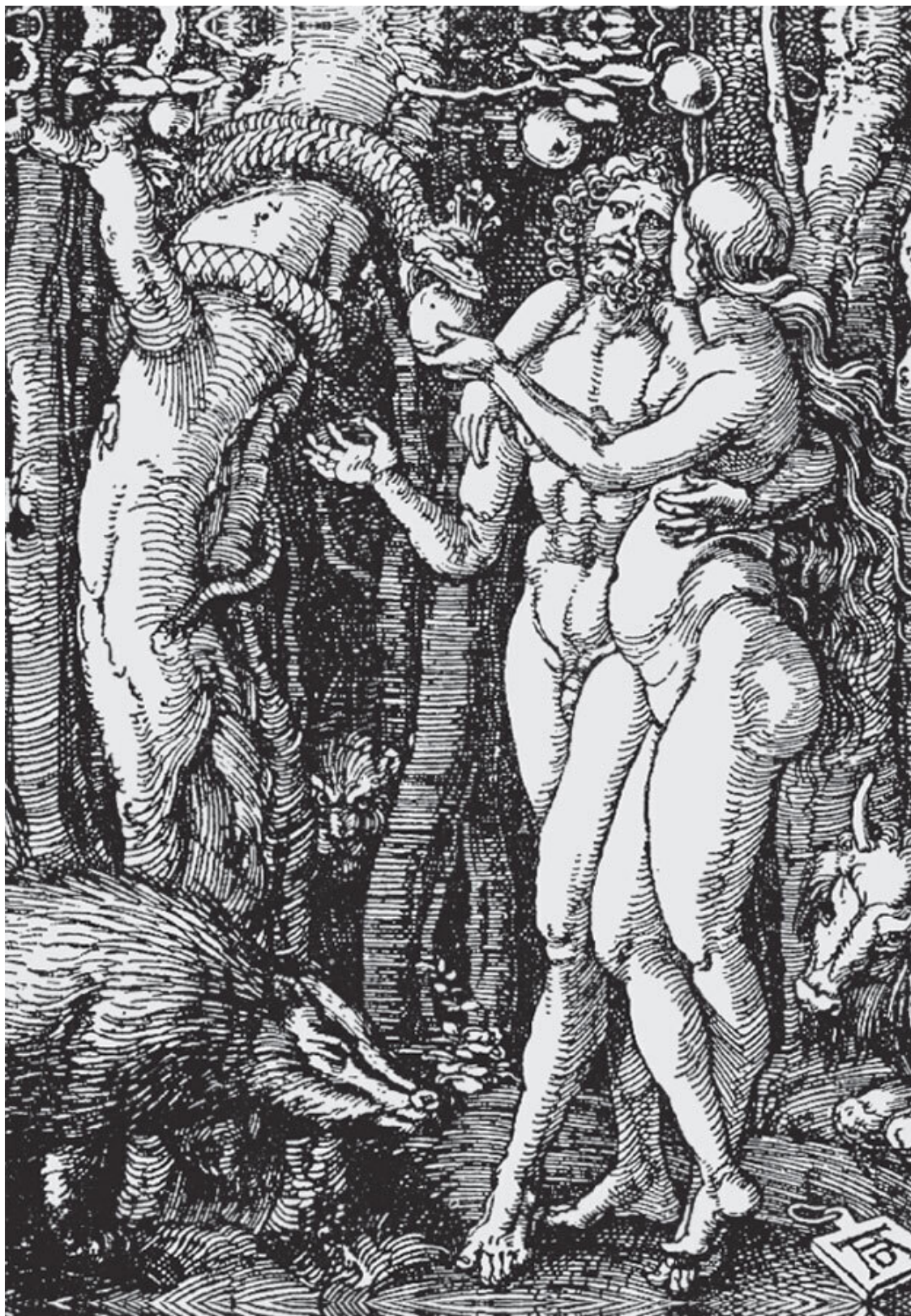
Маркантонио Раймонди [гравюра с картины Альбрехта Дюрера]. Адам и Ева с яблоком и змеем. Нью-Йорк, Метрополитен-музей

«Источник зла не может лежать в Боге, и вместе с тем нет никакого другого источника бытия и жизни, кроме Бога. Но если зло не может иметь своего источника в Боге и если нет никакого другого источника бытия, кроме