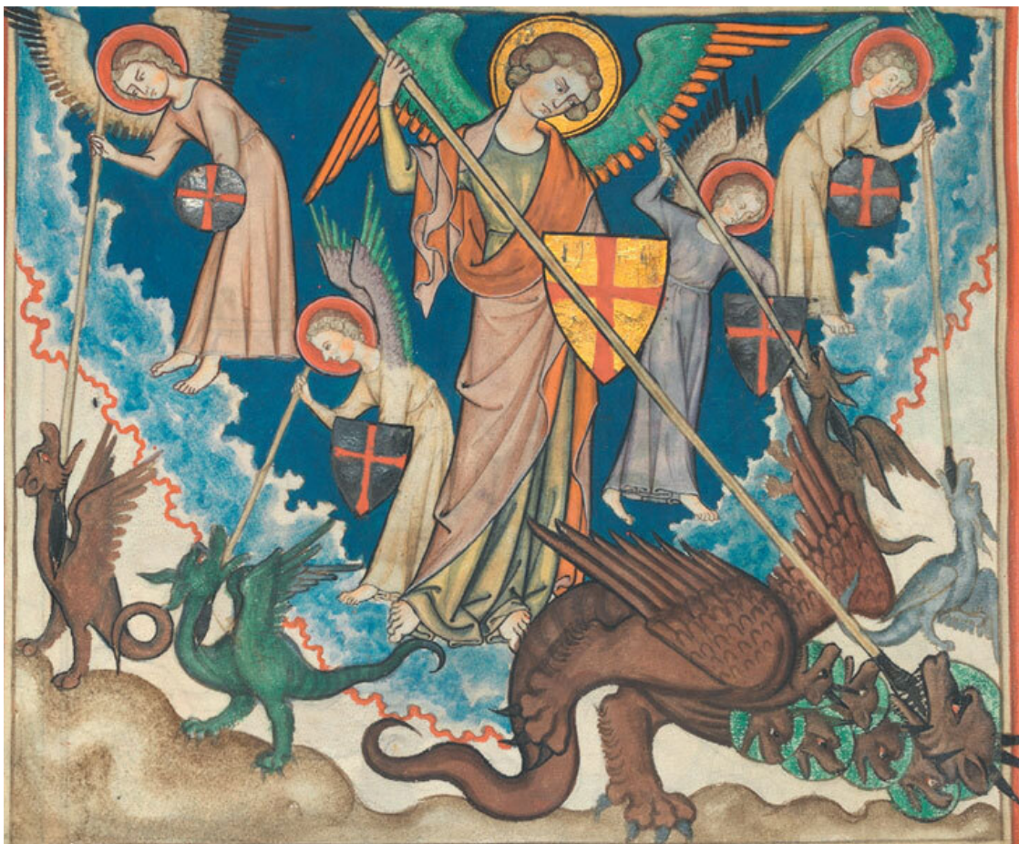
Война на небесах на миниатюре «Апокалипсис». Ок. 1330. Нью-Йорк, Метрополитен-музей

И низвержен был великий дракон, древний змей, называемый диаволом и сатаной, обольщающий всю вселенную, низвержен на землю, и ангелы его низвержены с ним» (12:7–9).