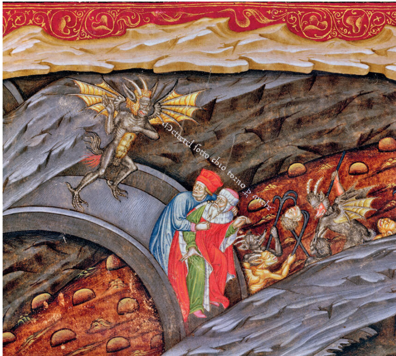
Миниатюра из рукописи «Ада» Данте с комментариями Джунифорте Барцицца, ок. 1440