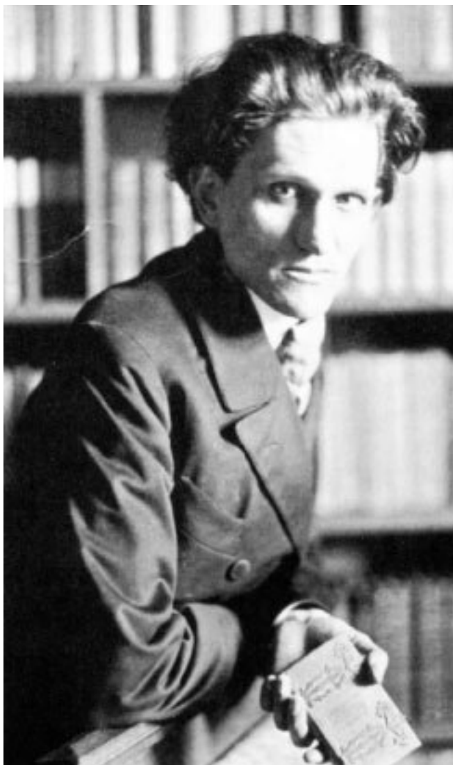
Стефан Георге в молодости