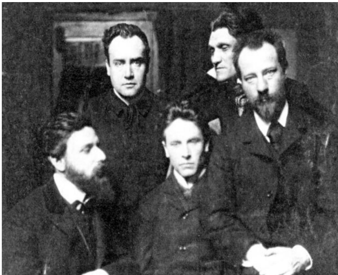
Мюнхенские космисты (слева направо): Карл Вольфскель, Альфред Шулер, Людвиг Клагес, Стефан Георге, Альберт Вервей