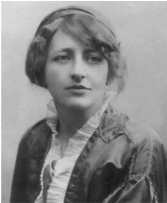
Франциска фон Ревентлов