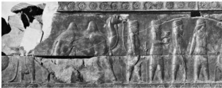
Четвертая и седьмая делегации на рельефах Ападаны: