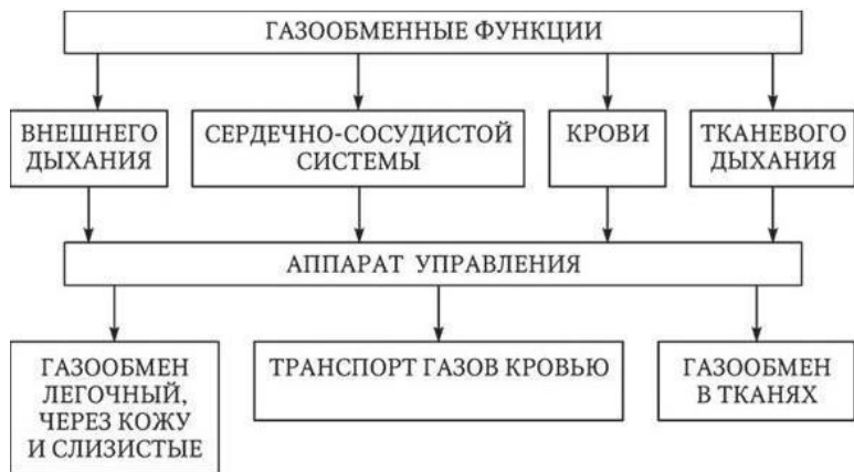
Рис. 1.1. Схема газообмена в организме

Эффективный газообмен в организме возможен при интеграции и координации функций различных подсистем (этапов) системы дыхания (рис. 1.1).