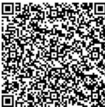
Ил. 1. Разрушение памятника Ленину (скульптор Сергей Меркуров, 1952) в Киеве в декабре 2013 года.

Иконоклазм, сопровождающий обычно радикальные смены режимов, характерен также и для периода системного перехода в странах бывшего соцлагеря, в Восточной Европе. Памятники в первую очередь являются знаками этого прошлого и подлежат разрушению. Некоторые из нас помнят знаменательные дни в августе 1991 года и свержение памятника Феликсу Дзержинскому на Лубянке, эйфорию и надежды, связанные с этим событием. Визуальной подкладкой этого события являлся, возможно, эпизод свержения памятника Александру III из фильма Сергея Эйзенштейна «Октябрь».