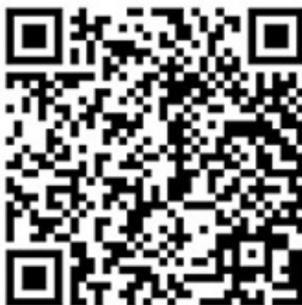
Ил. 2а и 2b. Зеленый мост в Вильнюсе. Историческое фото и фотография свержения скульптур