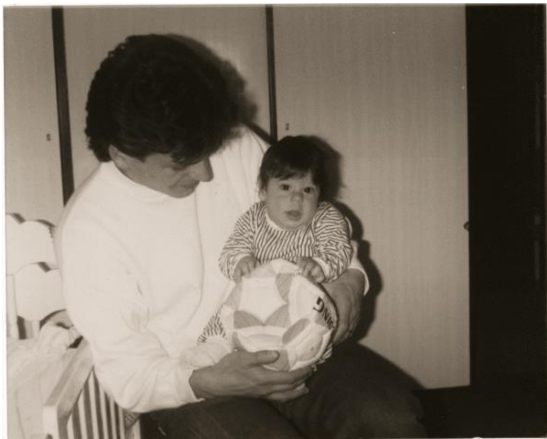
На руках у папы