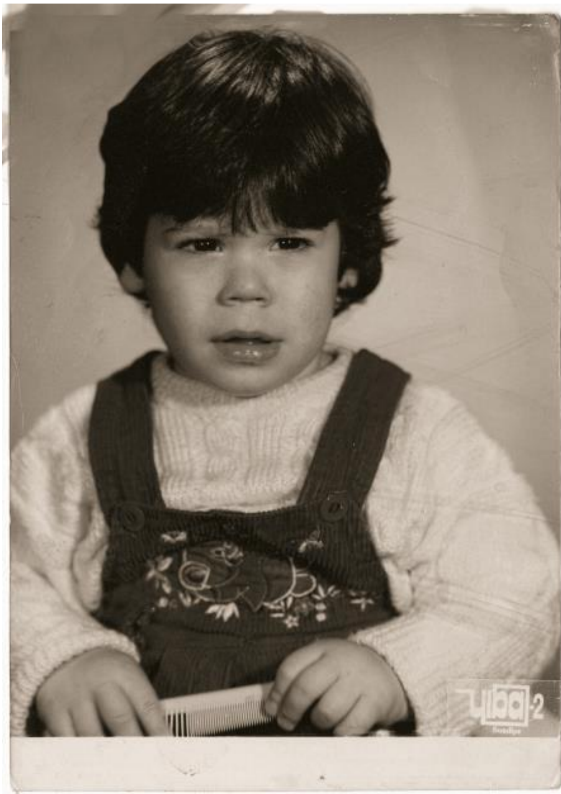
Здесь мне примерно 2 года