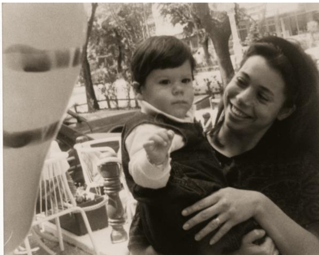
Мне два года