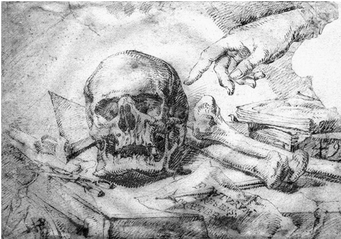
Якоб де Гейн. Ванитас. 1603

Что двигало палачами и жертвами – вопрос, на который можно ответить. Причем ответить на него даже легче, чем заглянуть в голову какому-нибудь современному извергу. Ведь те далекие времена злодеяния оставались в рамках закона, а значит, палачам не нужно было скрываться или таиться.