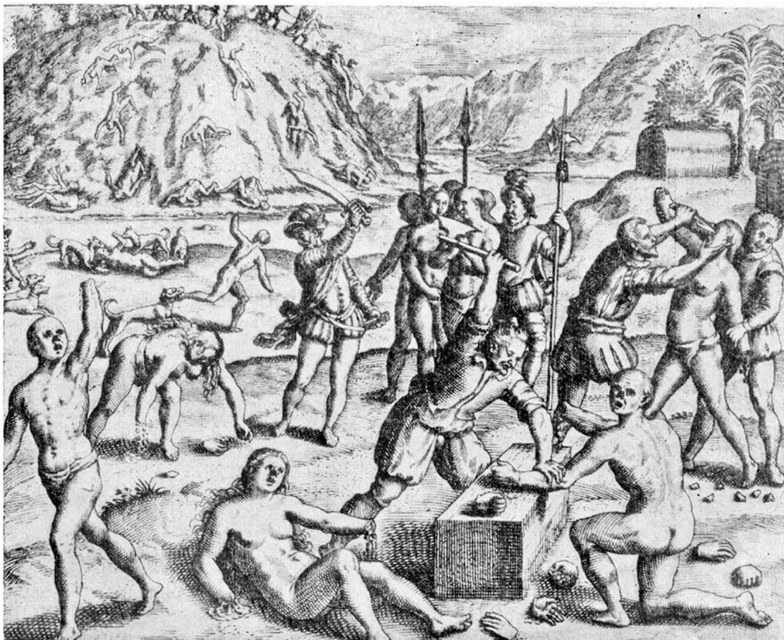
Отрубание рук. Гравюра из книги Б. де Лас Касаса «История Индии»

Отцу де лас Касасу вторили доминиканский приор Педро де Кордова и монах-доминиканец Антонио де Монтесинос. Эти люди дошли до самого престарелого короля Испании Фердинанда и открыли ему глаза на творящийся произвол, на то, что зверства конкистадоров заставляют индейцев смотреть на Христа «как на самого жестокого из богов» 10 .