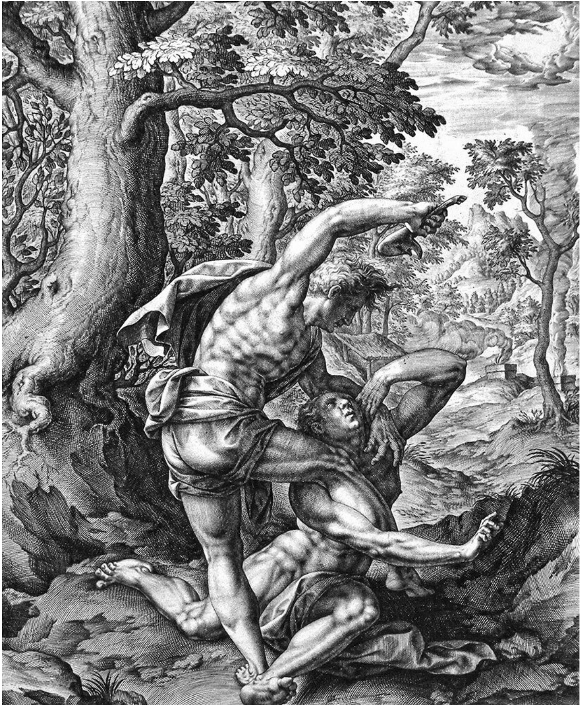
Каин и Авель. Гравюра XVI век

Таково было отношение к иным племенам и народам. А что же внутри племени или нарождающегося государства? Здесь дела обстояли иначе.