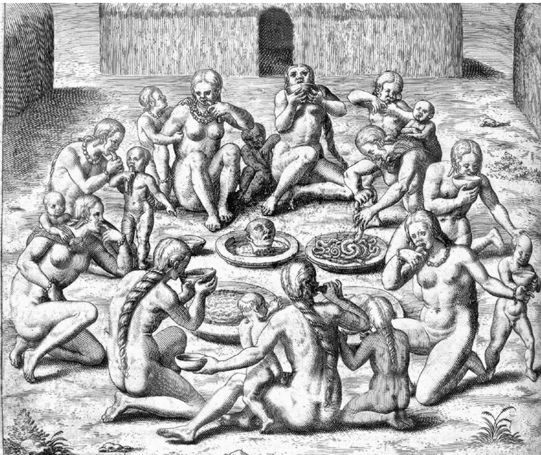
Каннибализм. Гравюра из книги Б. де Лас Касаса «История Индии». XVI век.

В те далекие века каннибализм был нередок: археологи находят кости людей со следами обгладывания. Одно человеческое племя могло напасть на другое племя как на потенциальную дичь, нападая именно ради охоты. Или же каннибализм сопутствовал захвату территории и убийству: не пропадать же ценному мясу.