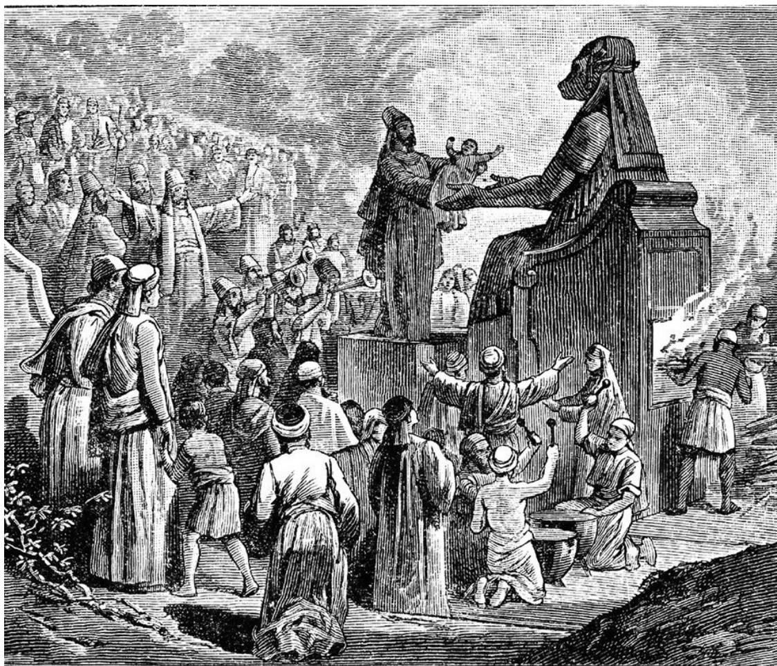
Жертвоприношение Молоху. Гравюра XIX века

Нечто похожее происходило и в соседней Финикии – Сирии, где существовал схожий культ. К сожалению, древние историки ничего не придумали и не преувеличили: близ храмов жутких божеств археологи нашли тысячи урн с обгорелыми младенческими останками.