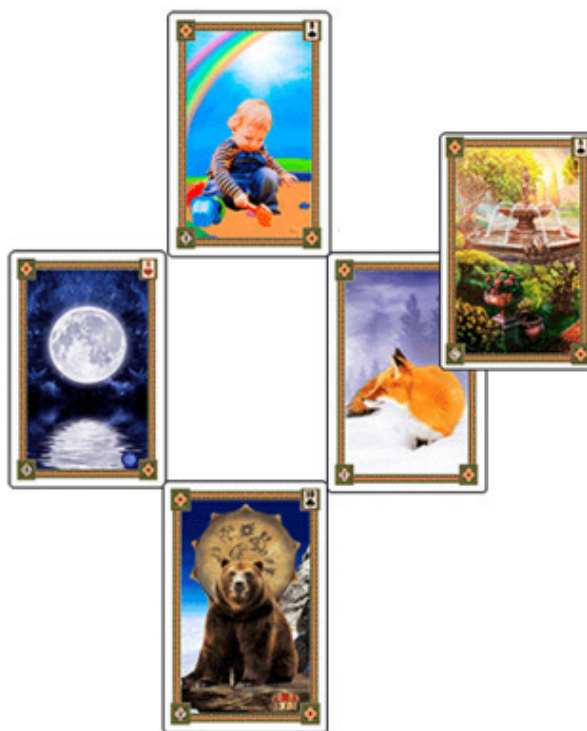
Рис.9 Расклад «Крест» – Пример №6

Как видите, карты очень точно отреагировали на моё состояние и дали ясный и понятный ответ. Начнём с первой карты, которой оказалась Луна. Действительно, моё внутреннее состояние крайне нестабильно в отношении этой работы. Я то убеждаю себя, что нужно продолжать, то говорю себе, что людям, наверное, не особо интересна такая подача материала, и,