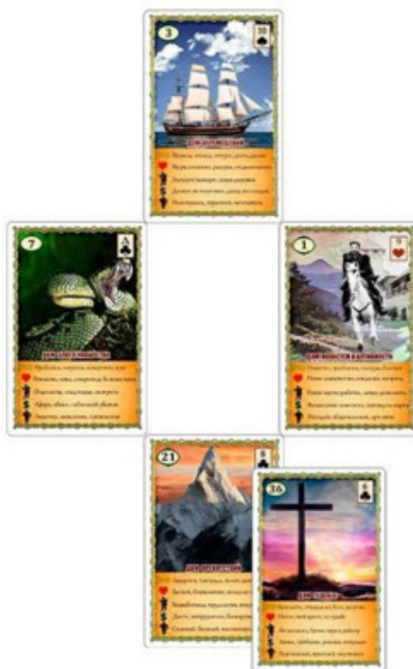
Рис.4 Расклад «Крест» – Пример №2

Карта Змея показывает, что сегодня у моей клиентки дела действительно идут не очень хорошо. Можно отметить наличие трудностей, отсутствие развития и прогресса, «топтанье на месте».