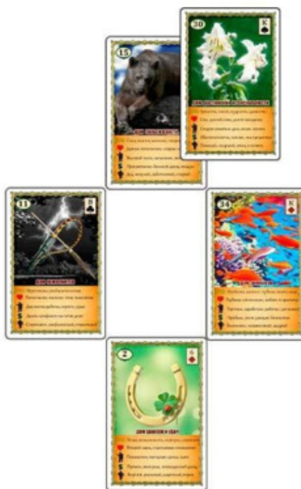
Рис.7 Расклад «Крест» – Пример №5

Основными значениями карты Плеть являются разговоры, получение информации, наведение порядка и чистоты. Когда же вопрос касается частей тела, то Плеть обозначает нервы и руки. Отсюда предполагаем, что, возможно, проблема заключается в нервном напряжении или чрезмерно тяжёлой нагрузке на спину. Женщина работает бухгалтером, всё время сидит перед экраном. Карта Плеть может обозначать любую физическую активность, особенно работу руками, а сидение за компьютером, в общем-то, и предусматривает работу руками. И всё же, женщине стоит выяснить получше о своём недомогании, так как карта Плеть несёт идею исследования, изучения и разведывания.