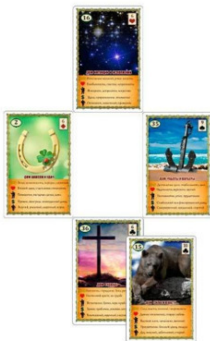
Рис.6 Расклад «Крест» – Пример №4

Карта Клевер говорит сразу о двух вещах. Во-первых, сейчас женщина довольна своей работой, и она её устраивает. Как минимум ей нравится то, что она делает. Во-вторых, Клевер указывает на что-то короткое либо временное. Следовательно, можно предположить, что у клиентки неполный рабочий день или короткая рабочая неделя. Оказалось, что действительно, она работала всего два дня в неделю.