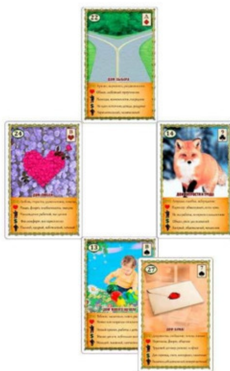
Рис.5 Расклад «Крест» – Пример №3

Итак, карта Сердце показывает, что женщина любит свой бизнес и с душой относится к тому, что она делает. В позиции №2 мы видим карту Лиса. Как известно, карта Лиса напоминает об осторожности, обозначает хитрость, обман или самообман, ошибку, неверный путь, плохое время для чего-либо. Иногда Лиса предлагает выждать более подходящего момента.