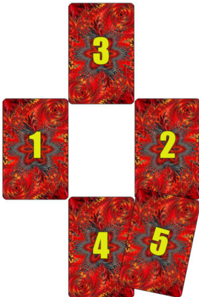
Схема расклада показана на рис. 2.

Напомню, что в гадании на любых картах, информацию выдают не сами карты, а наше подсознание, которое является частью Тонкого, невидимого мира.