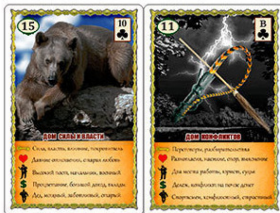
Рис.8 Мануальный терапевт или массажист

Карта Медведь в позиции №3 советует обратиться к специалисту или начать делать физические упражнения для укрепления спины.