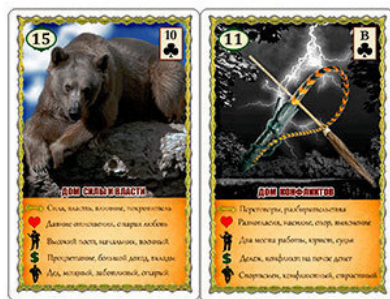
Рис.8 Мануальный терапевт или массажист

Карта Медведь в позиции №3 советует обратиться к специалисту или начать делать физические упражнения для укрепления спины.