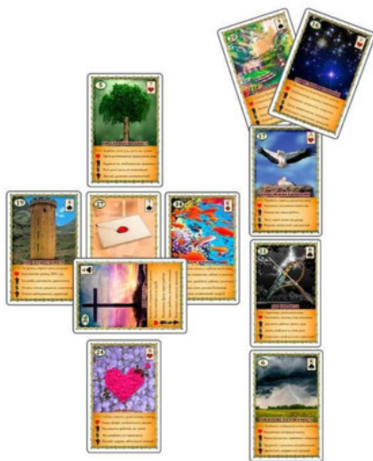
Рис.12 Расклад «Кельтский Крест» – Пример №2

В этом случае я не выкладывал сигнификатор, просто разложил все карты по представленной выше схеме. Однако прежде чем продолжить, я должен вам кое-что пояснить.