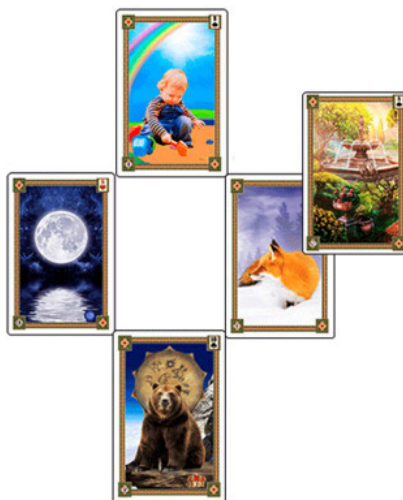
Рис.9 Расклад «Крест» – Пример №6

Как видите, карты очень точно отреагировали на моё состояние и дали ясный и понятный ответ. Начнём с первой карты, которой оказалась Луна. Действительно, моё внутреннее состояние крайне нестабильно в отношении этой работы. Я то убеждаю себя, что нужно продолжать, то говорю себе, что людям, наверное, не особо интересна такая пода-