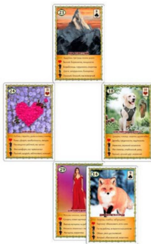
Рис. 3 Расклад «Крест» – Пример №1

Начинаем разбор с карты Сердце. Она говорит о сердечности, сострадании, душевности, готовности помочь, о сочувствии и милосердии, а также о том, что лежит у этой женщины на душе. Значит, вопрос целительства является для неё важной темой. Возможно ей нравится этим заниматься, и сложившаяся ситуация вызывает глубокий эмоциональный отклик в её сердце. Она – переживает. Карта также может указывать на род деятельности клиентки – оказание помощи, что и являлось основной темой её вопроса.