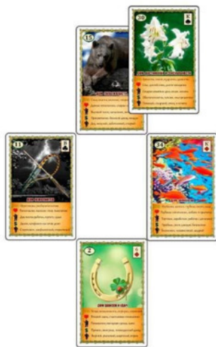
Рис.7 Расклад «Крест» – Пример №5