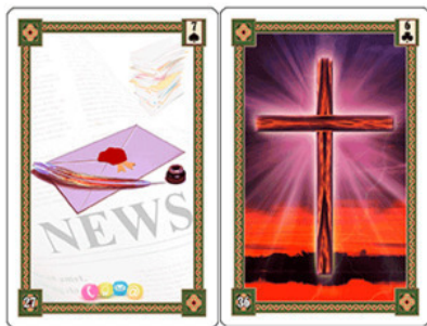
Рис.13 Протокол испытаний, отчёт о проверке, результат анализов или обследования

Карта Крест соответствует понятиям «проверка, испытание, инспекция, тест, проба» и в данном случае реально обозначала контроль и экспертизу сырья.