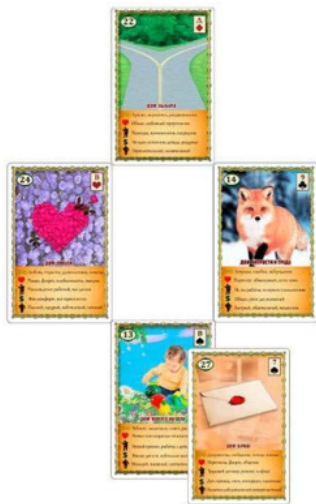
Рис.5 Расклад «Крест» – Пример №3

Итак, карта Сердце показывает, что женщина любит свой