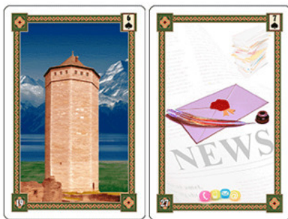
Ри.14 Официальные документы

ном ключе и груз освободят, или, как говорят таможенники, «выпустят». Карты Рыбы – это ещё и символ свободы.