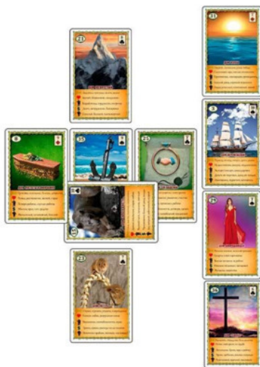
Рис.11 Расклад «Кельтский Крест» – Пример №1

Позиция №1: Так как тема расклада была известна изначально и вопрос относился к работе, то в качестве сигнификатора была выложена карта Якорь.